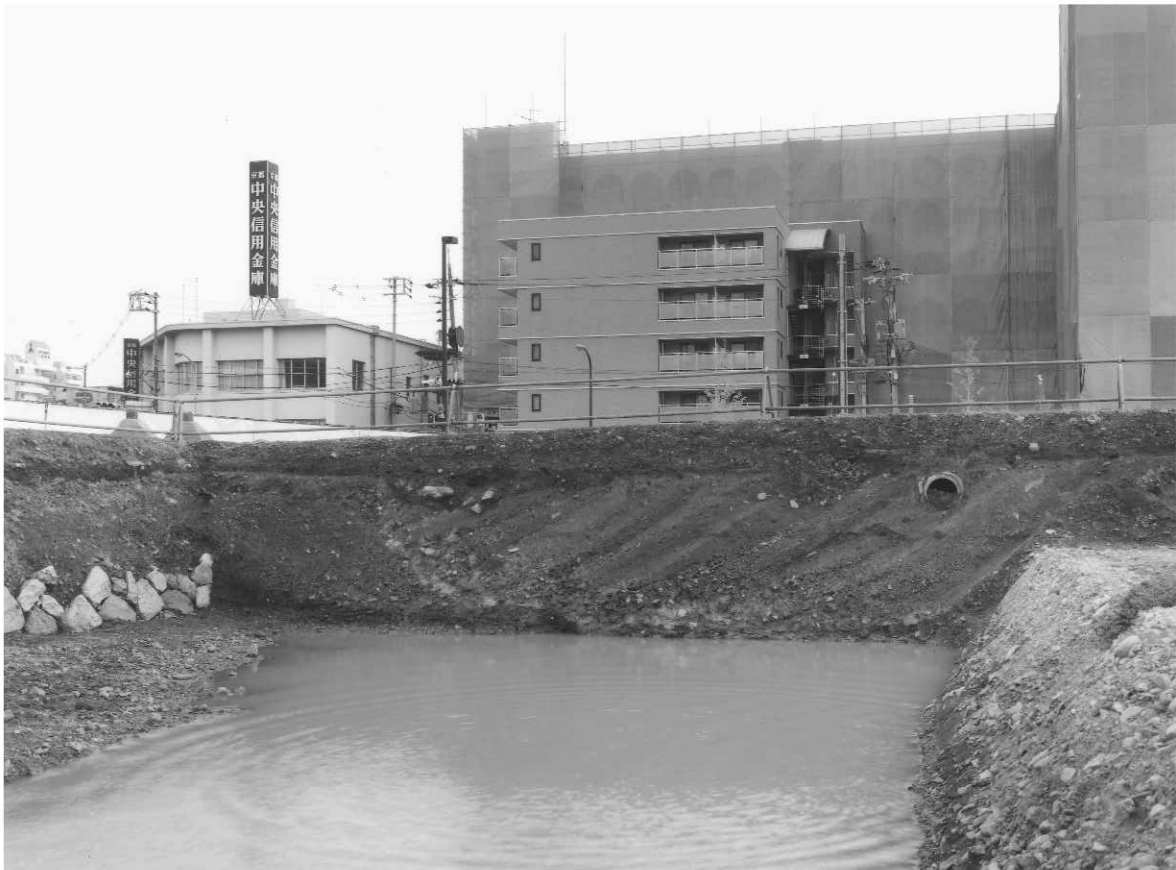
2 西高瀬川舟入りSD70断面（北から）