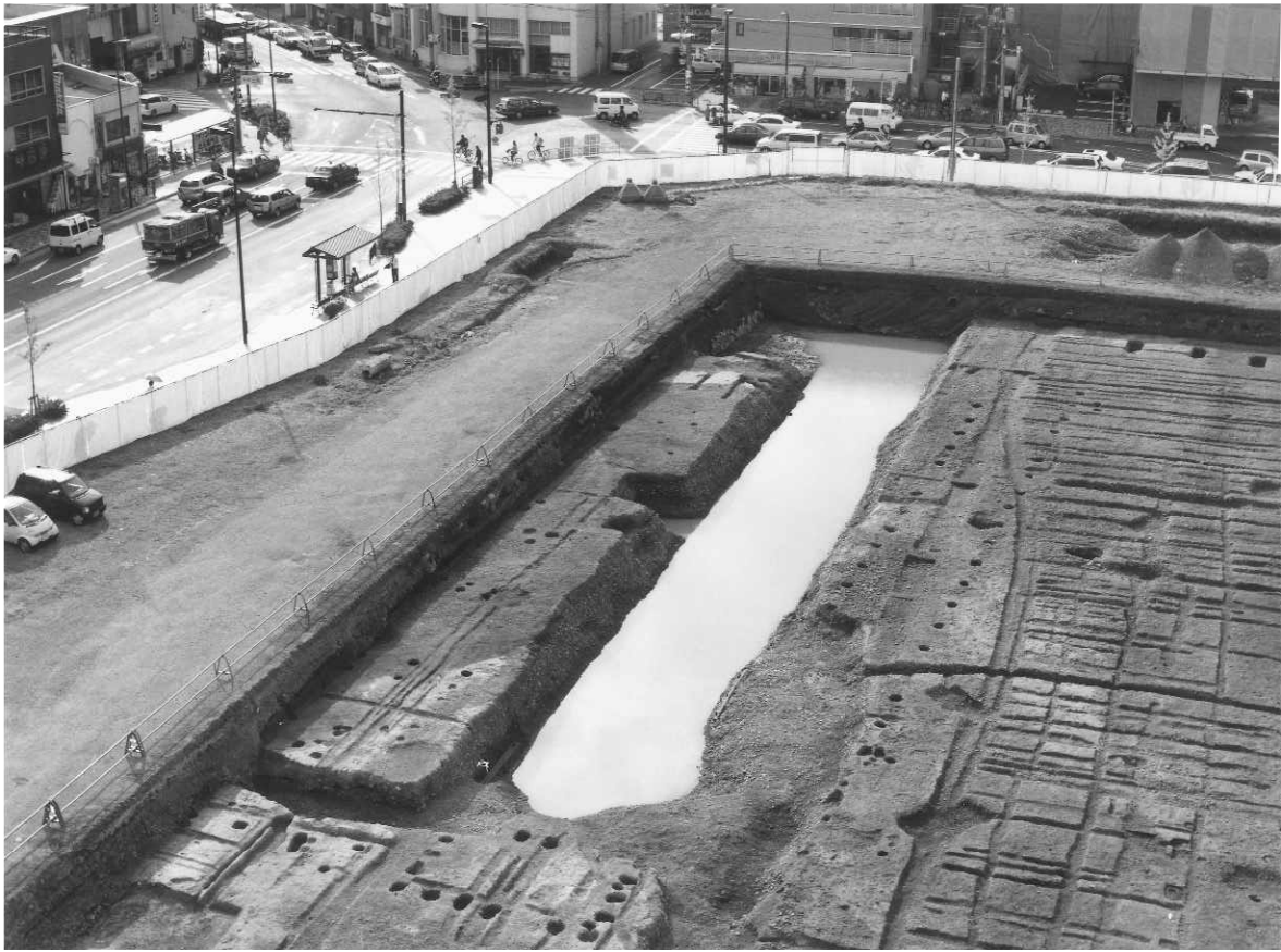
1 西高瀬川舟入りSD70（北西から）