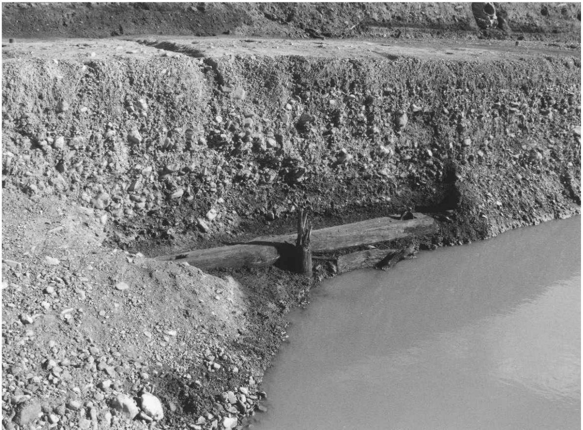
2 西高瀬川舟入りSD70接岸遺構（西から）