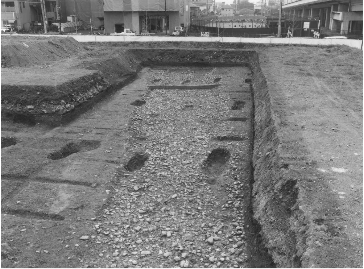
1 SX308 (北から)