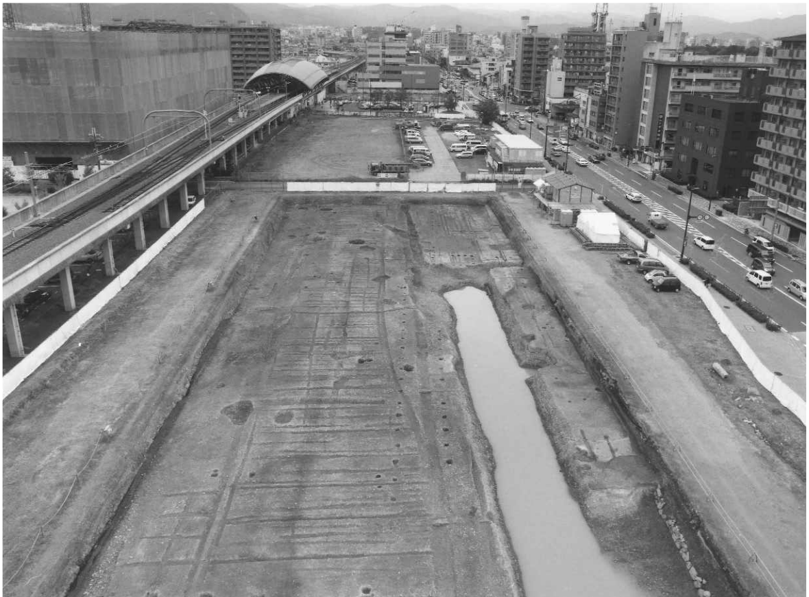
2 調査区全景（南から）