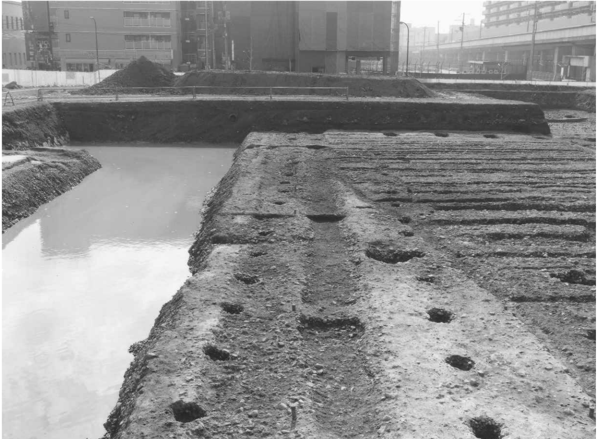
2 SD100・SD337 (北から)