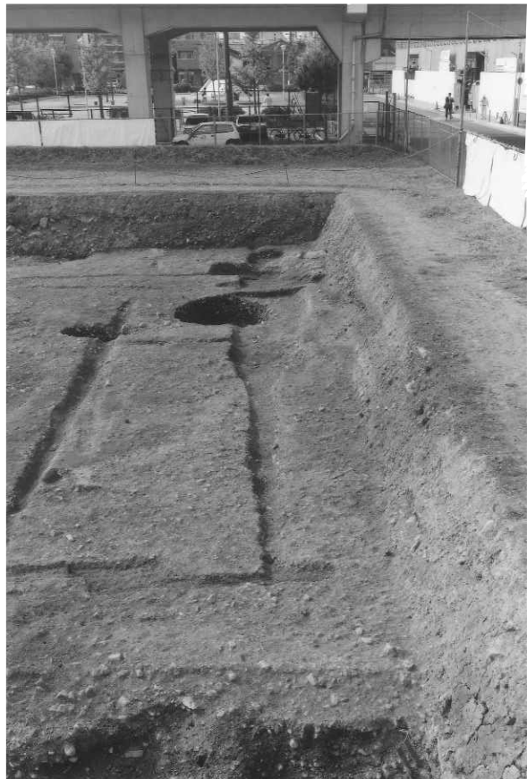
3 SD 9 (東から)