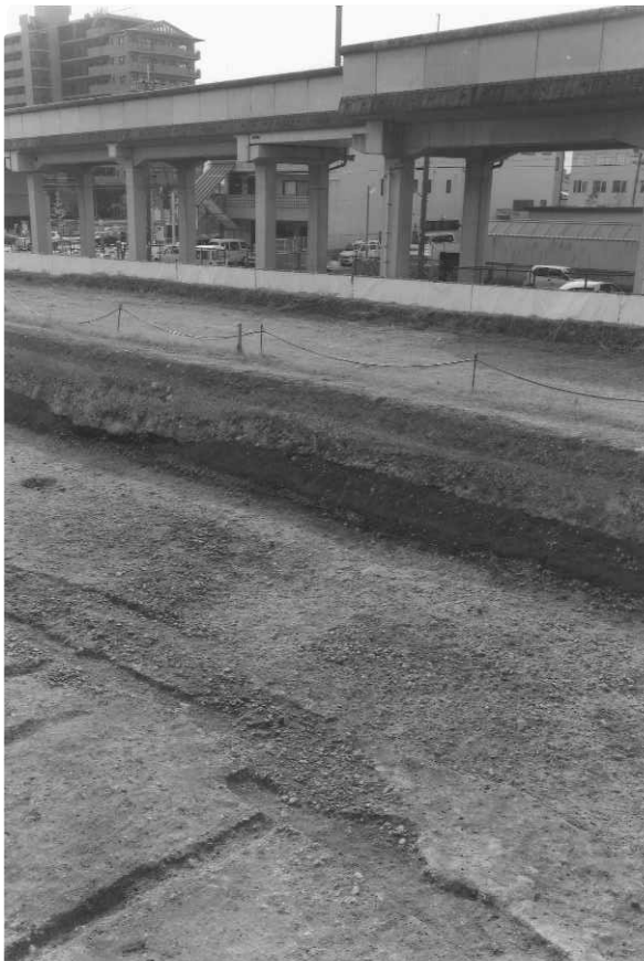
2 SX307 (北東から)