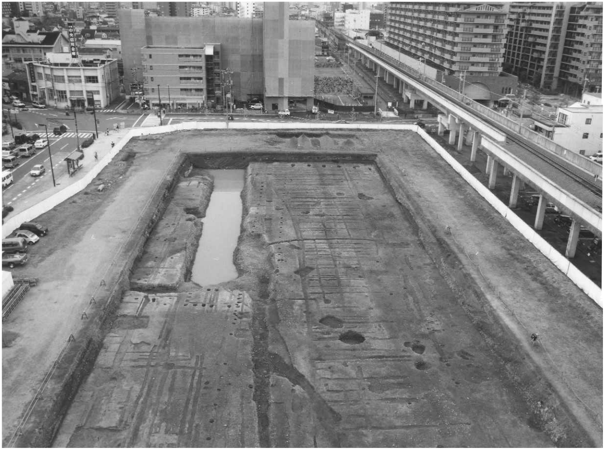
1 調査区全景（北から）