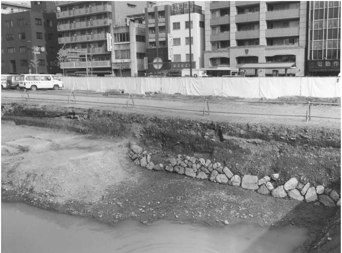
1 西高瀬川舟入りSD70石垣（南西から）