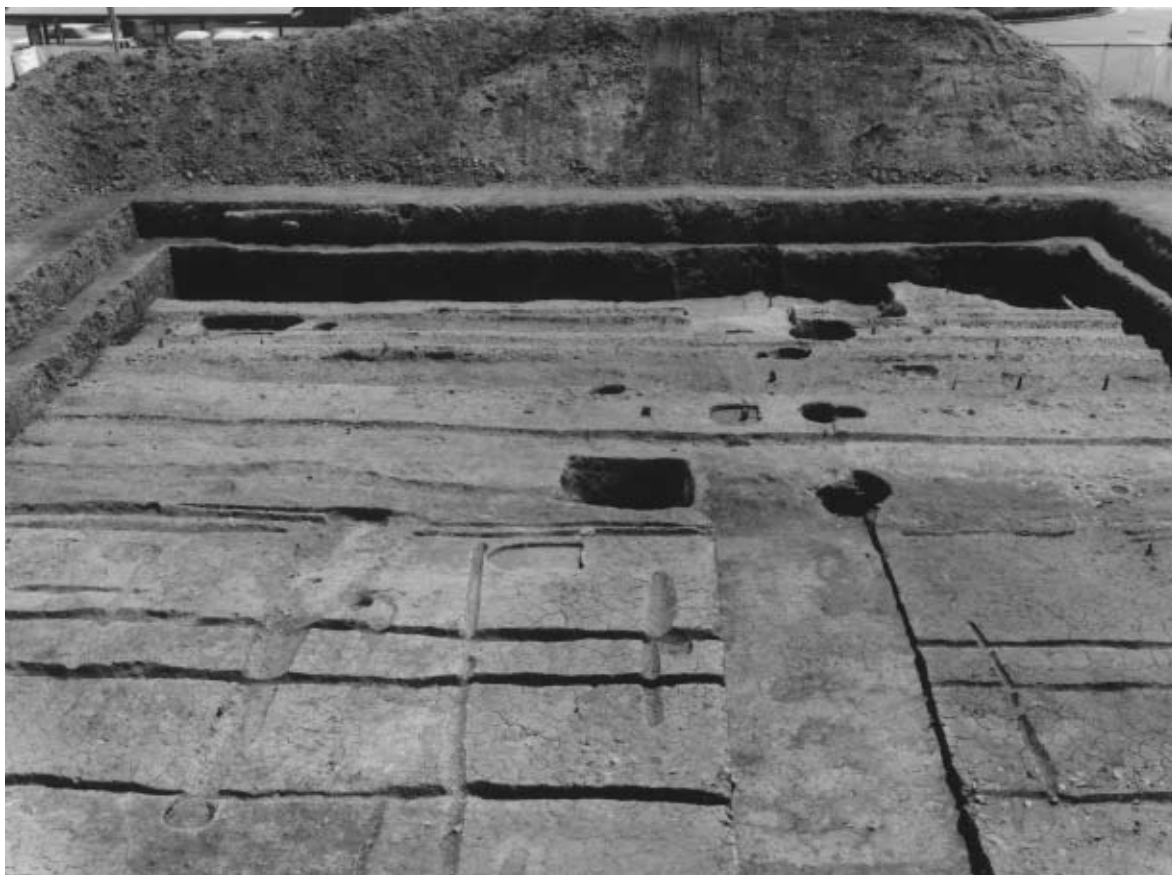
1 調査区全景 第1面（西から）