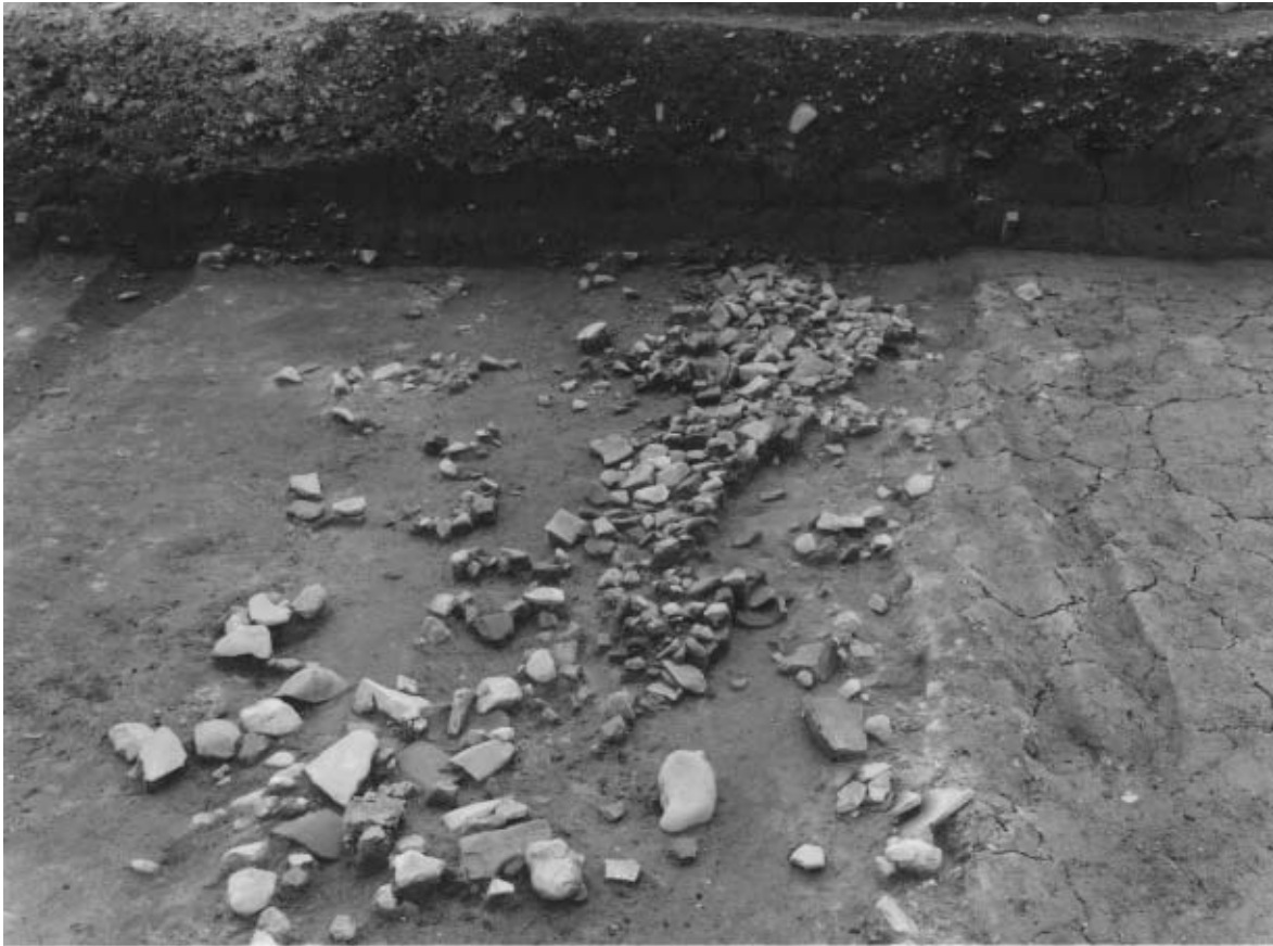
1 溝64上面遺物出土状況（北から）