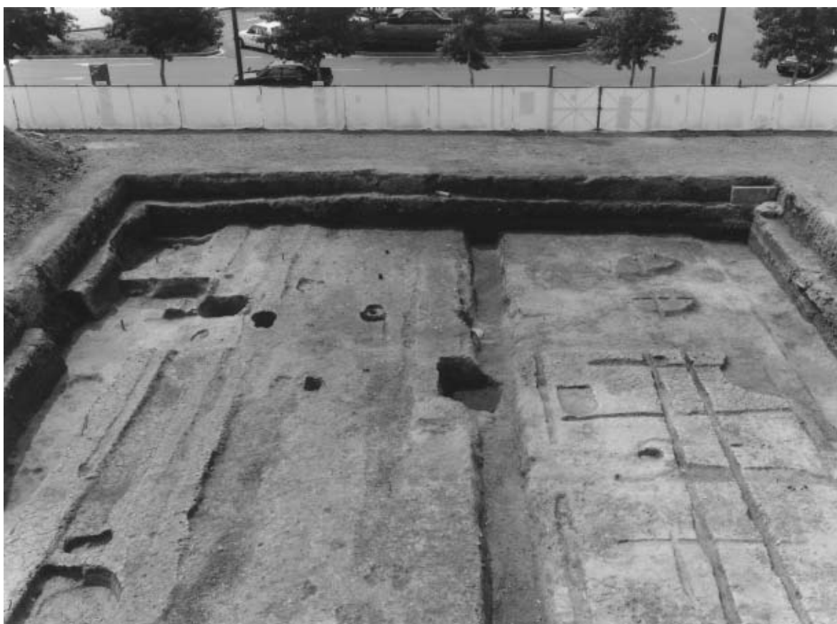
2 調査区全景 第2面（北から）