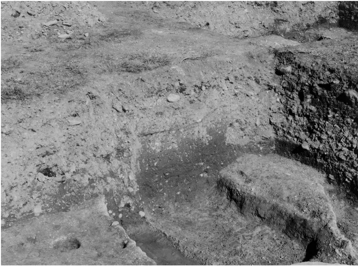
1 1-1区溝1検出状況(南西から)