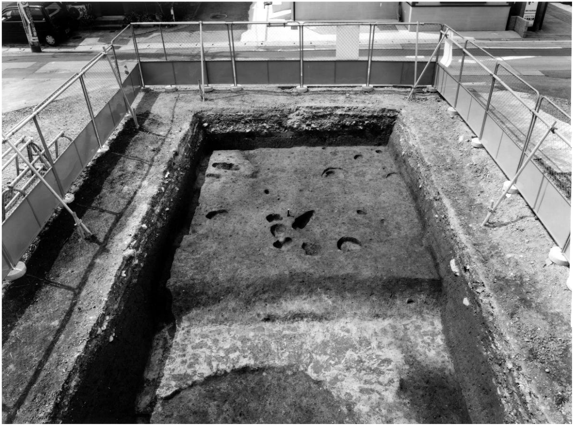
1 調査区全景（東から）