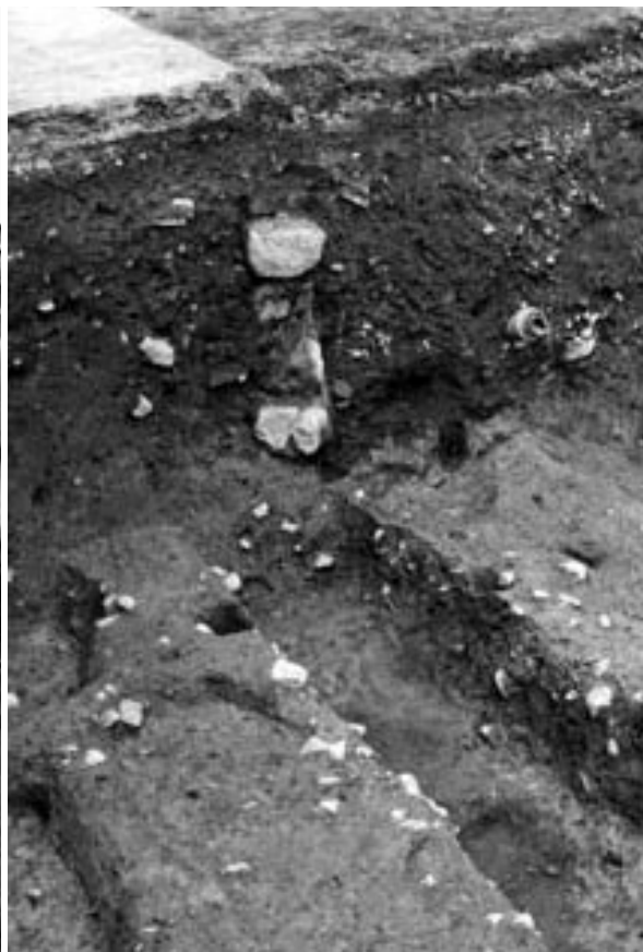
3 SD119 南端部（北東から）