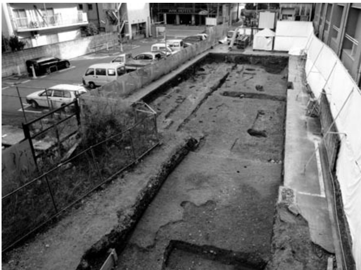
1 第1面全景（北西から）