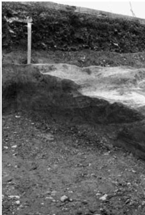
3 流路SD220 東西断割断面（南東から）