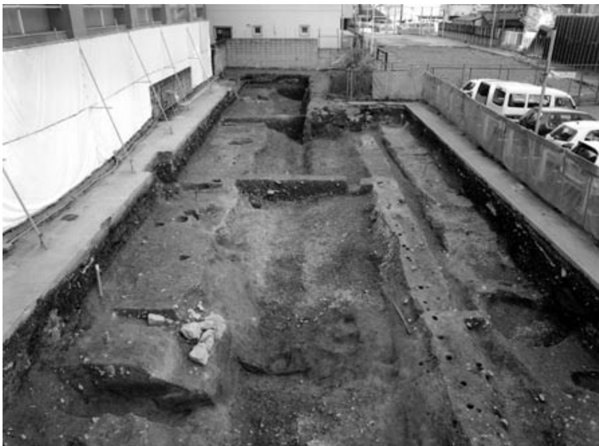
2 第2面全景・SD115・SD119（南から）