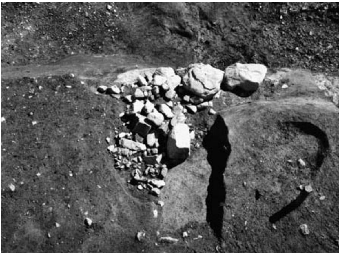
2 SK130 (西上から)