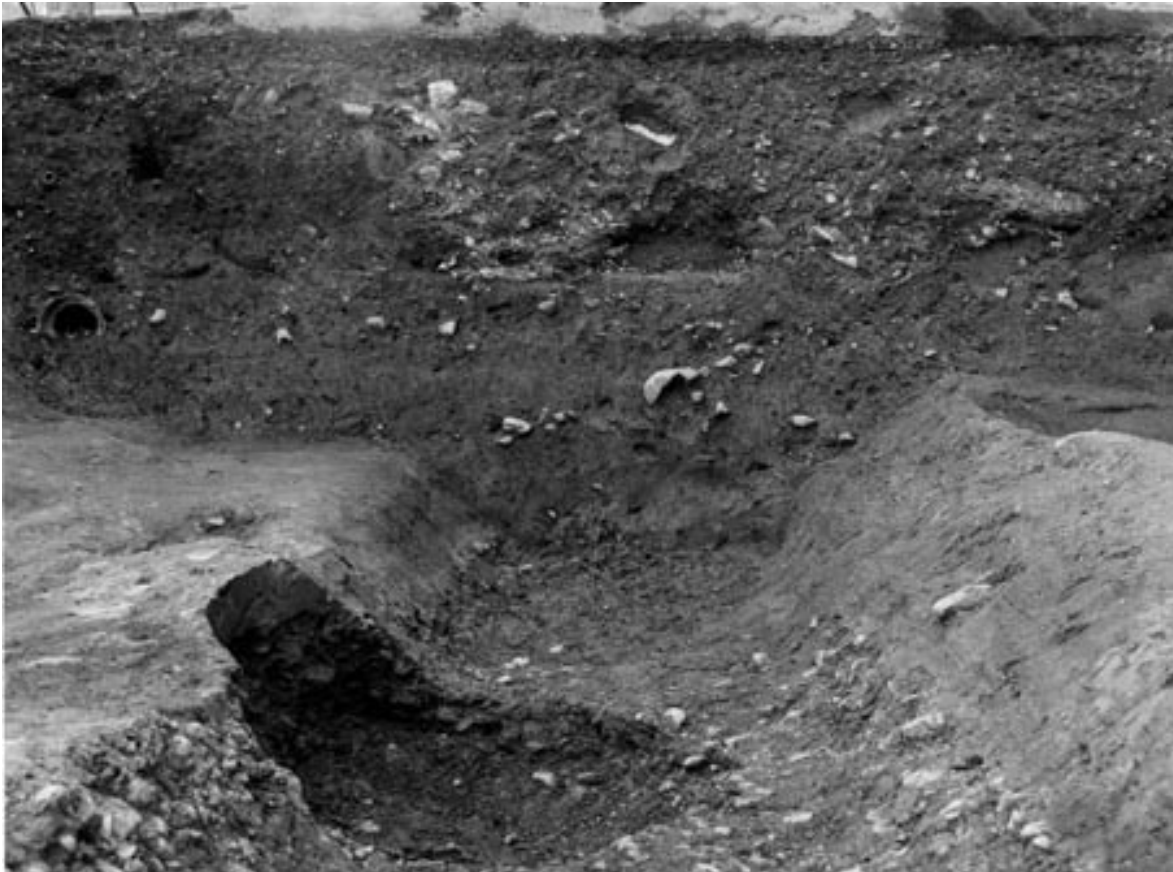
1 SD155 南壁断面（北から）