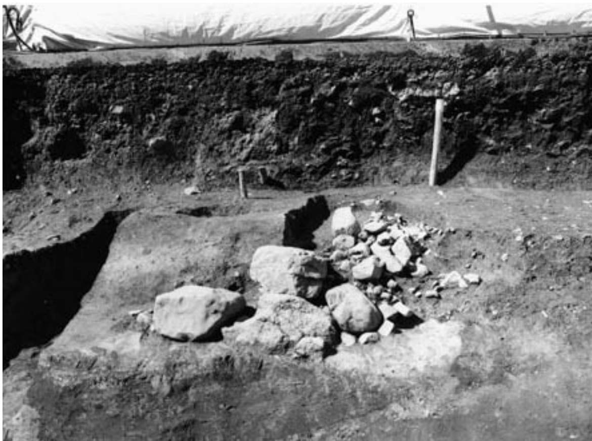
1 SK130 (北東から)