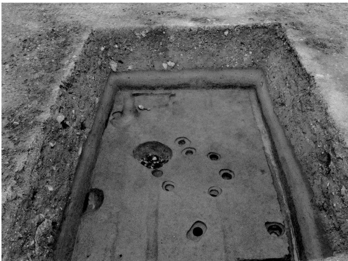
1 北調査区全景（西から）