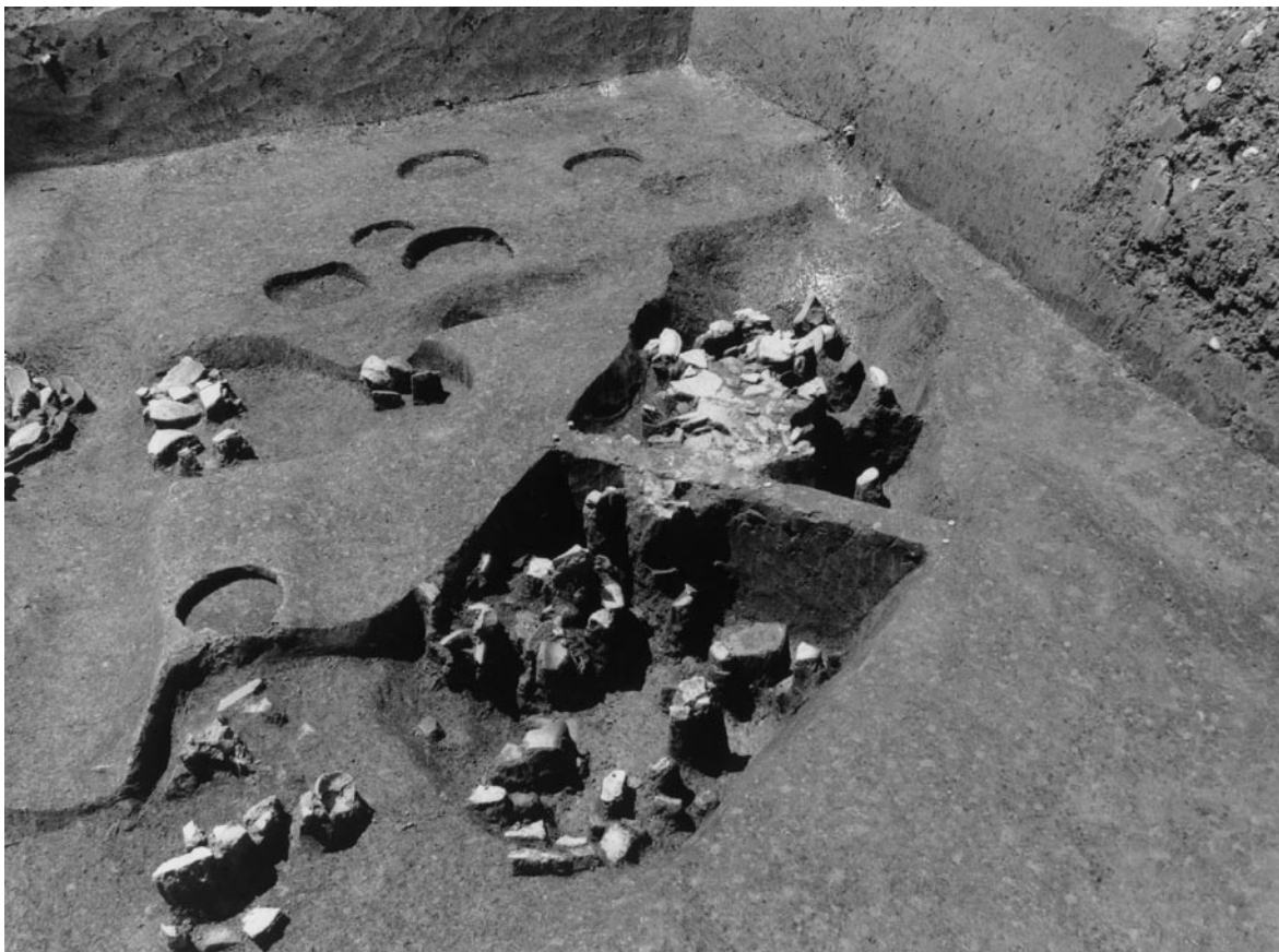
2 南調査区土坑1 (北東から)