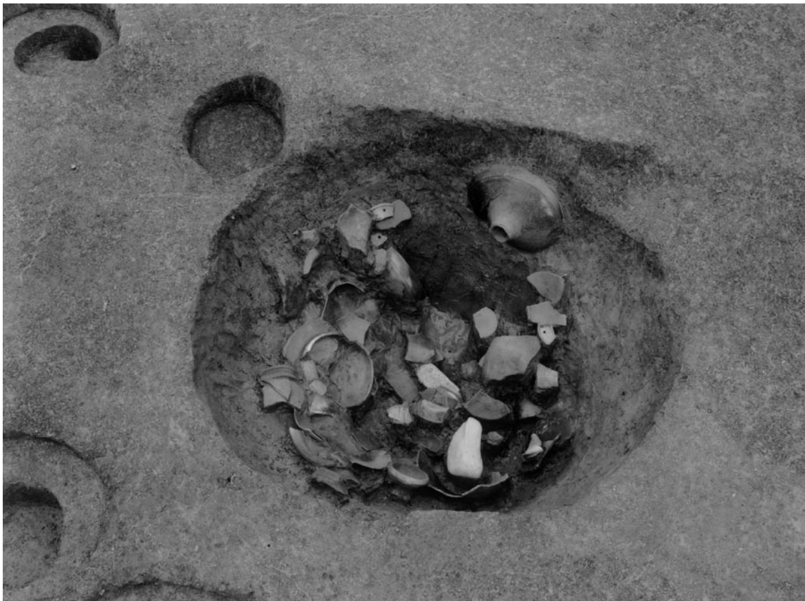
1 北調査区土坑1 (南東から)