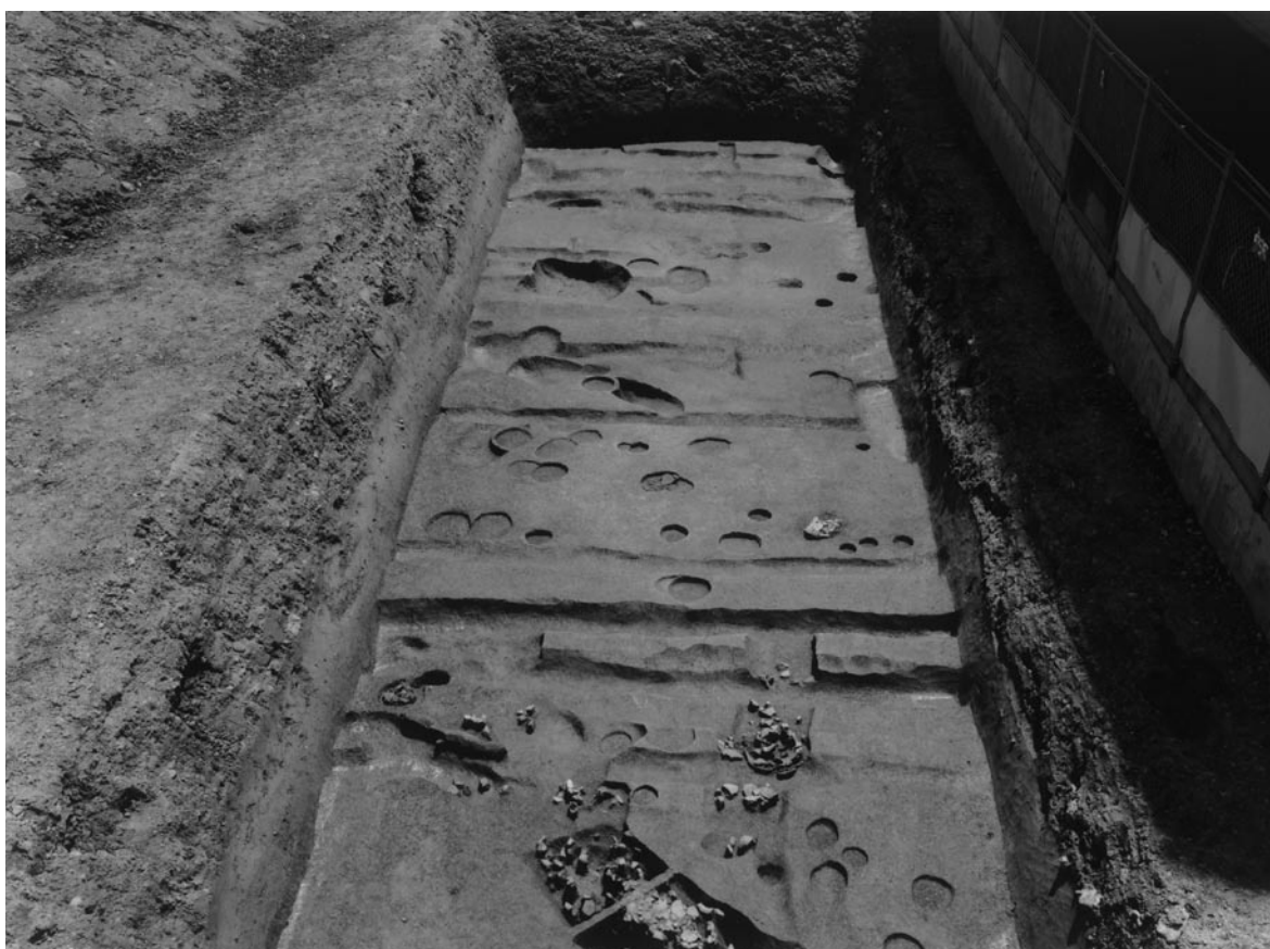
2 南調査区全景（西から）