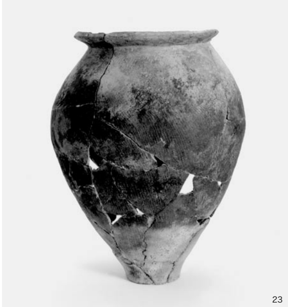
北調査区土坑1出土土器