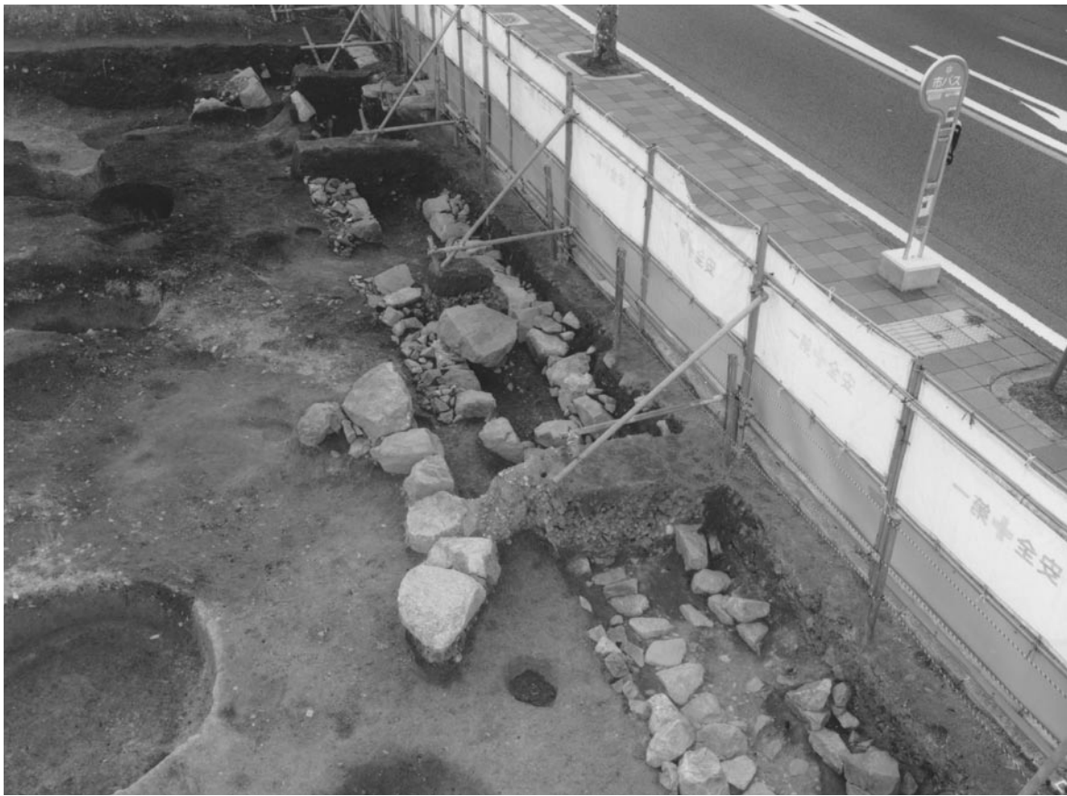
1 石組側溝（北東から）