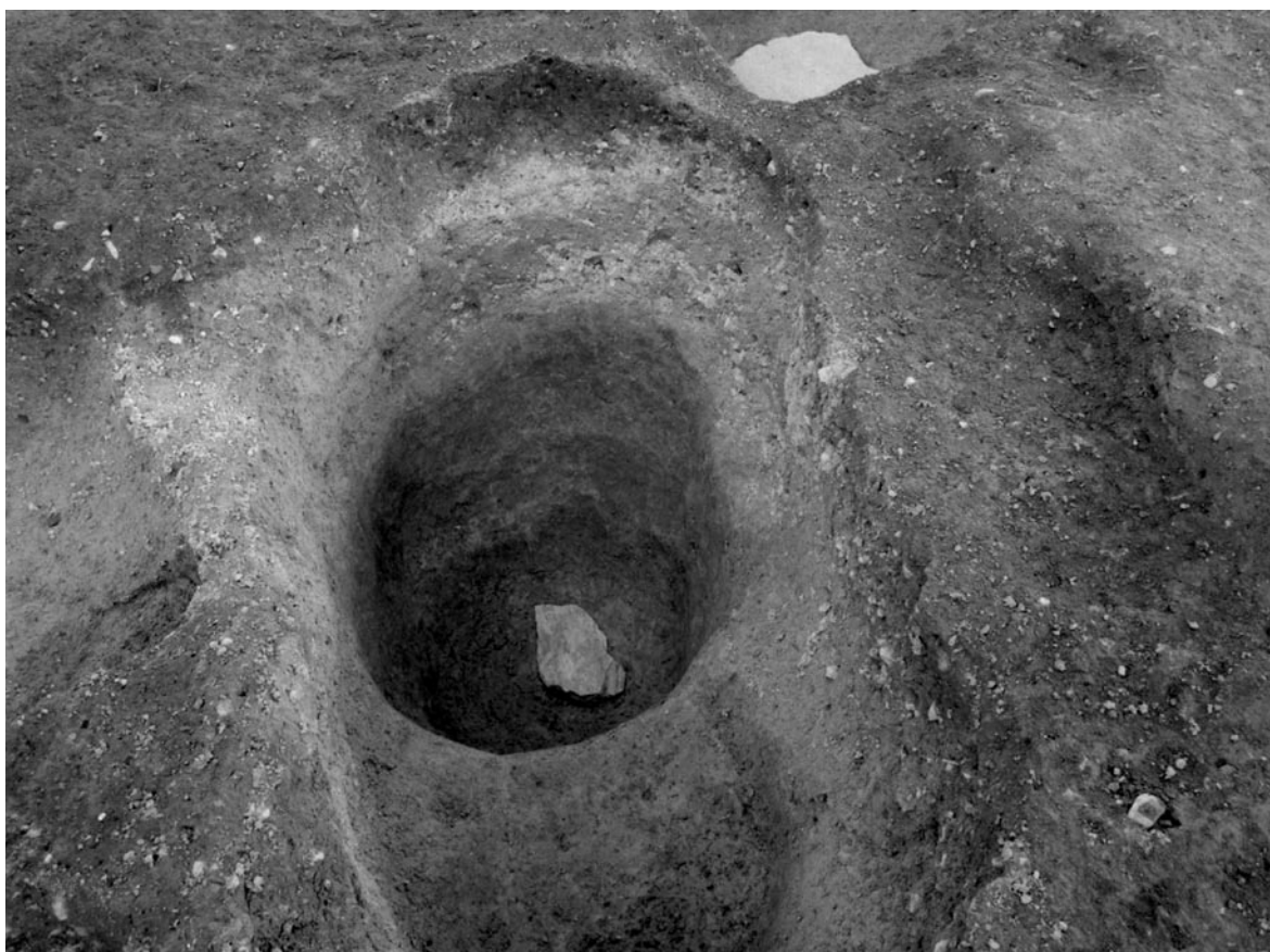
1 礎石土坑1 (東から)