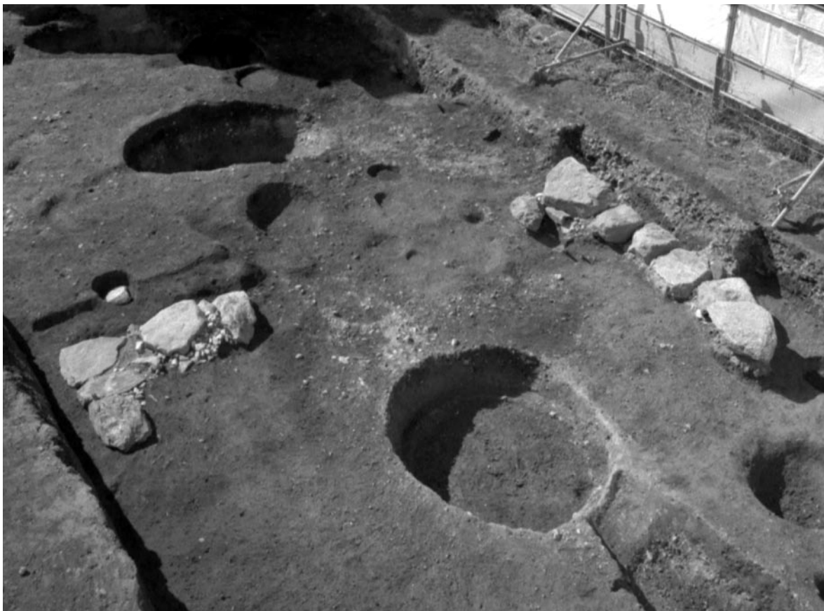
2 石垣基礎（北東から）