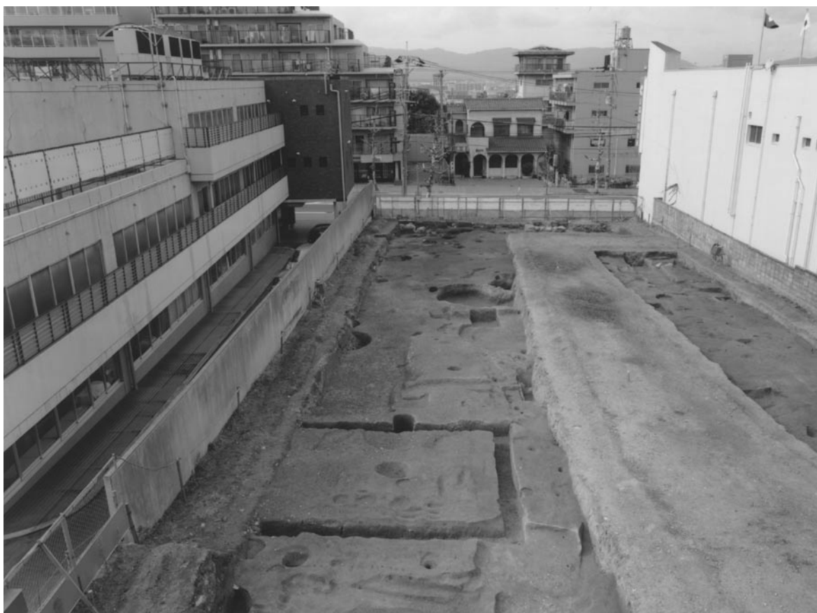
1 調査区全景（東から）