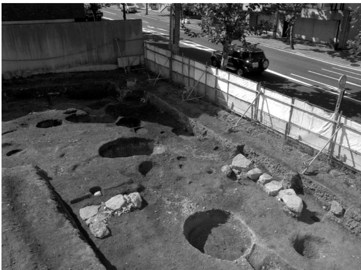
2 調査区西側全景（北東から）