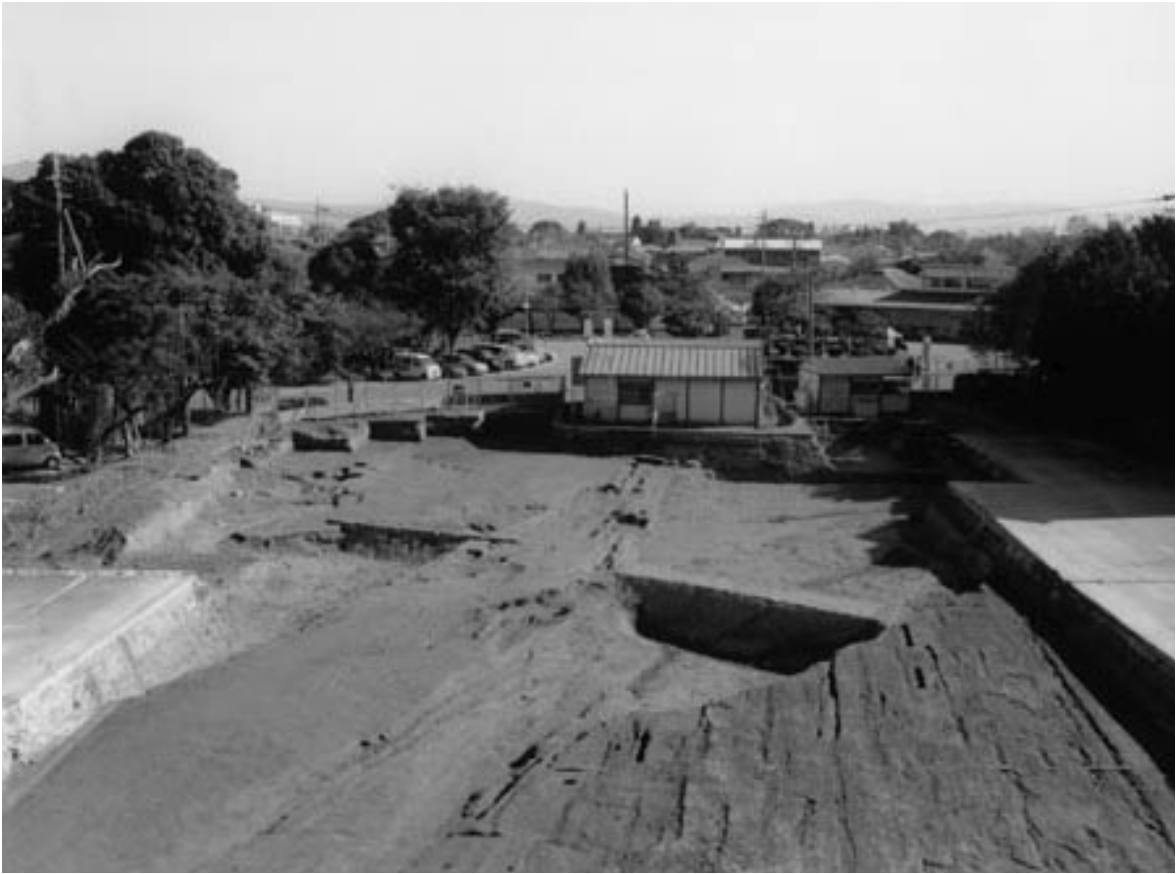
1 第2面東半全景（西から）