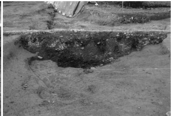
4 川 2 断面 (東から)