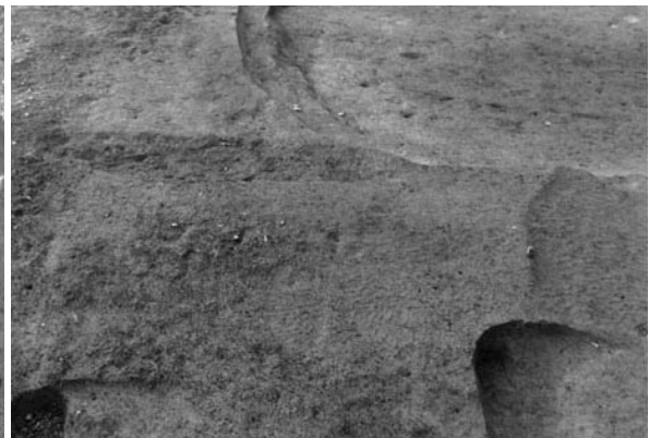
8 畦畔 54 ~ 56 (東から)