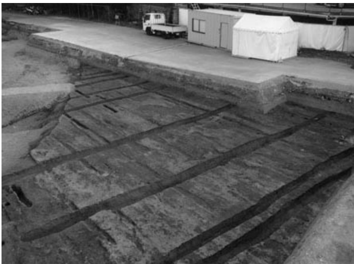
2 田 44 下層溝群 (北西から)