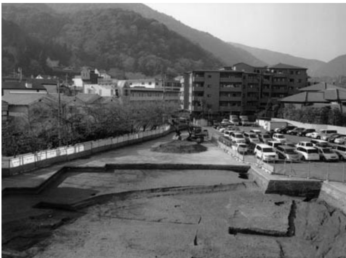
2 第1面西半全景（東から）