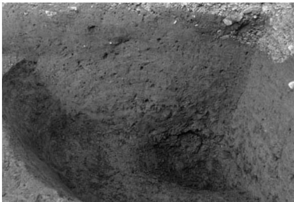
7 土坑 13 (南から)