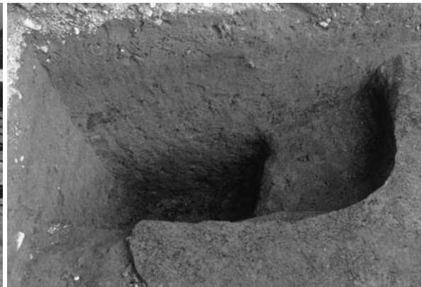
6 土坑 12 (西から)