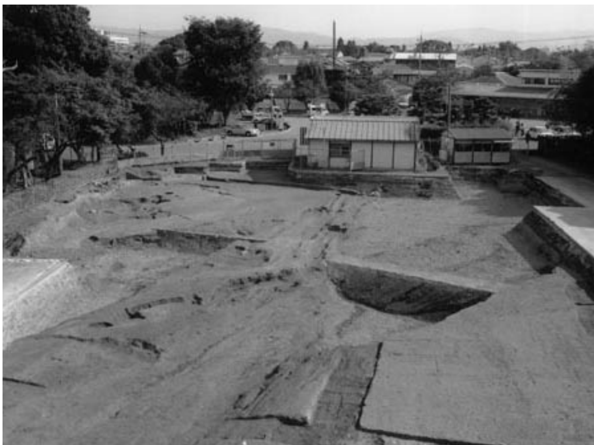
1 第1面東半全景（西から）