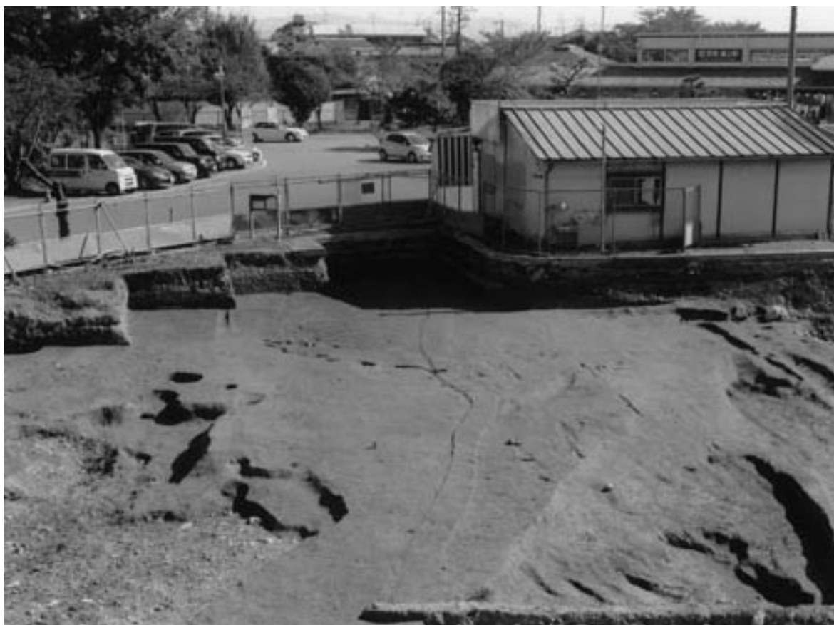
1 田 58・59、畦畔9 (西から)