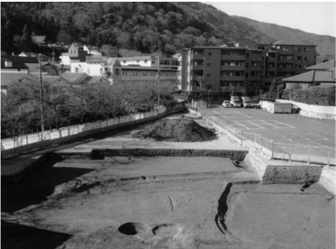
2 第2面西半全景（東から）