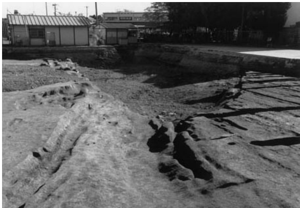
5 川 1 完掘状況 (北西から)