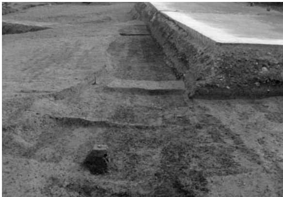
3 土坑 3 (西から)