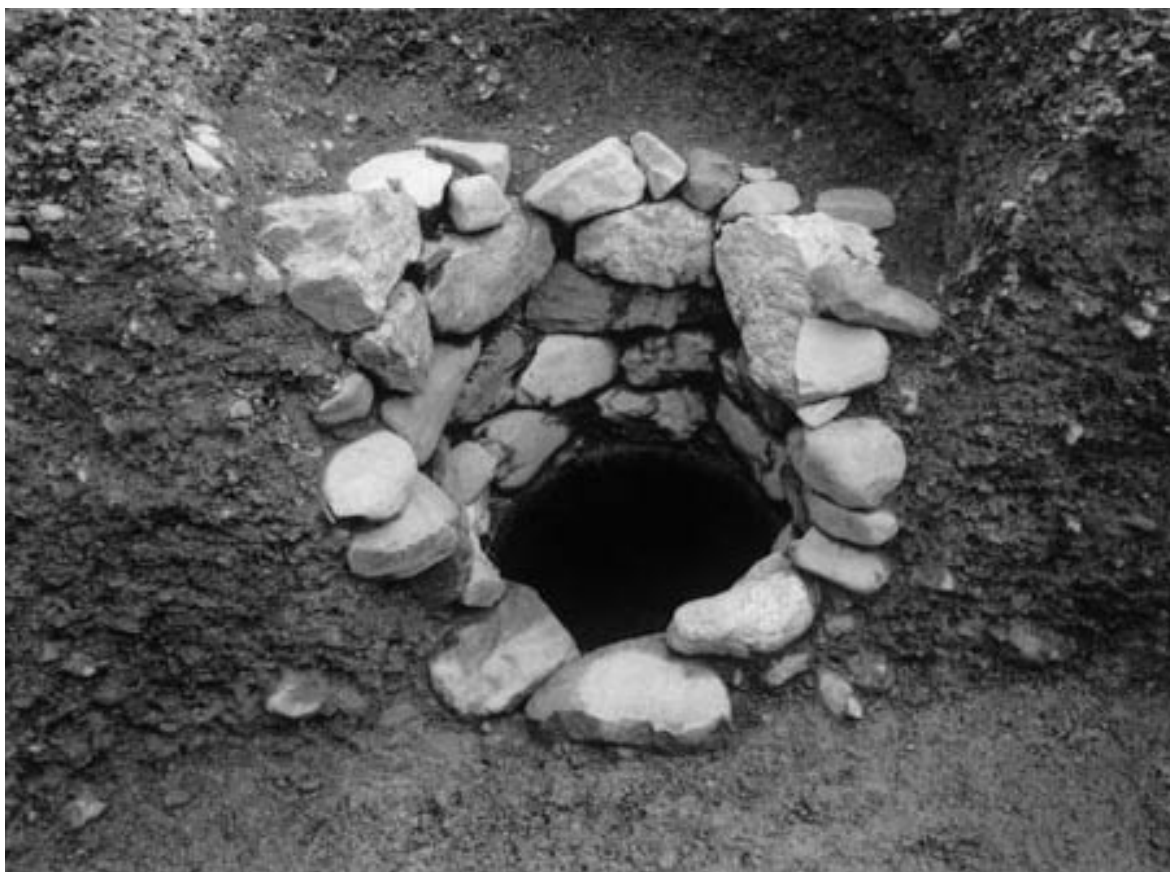
2 井戸 124 半裁 (南から)