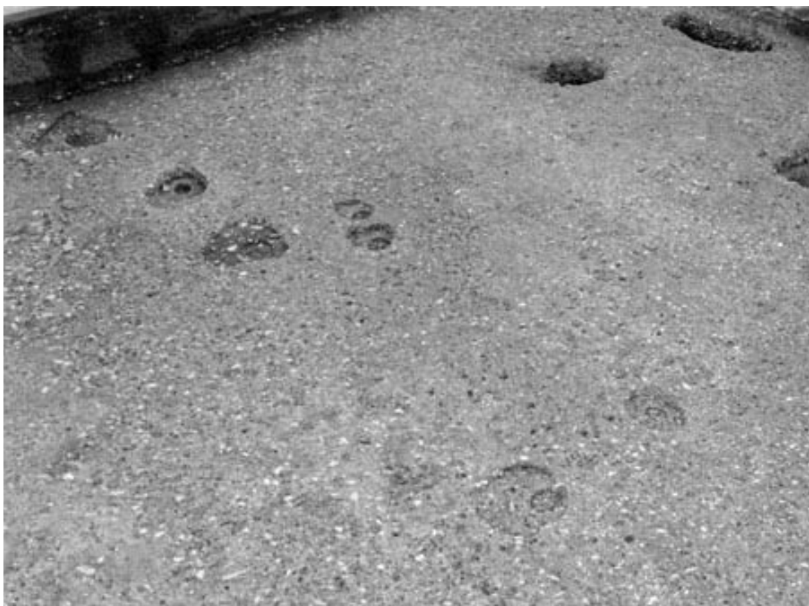
1 門2 (北西から)