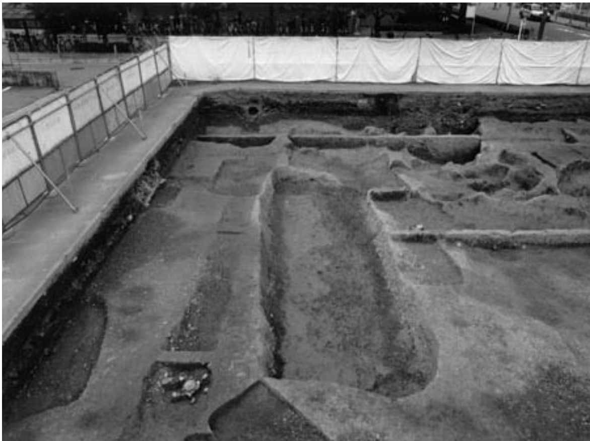
1 溝3および溝110（東から） 左側が溝110、その奥に土坑16