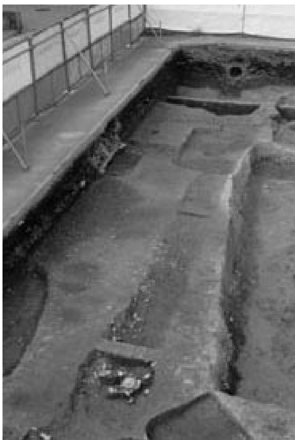
1 溝 110 (東から) 左奥が溝 134・139