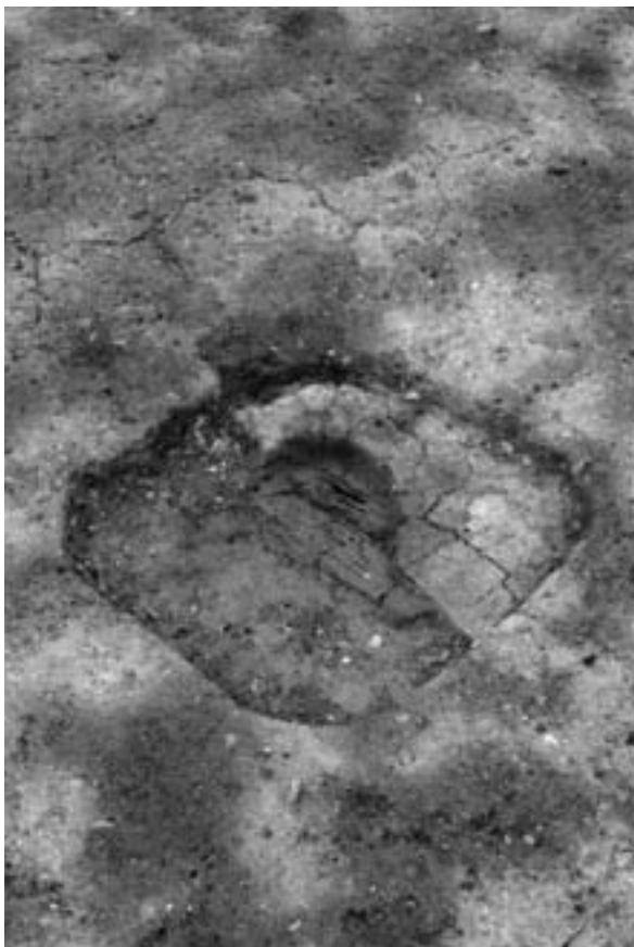
2 柱穴65 礎板出土状況 (北東から)