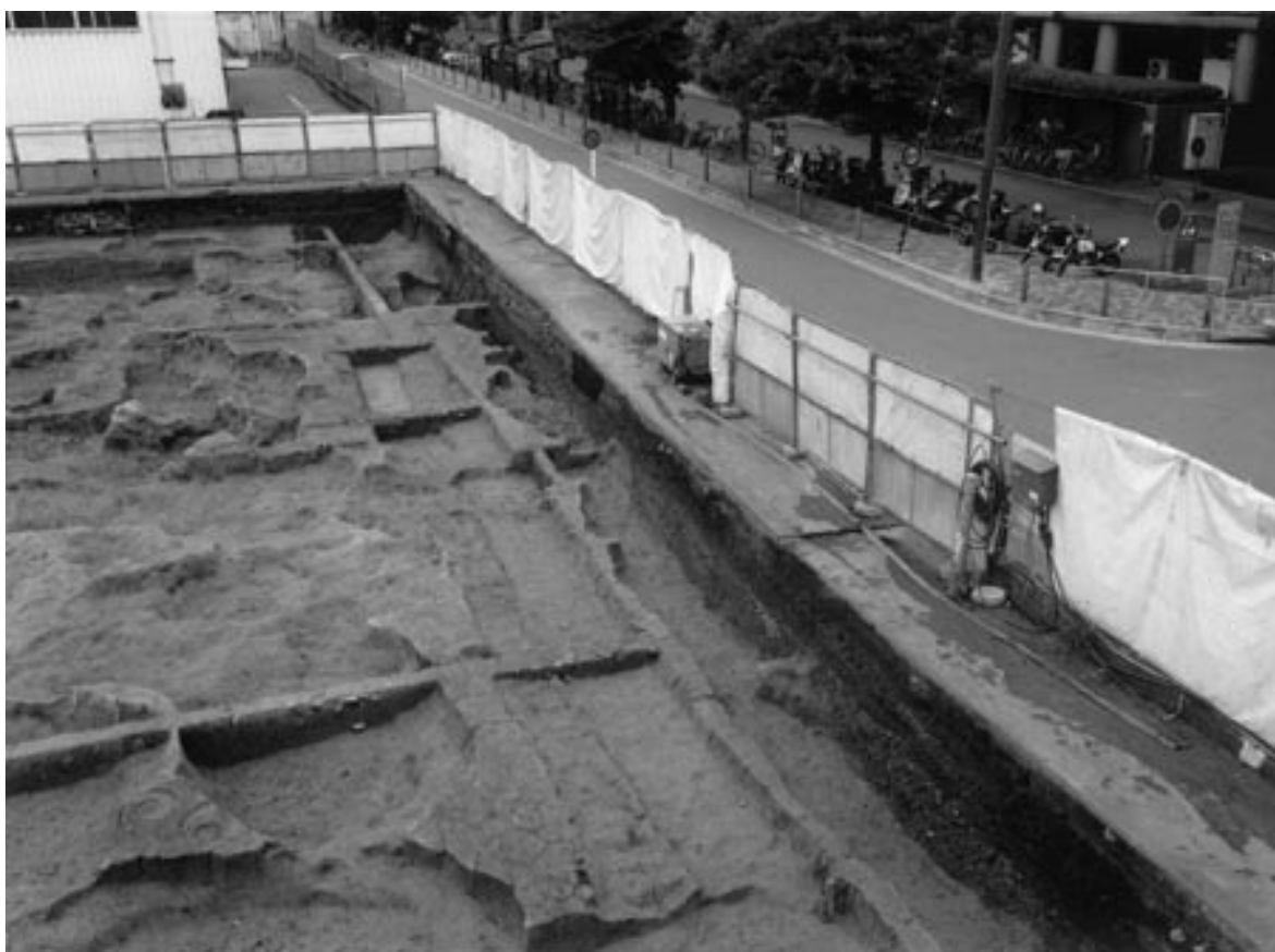
3 溝 44・48 (北から) 溝の左側が整地土 171