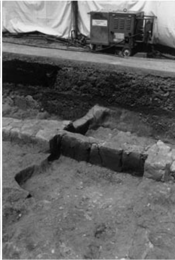
2 土坑 136 (北東から)