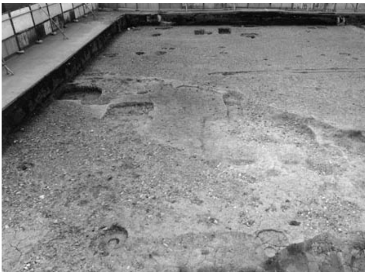
2 門3および土坑262 (北から) 奥が門2