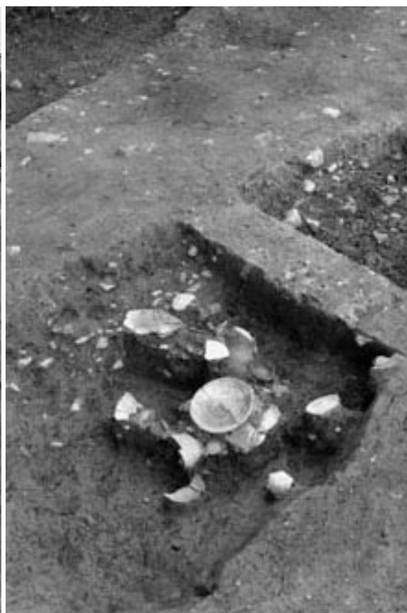
2 溝 110 土師器皿出土状況 (北東から)