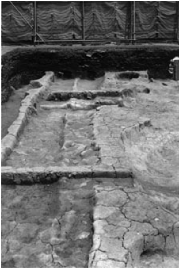
1 溝 44・48 北部 (南から)