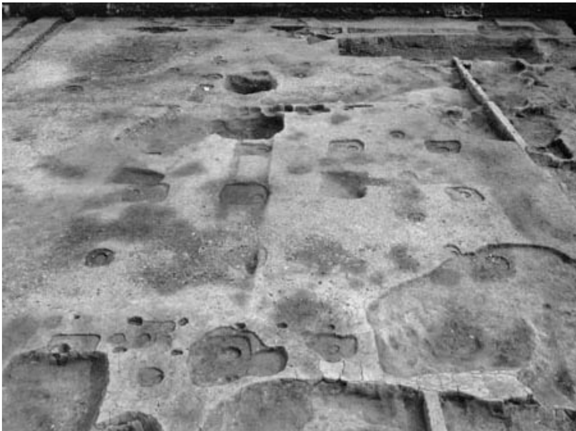
1 建物1 (北から)