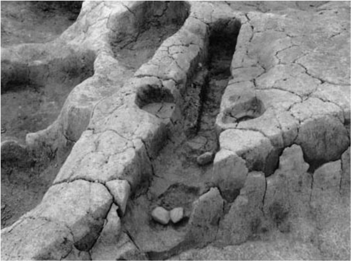
1 溝状遺構 22 (東から)