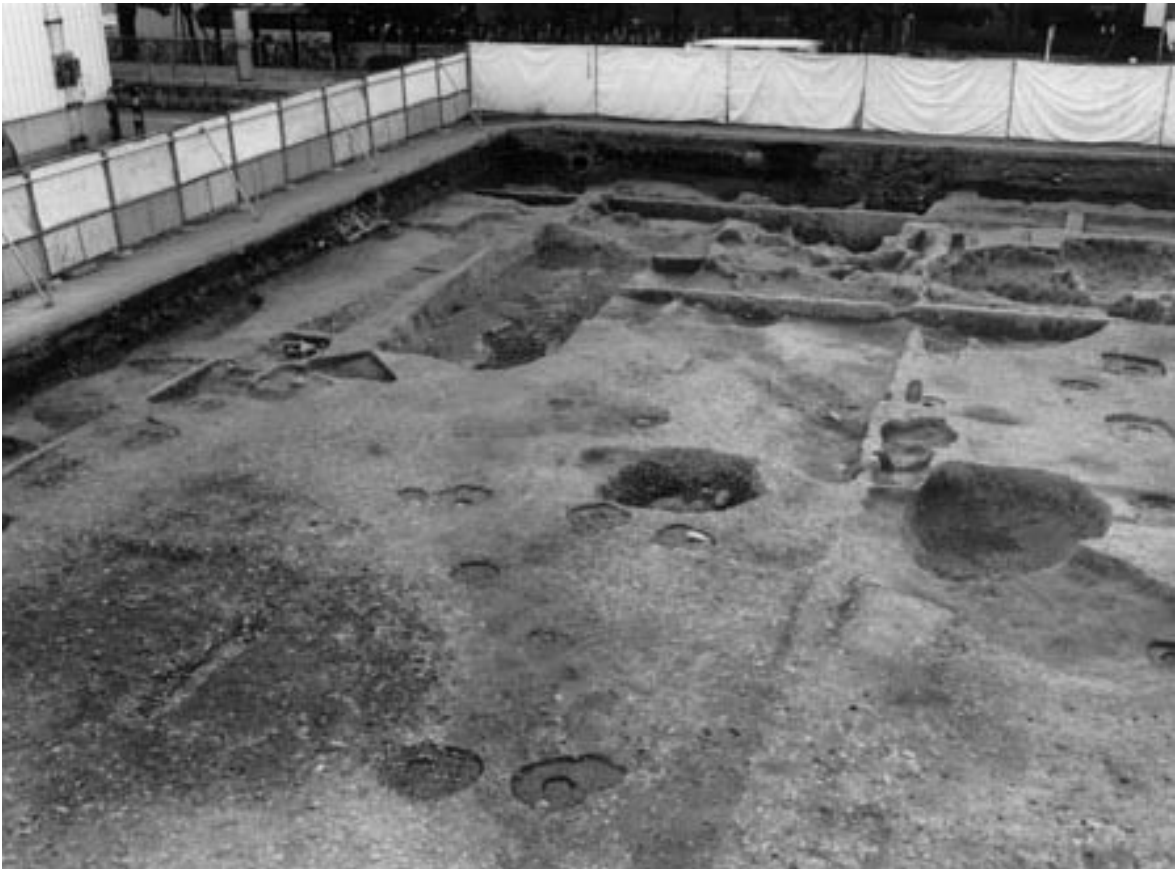
2 門1 (東から)