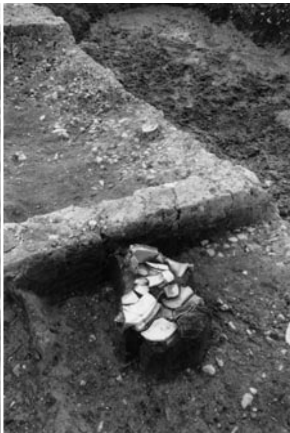
3 溝3瓦器出土状況（北西から）