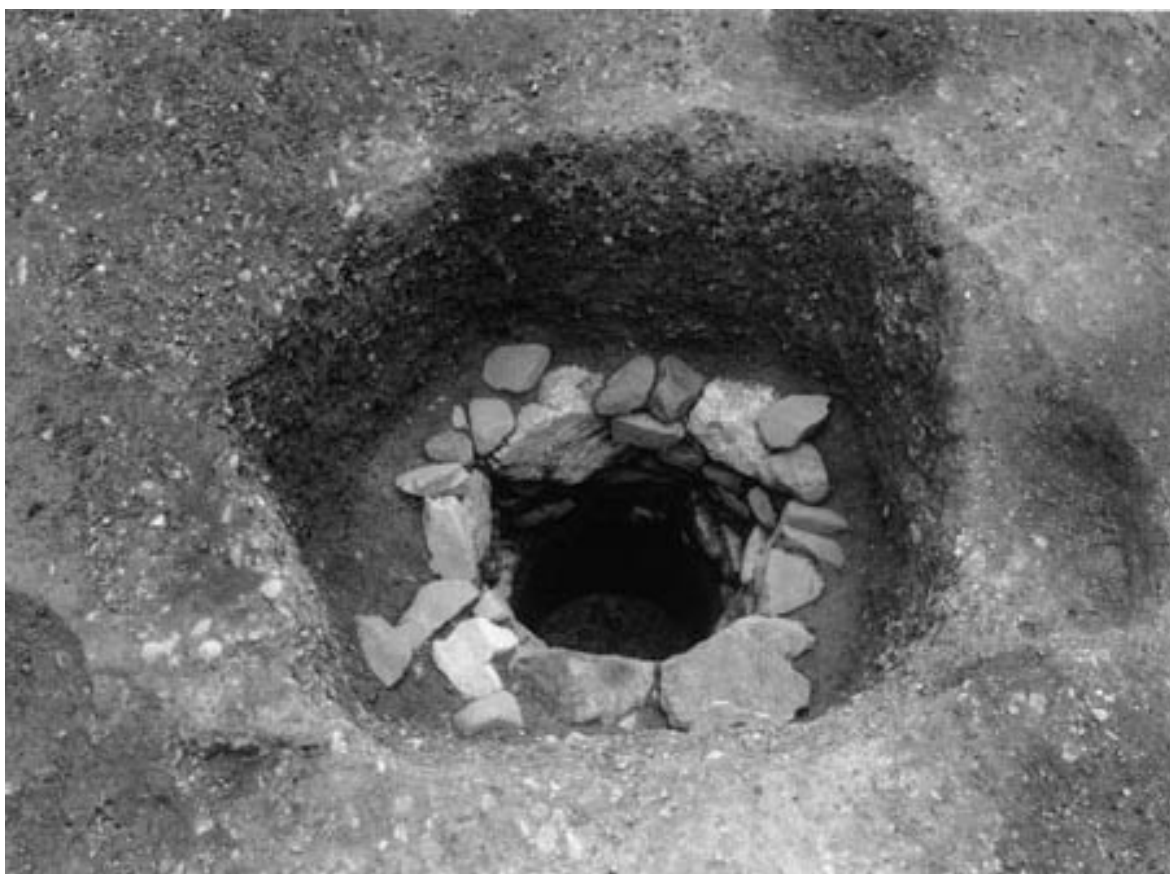
1 井戸 124 (西から)