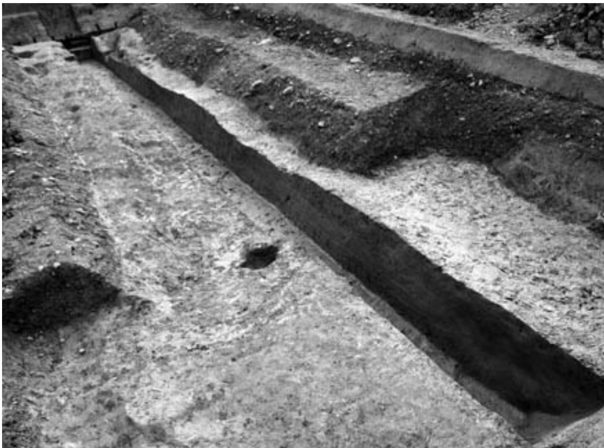
2 断割り状況（北東から）