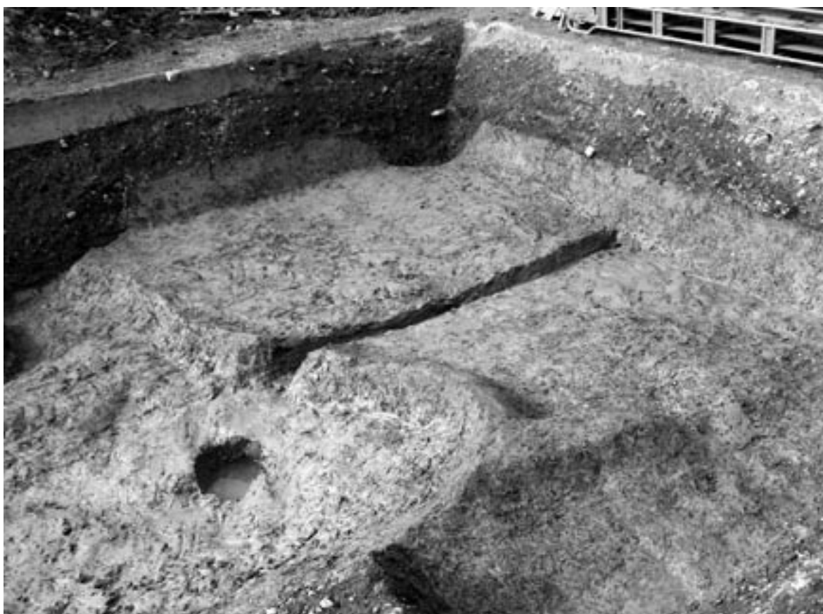
2 水田1検出状況（南東から）