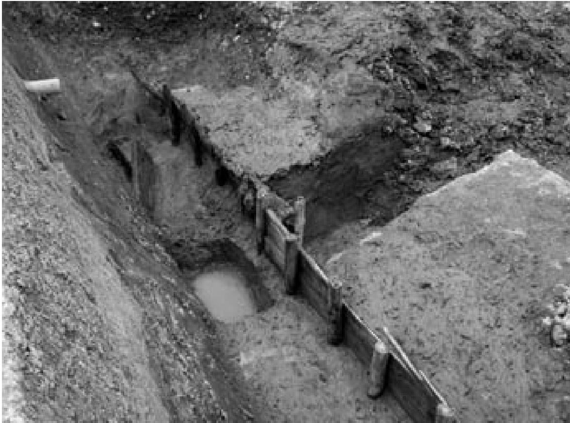
1 溝2土留め杭列検出状況（南東から）