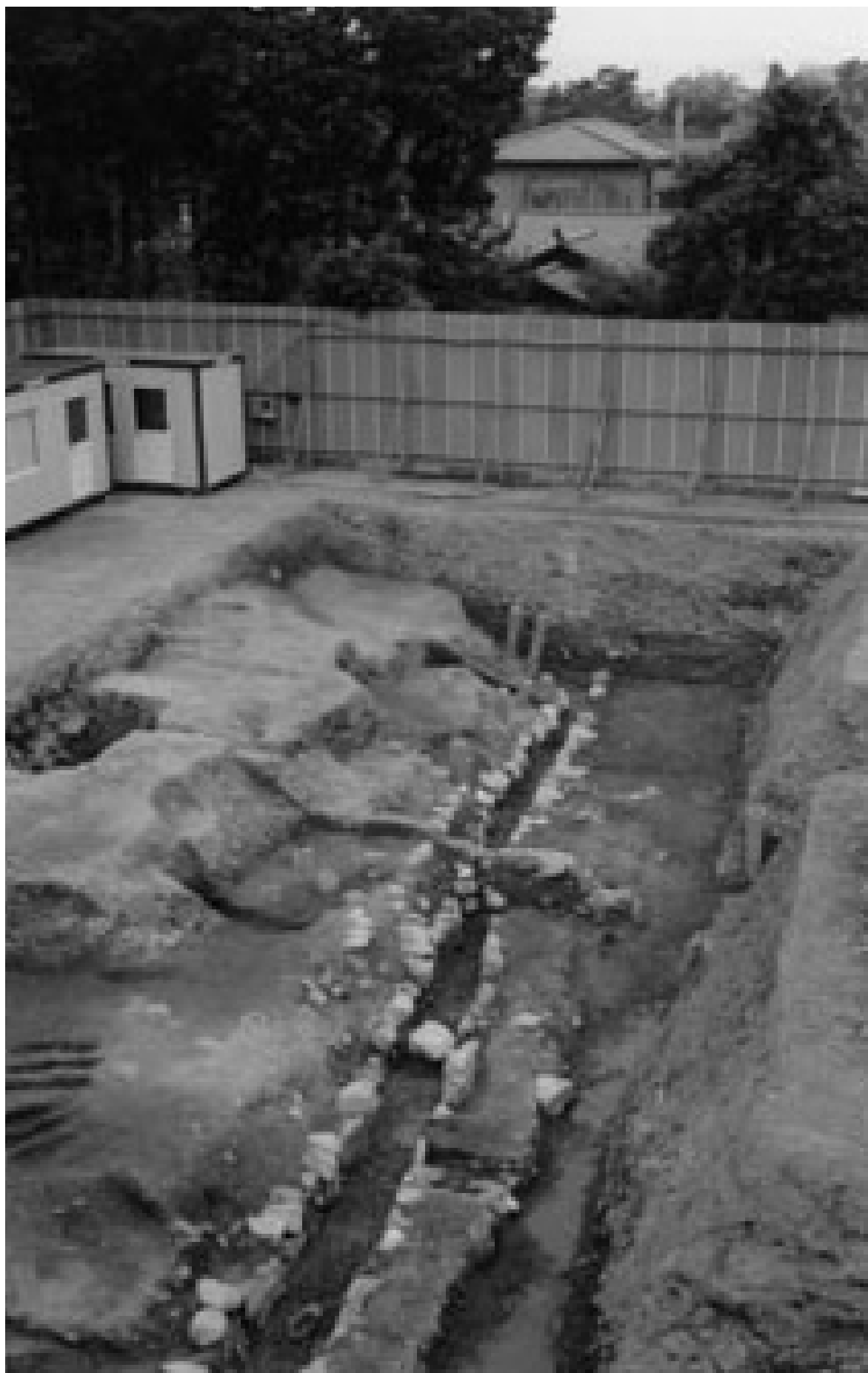
調査区全景（東から）