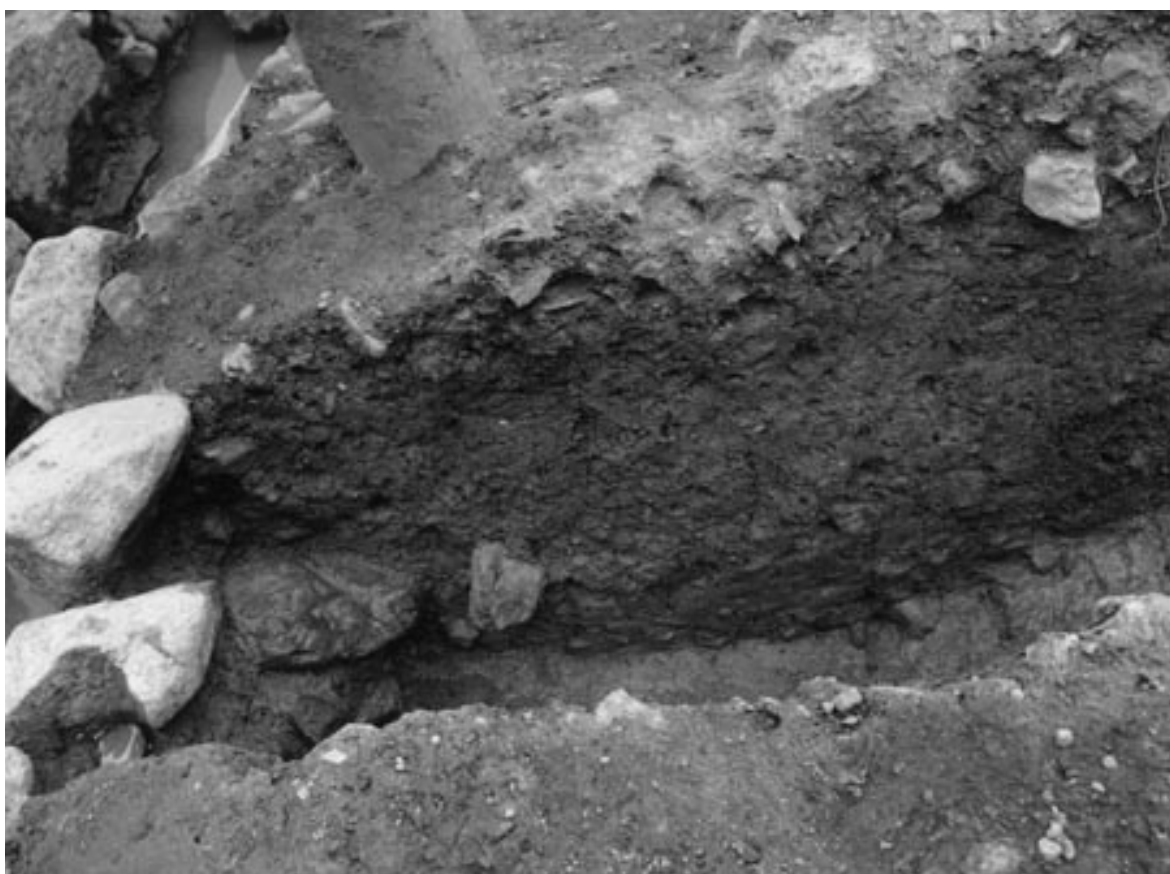
2 石組溝南側断割状況（西から）