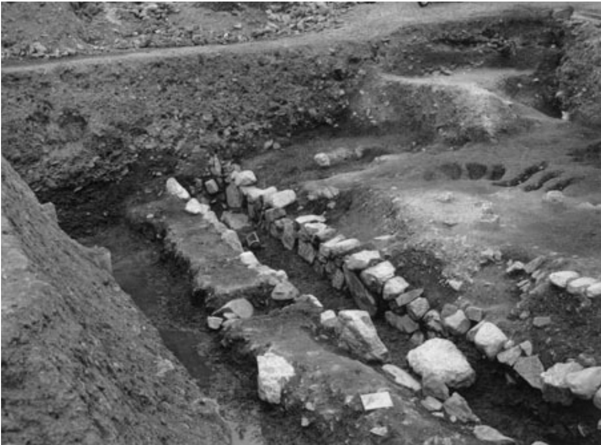
2 石組溝東部（北西から）