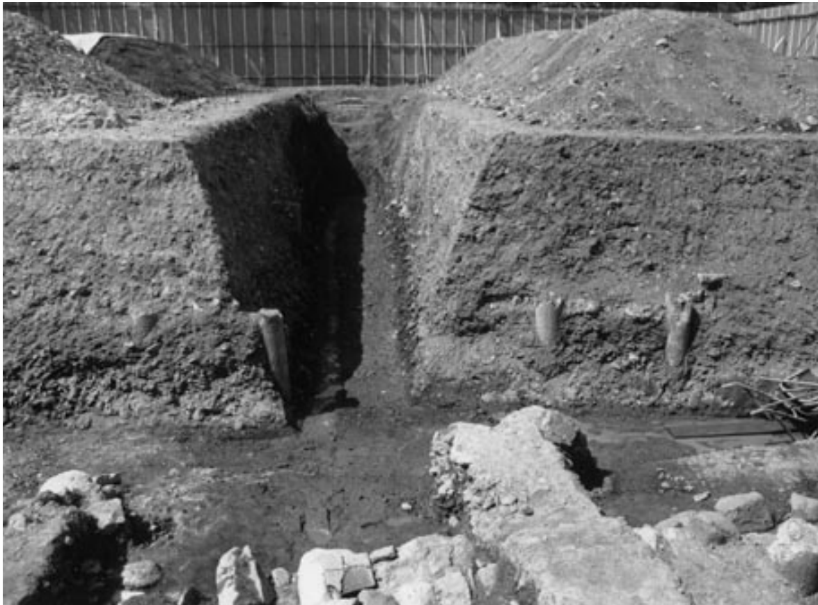
2 試掘2区完掘状況（南から）