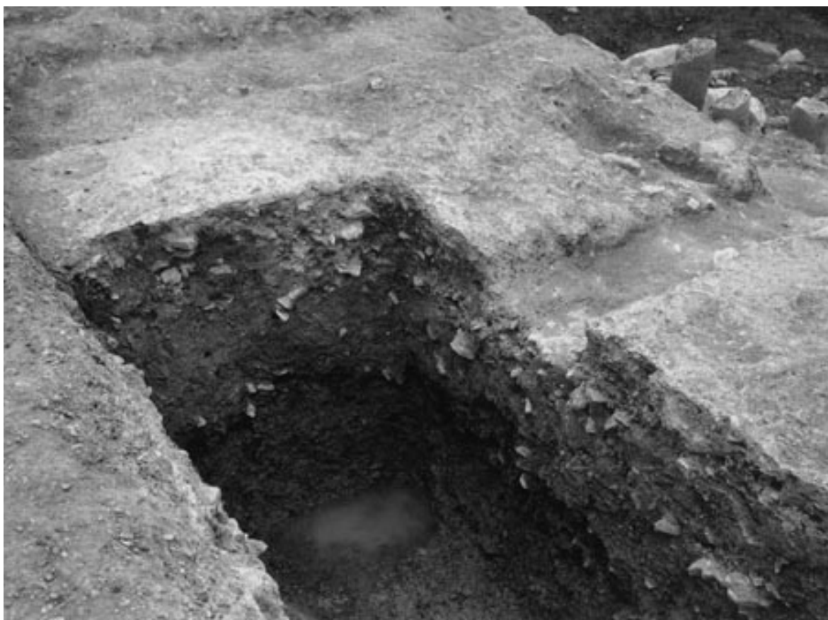
1 参道断面（攪乱西壁、南東から）