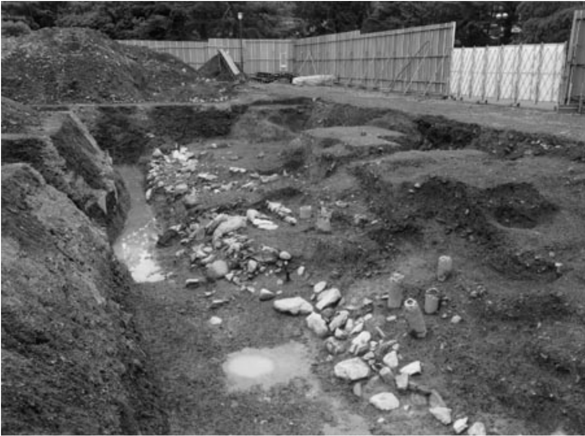
1 石組溝掘下げ前（西から）