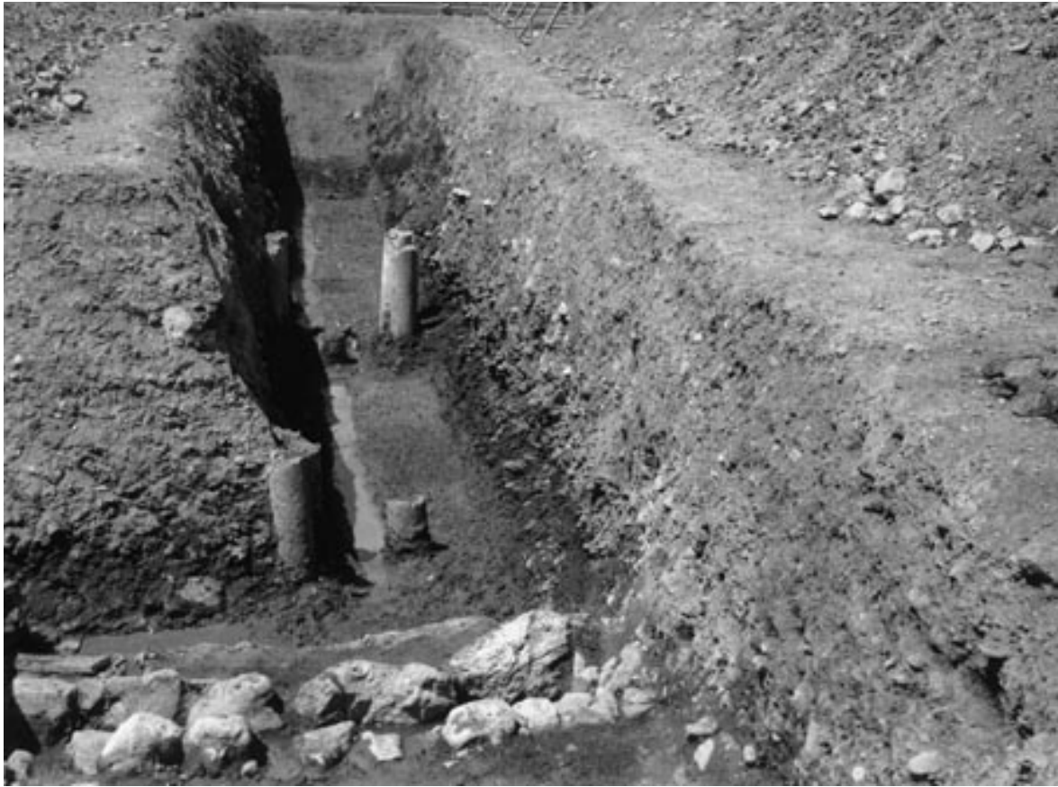
1 試掘1区完掘状況（南から）