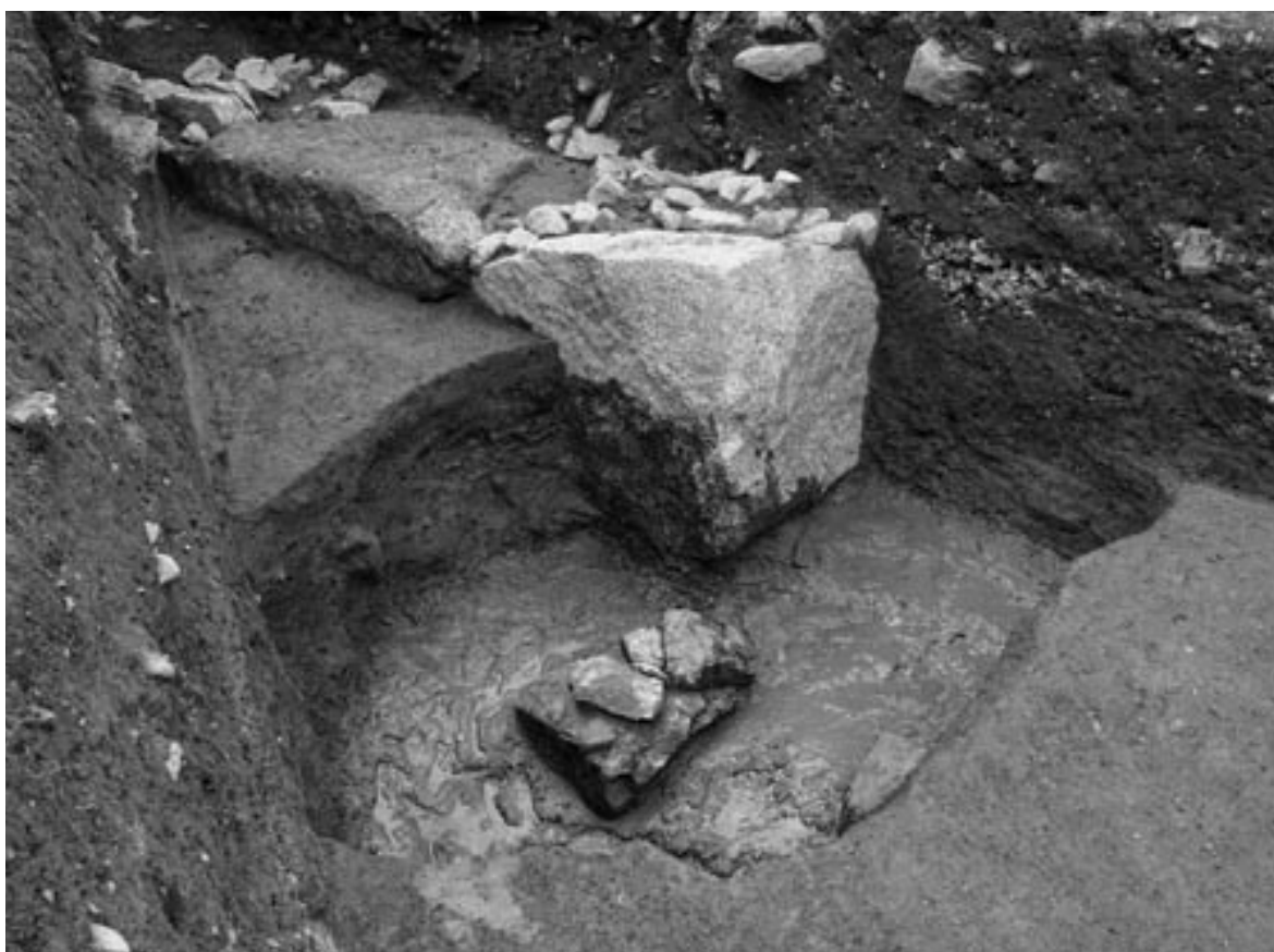
3 石垣1、土坑10（北東から）