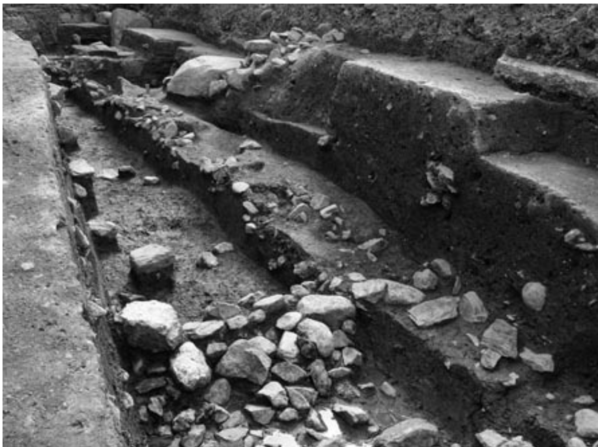
1 断割り西壁断面（北東から）