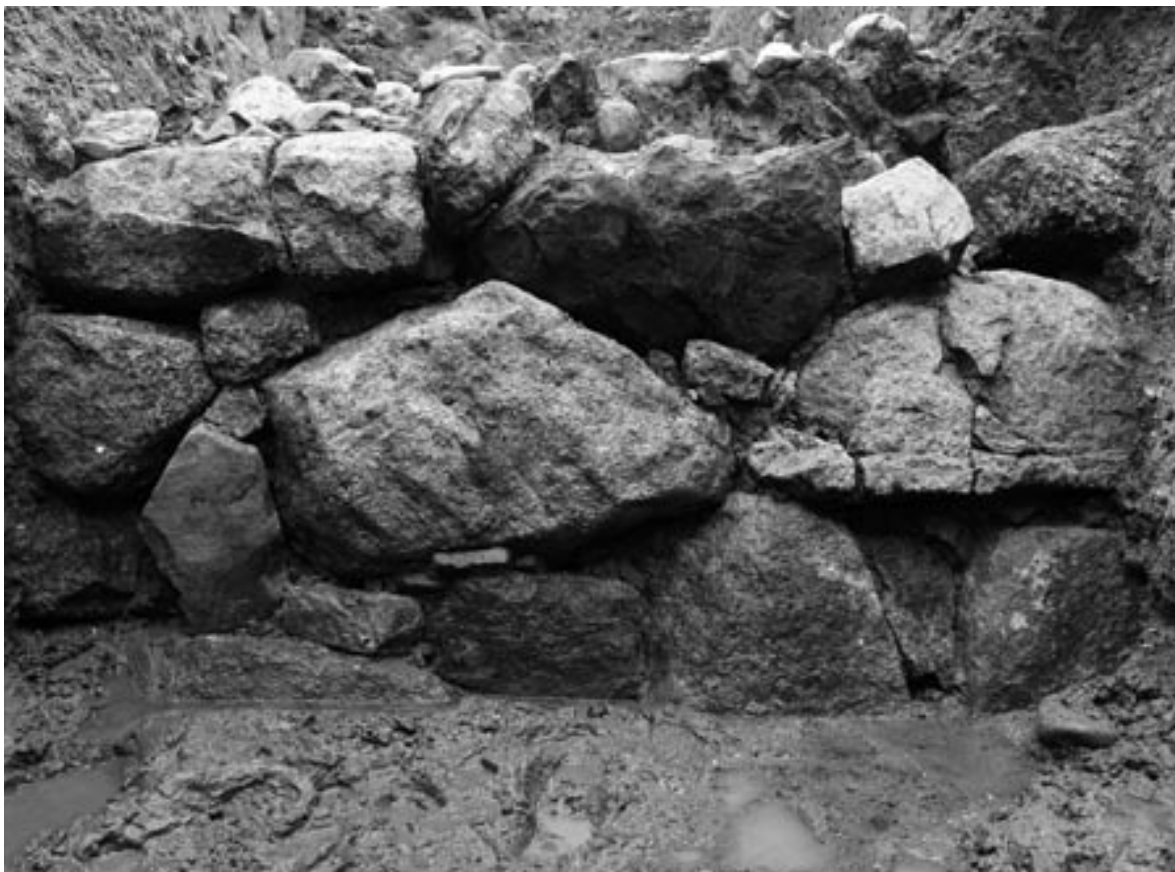
2 石垣16 (北から)