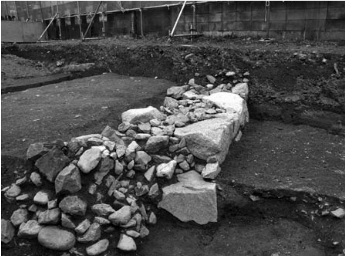
1 石垣2 (南西から)