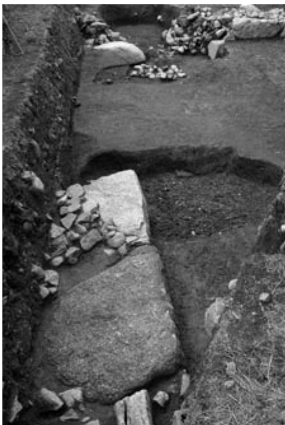
1 石垣1・2、土坑8～10（南から）