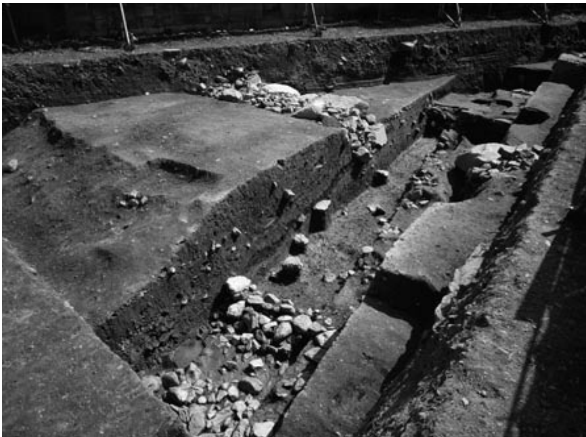
2 断割り東壁断面（北西から）