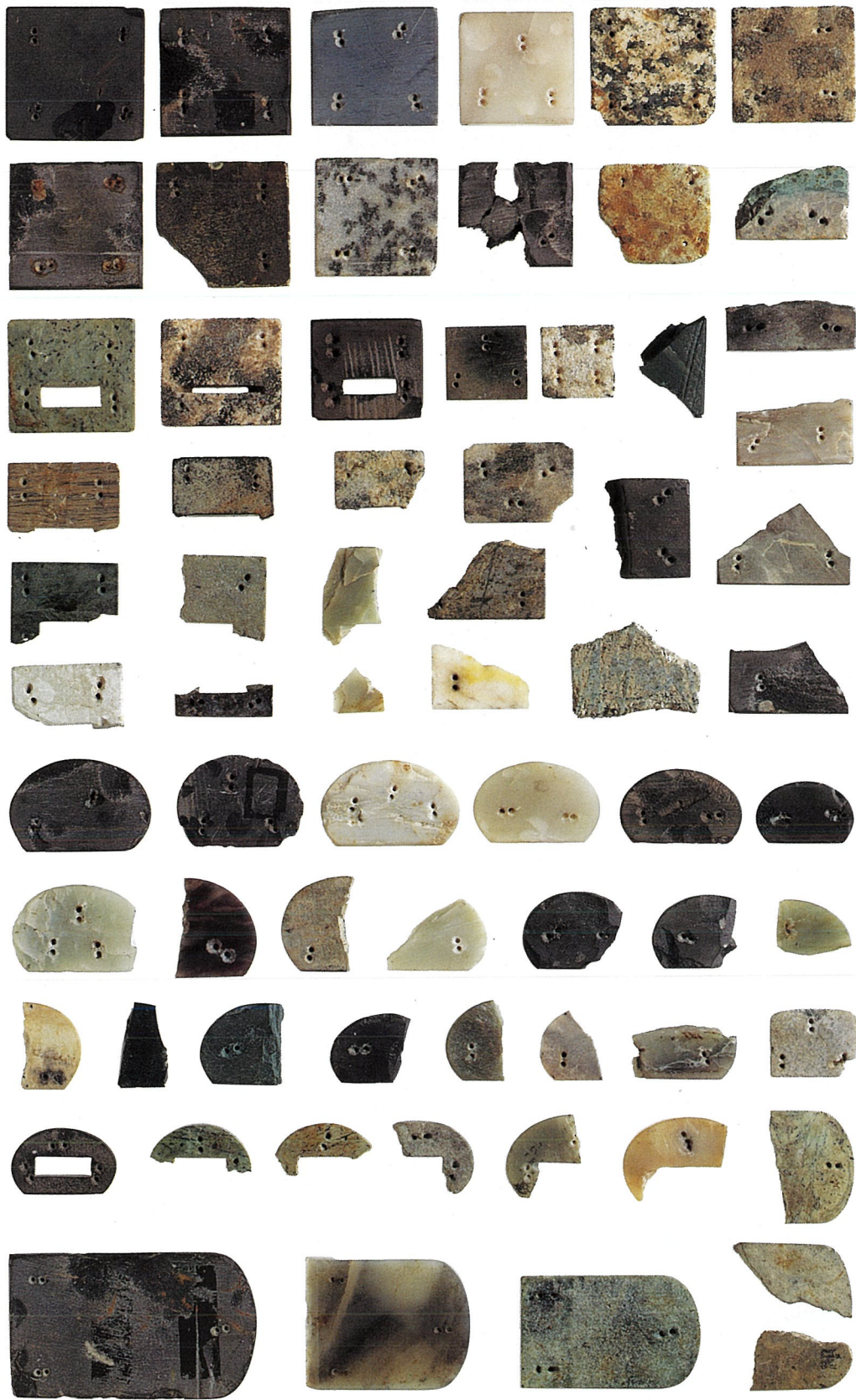
平安京の石製銚具 製品（裏面）