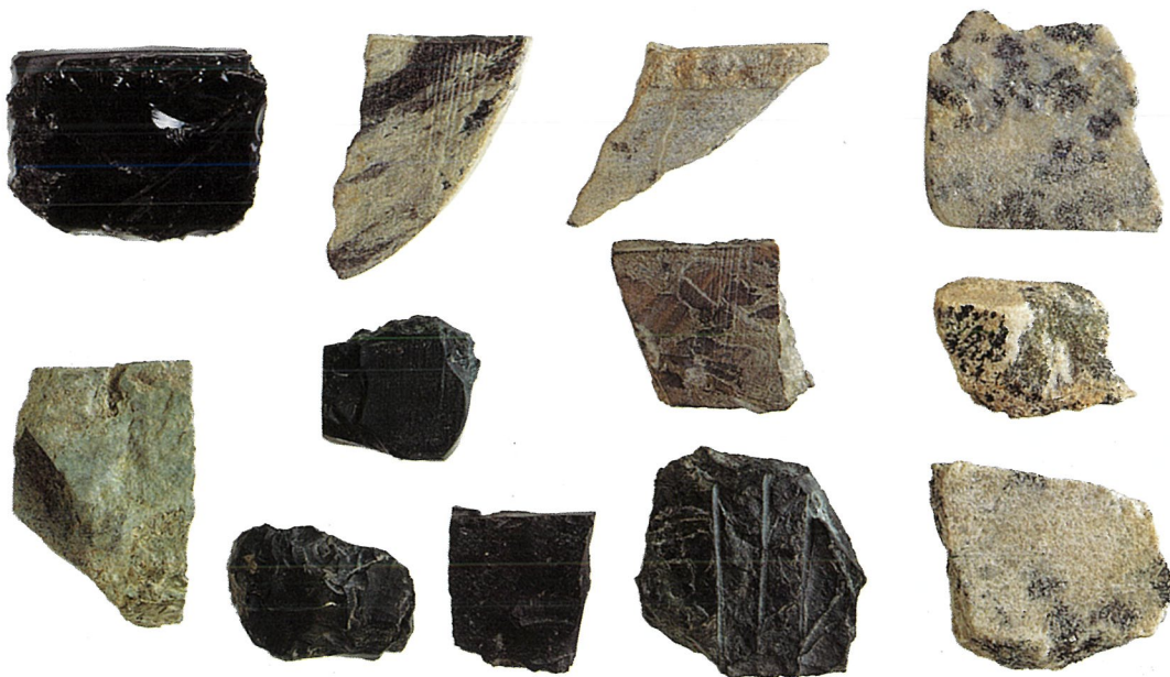
平安京の石製鋳具 未製品・石材（裏面）