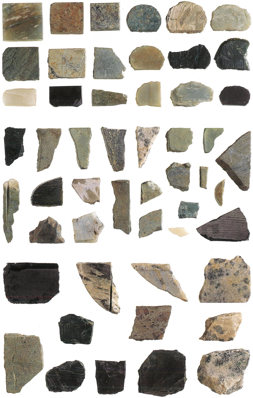
平安京の石製銚具 未製品・石材（表面）