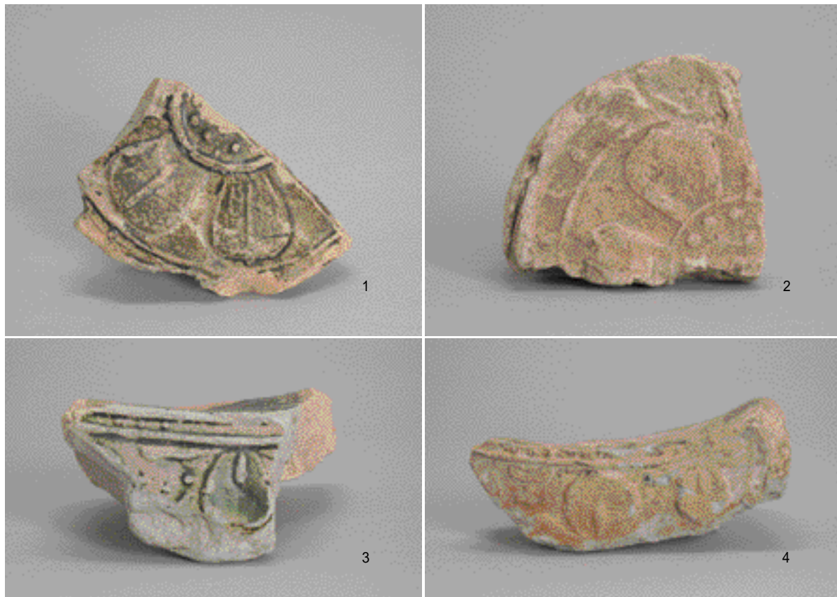
出土した緑釉軒瓦