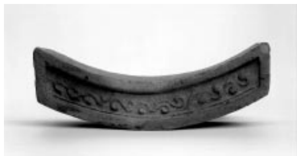
三重塔跡出土の軒平瓦