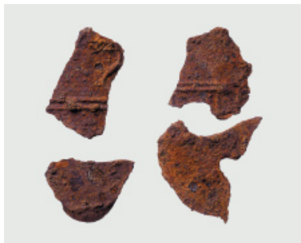
鑄鉄製の風鐸と風招の破片