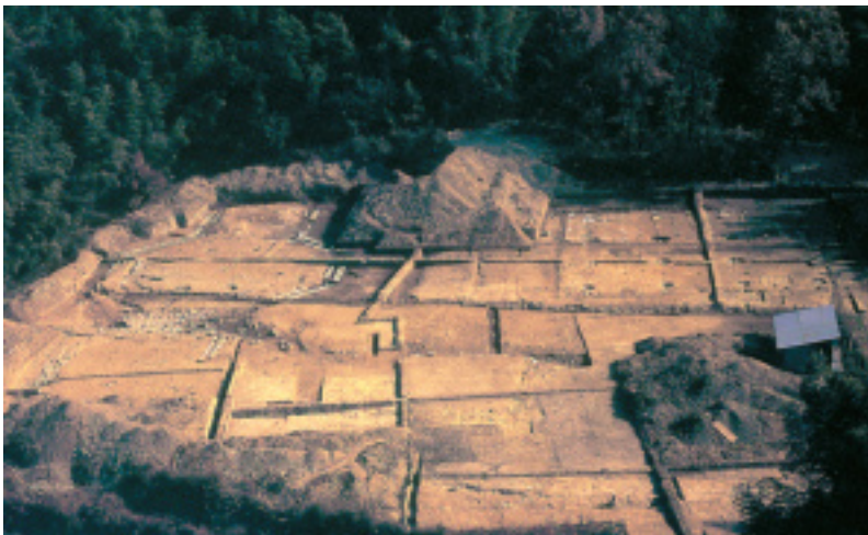
八角円堂跡と方形堂跡(西から) 1973年の調査

はじめに 2003年の冬、醍醐栢ノ杜遺跡で発掘調査が行なわれ、その所在が長く不明であった三重塔跡が確認されました。