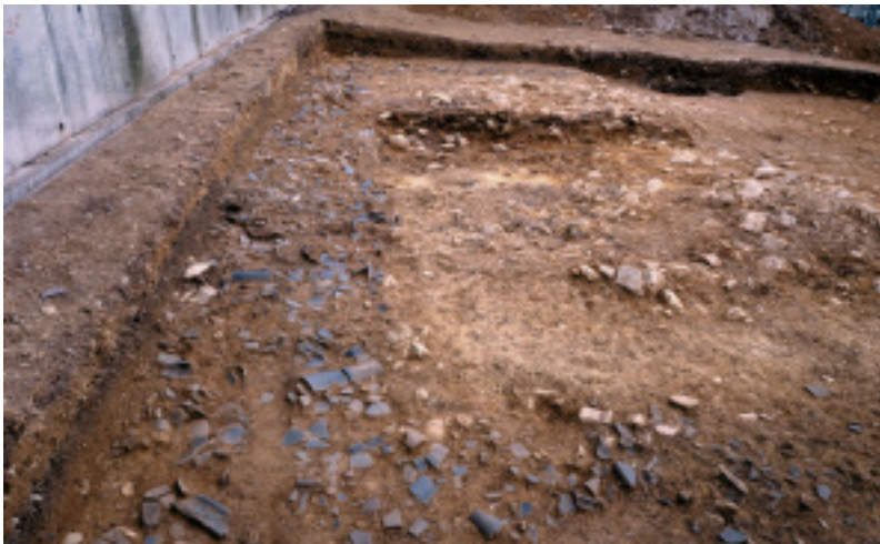
基壇の周囲に散乱する大量の瓦(北から) 今回の調査