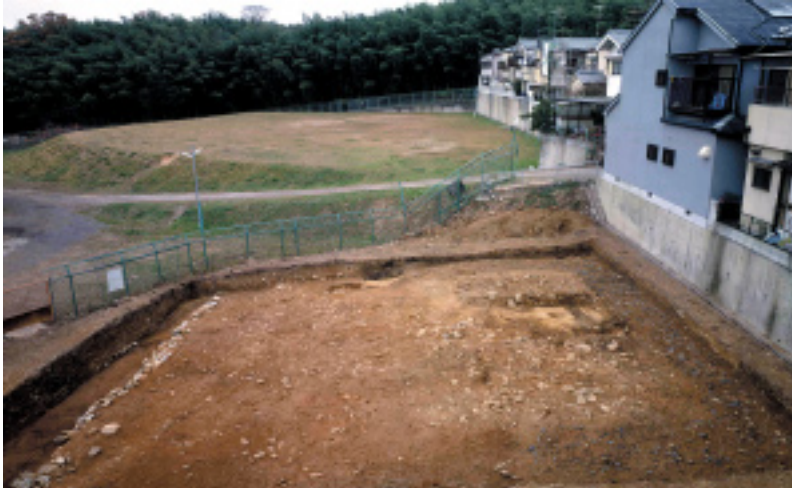
三重塔跡の基壇の高まり(南から) 今回の調査

http://www.kyoto-arc.or.jp (財)京都市埋蔵文化財研究所・京都市考古資料館