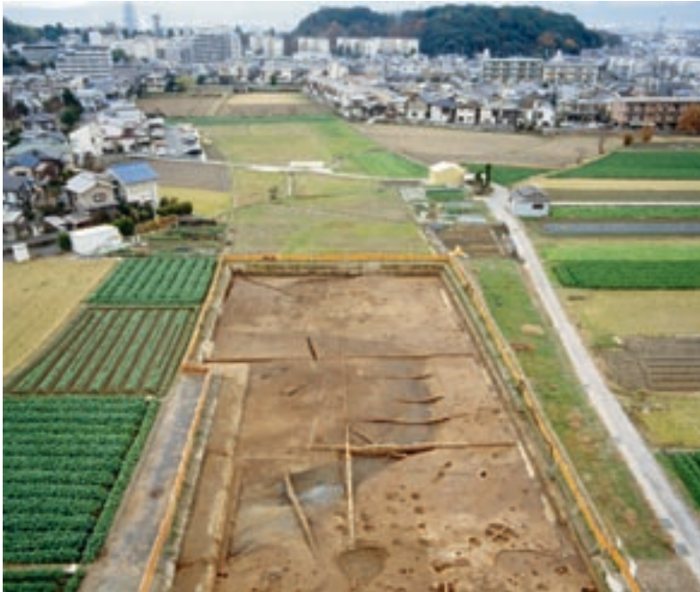
写真1 2007年度の調査(西から)