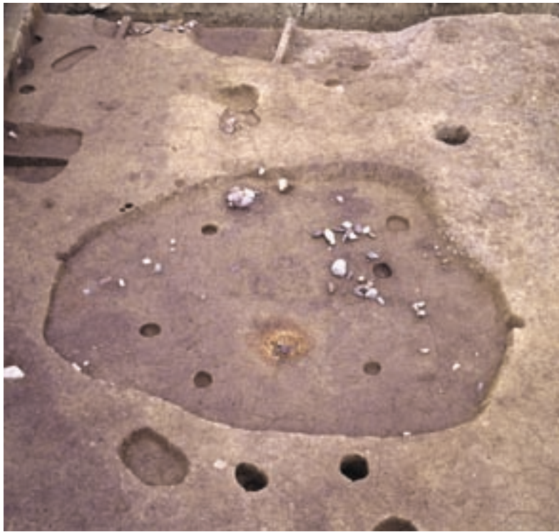
写真3 竪穴住居の跡