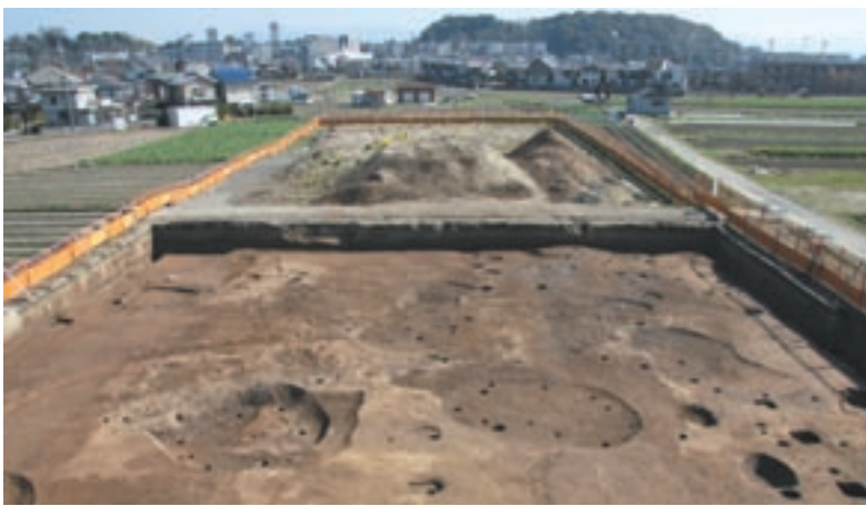
写真2 2006年度の調査(西から)

はじめに 京都市西京区大原野では、2001年より道路新設工事に先立って、発掘調査が行なわれてきました。この地域は、長岡京の北西部の右京二条にあたりますが、長岡京が造られる以前の上里遺跡 かみざと の存在も知られており、縄文時代から古墳時代の集落跡もあったこ