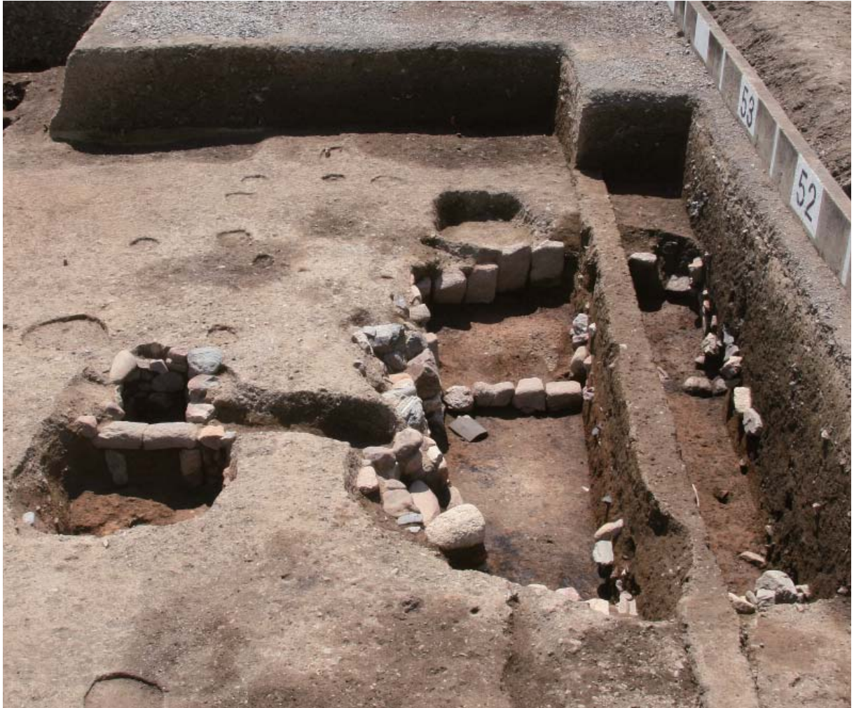
調査で見つかった石風呂の遺構（北から）

はじめに 2012年夏、浄土真宗中興の祖・蓮如上人が創建した山科本願寺跡の発掘調査で、石風呂の遺構が見つかりました。見つかった場所は、阿弥陀堂や御影堂といった主要堂舎があった「御本寺」と呼ばれる山科本願寺の中核部です。この石風呂は半地下式構造で、大きさは東西約4.4m、南北約6.0mあります。内部は石列で仕切られ、北側の作業場を兼ねた前室と南側の蒸し風呂部に分かれています。