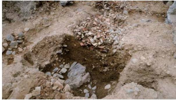
天龍寺旧境内の堀

応仁・文明の乱では、堀川上立売交差点南西側にあった山名宗全邸が西軍の本拠地となり、後にこの地域は西陣と呼ばれるようになった。京都市考古資料館には西陣の由緒を記した石碑がある。