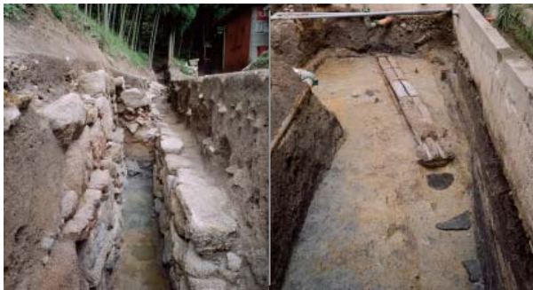
銀閣寺の溝の石垣と石樋

酒を醸造した甕を据付ける半球形のくぼみが東西約15 m・南北約16 mの範囲に並ぶ。当時の酒造りは甕の中に米・麴と水を入れて自然発酵させており、常滑産や備前産の製品が用いられた。