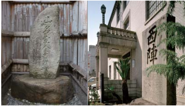
山名宗全邸跡と西陣の石碑

応仁・文明の乱では、堀川上立売交差点南西側にあった山名宗全邸が西軍の本拠地となり、後にこの地域は西陣と呼ばれるようになった。京都市考古資料館には西陣の由緒を記した石碑がある。