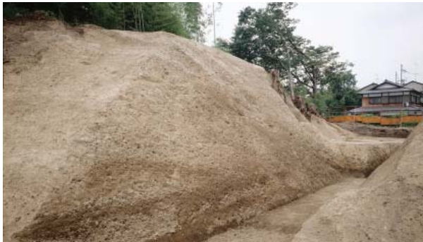
山科本願寺土塁断面

天龍寺旧境内の調査では、堀の中から応仁・文明の乱で焼失した建物の瓦が出土した。瓦は火災の高温により焼けただけで変形し、赤く変色している。火災の激しさが伝わる出土遺物である。