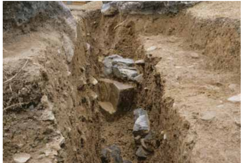
写真1 金剛輪院時代の旧池護岸石（南から）

壊された庭 義演が編纂した醍醐寺の寺誌『醍醐寺新要録』巻第十二の金剛輪院篇「庭事」には、以下の一文が記されています。