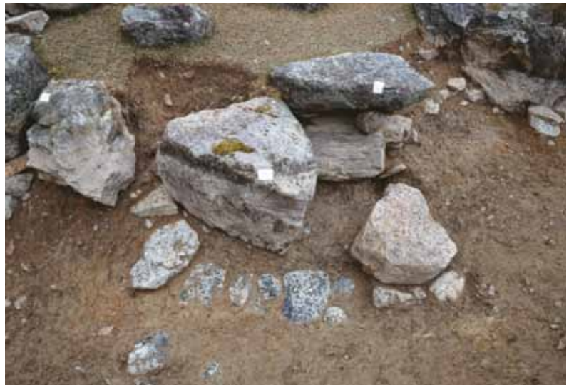
写真2 現在の護岸石と金剛輪院時代の井戸跡（南から）

「去天正三年六月□日干時予十八歳下山、當院再興、小堂一字先建立。其時崩築山埋泉水。是或人之異見也。後悔千萬。」