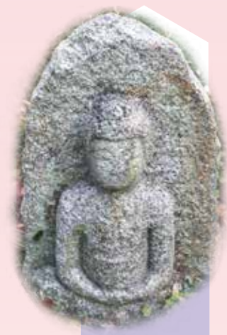
旧二条城跡出土石仏