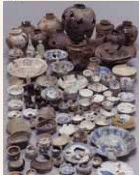
穴蔵から出土した陶磁器類