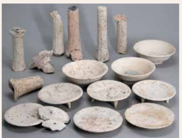
出土した白色土器（平安時代中期）