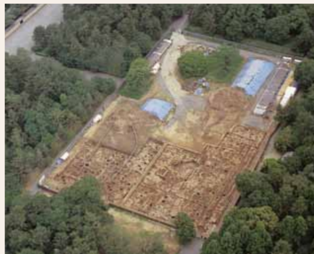
上空から見た北側の調査区（上が北）

1997年～2002年にかけて京都御苑内で、京都迎賓館建設に伴う発掘調査が行われました。この調査は平安京跡では、これまでに例をみない大規模な調査面積（約15,000㎡）でした。調査では古墳時代から江戸時代の建物跡、溝、井戸、池跡、道路跡、流路跡などが多数見つかりました。特に平安時代のものは建物や井戸、道路や溝などが見つかり、平安京北東部の様子が明らかになりました。また平安時代の遺物には、儀式様土器といわれている白色土器が土御門第跡地の近くの穴から多量に見つかりました。