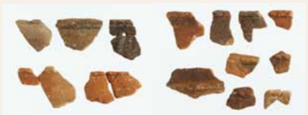
出土した縄文土器（縄文時代後期）