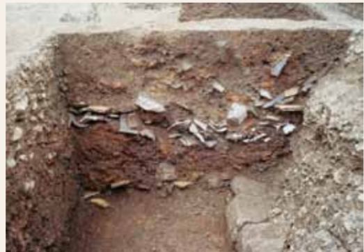
穴蔵の埋土の様子