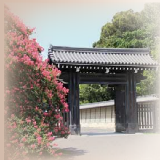
発行 京都市・(財)京都市埋蔵文化財研究所