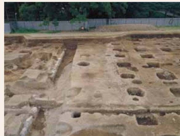
溝や建物跡（平安時代）