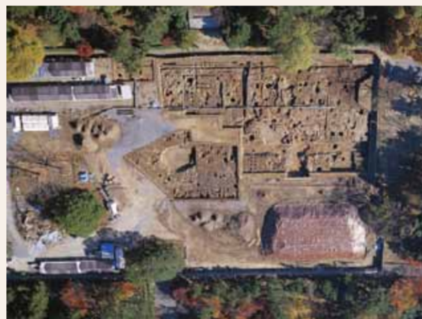
上空から見た南側の調査区（左が北）