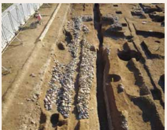
建物地葉跡（平安時代）