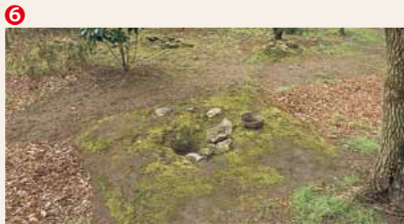
京都大学理学部植物園内に移築復元された墓地