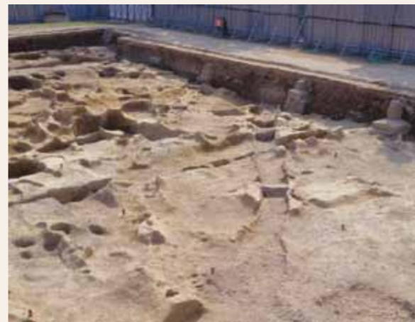
流路跡（平安時代以前）