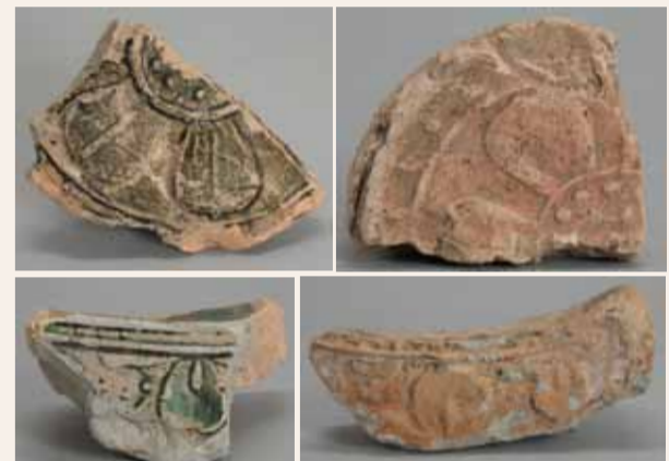
法成寺跡から出土した緑釉軒瓦（上列は軒丸瓦 下列は軒平瓦）