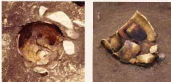
土器棺墓（縄文時代後期） 土器棺墓（弥生時代）