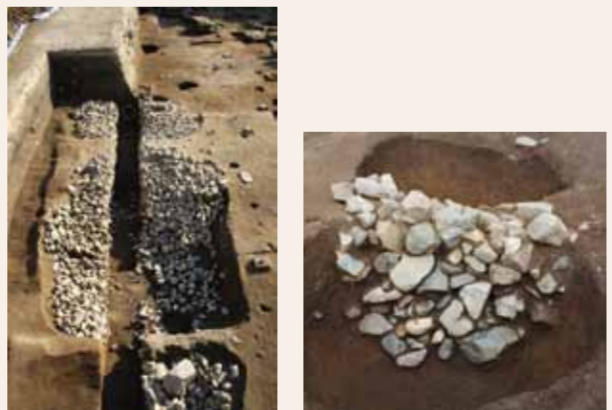
敷地境界とみられる施設 石が詰まった穴