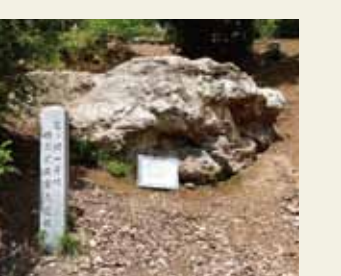
双ヶ岡古墳1号墳(一ノ丘)