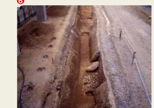
JR山陰線北側の発掘調査の様子