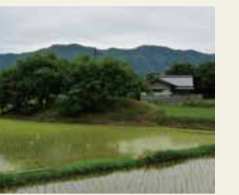
嵯峨七ツ塚古墳2・3号墳(私有地)