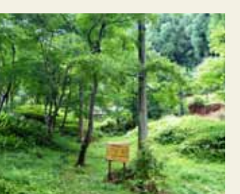
山越古墳13・14・15号墳(平安郷内)