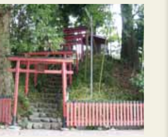
稲荷古墳(富岡稲荷)