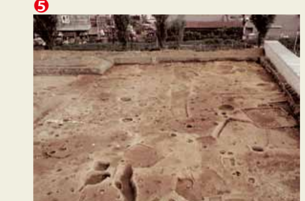
1977年の調査風景 写真上に当時の山陰線線路が見える

常盤仲之町遺跡は1977年に、JR山陰線を挟んだ東映太秦映画村の北側で、建物新築工事に伴う発掘調査で見つかった古墳時代から中世の遺跡です。とくに飛鳥時代(7世紀前半)の竪穴住居跡が多数見つかると集落跡の存在が明らかになりました。また、2006年から2008年にJR山陰線の高架工事に伴う発掘調査が行われ、弥生時代から飛鳥時代の竪穴住居跡をはじめ、平安時代の溝、鎌倉時代の池跡や室町時代の墓跡なども発見されました。南側には広隆寺が現存していますが、平安時代の文献によれば、広隆寺の寺域は今よりもはるかに广大で、常盤仲之町遺跡とも重複しています。広隆寺旧境内の調査では寺域の東側を限る築地の基底部や建物基壇などが発見されています。また、平安時代以降の遺構も多く見つかっています。2010年に東映太秦映画村前でを行った道路拡幅に伴う発掘調査で、平安時代中期から後期の建物跡や井戸、溝などが見つかっています。建物跡近くからは、地鎮を行ったとみられる完形の土器を埋めた穴や、経文が刻まれた瓦経の破片、小型の銅鏡も発見され注目されます。