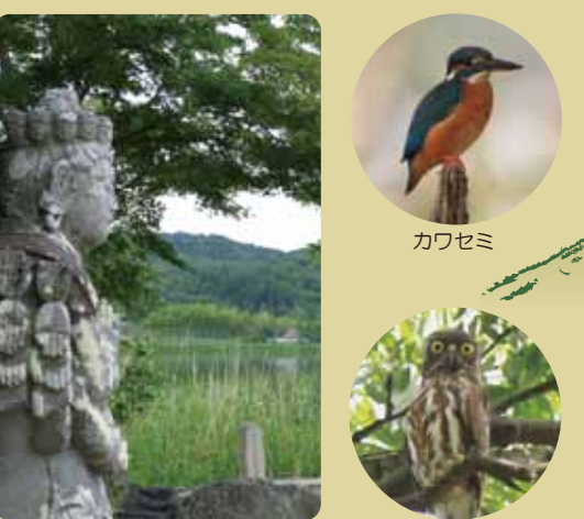
広沢池弁天島十一面千手観音石像