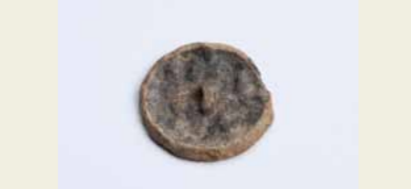
出土した海獣葡萄鏡(奈良時代から平安時代初頭)