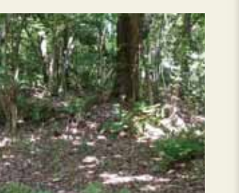
双ヶ岡群集墳7号墳(三ノ丘鞍部)