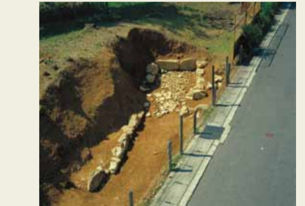
4号墳の横穴式石室と墳丘