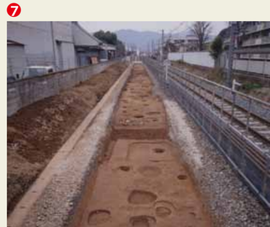
JR山陰線南側での発掘調査の様子