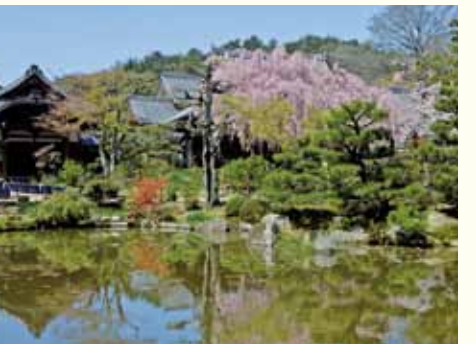
庭園とその背後にある五位山

待賢門院(藤原璋子)は、平安時代の右大臣・清原夏野の山荘跡につくられた天安寺を、1130年に法金剛院として再興しました。極楽浄土をあらわす美しい浄土式庭園は、桜・花菖蒲や90種類以上の蓮の花があり「関西花の寺25」に選ばれています。境内の五位山と青女滝(せいじょのたき)は国特別名勝に指定されています。