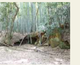
朝原山古墳7号墳(私有地)