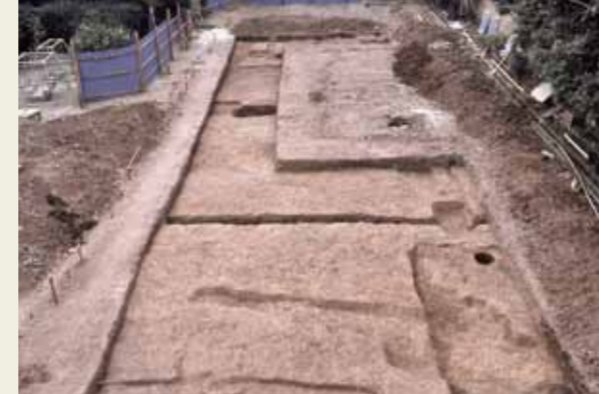
土御門大路北側溝跡