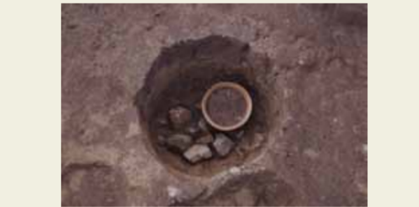
土器が埋納された穴(平安時代)