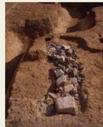
石材や石が詰まった穴(江戸時代)