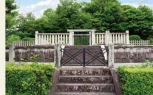
村上天皇村上陵(むらかみてんのむらかみのみささぎ)