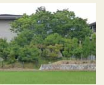
入道塚古墳(宮内庁)