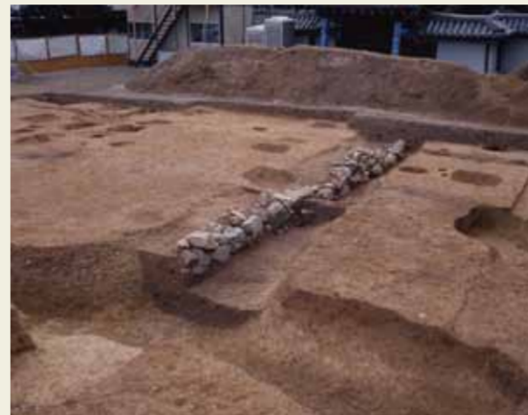
石で護岸された溝(江戸時代)