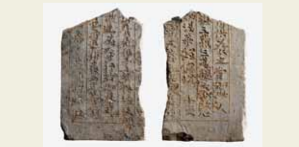
表裏に法華經の経文が刻まれていた瓦経