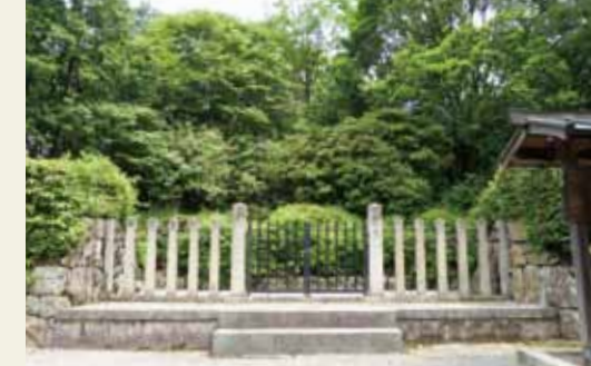
円融天皇火葬塚(えんゆうてんのうかそうづか)