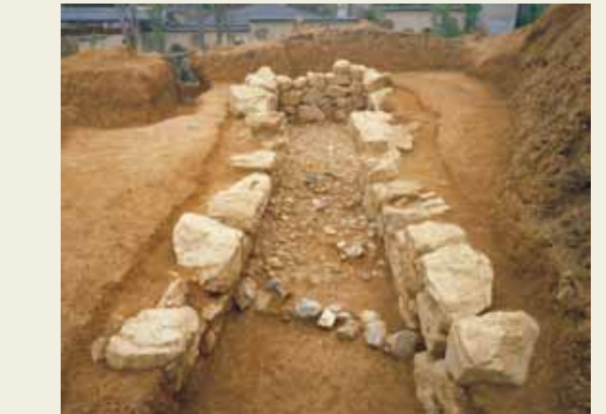
1号墳の横穴式石室

鳴滝地区の音戸山から延びる丘陵の端部に、直径約10mの円墳14基と一辺9m～13mの方墳3基合わせて17基からなる古墳群です。1983年の宅地造成に伴い4基(1・3～5号)の古墳の発掘調査が実施され、埋葬施設はいずれも横穴式石室で、石室内から副葬品の土器類と家形石破の破片も発見されました。