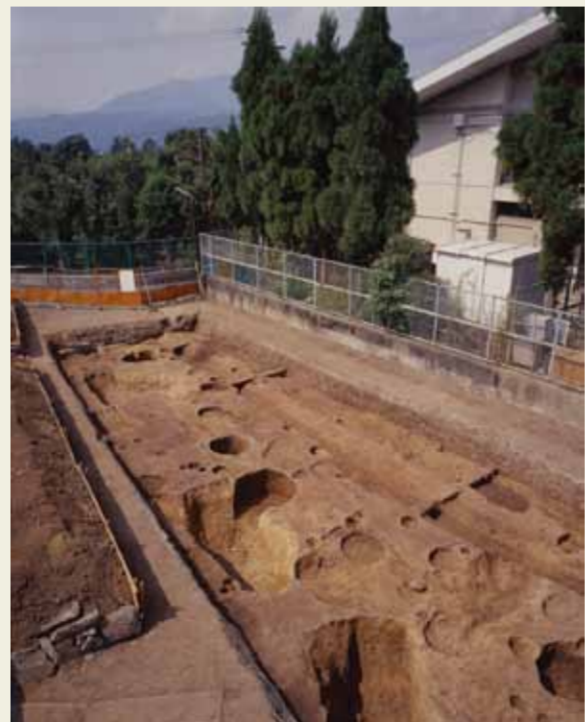
溝跡や柵跡(鎌倉時代から室町時代)

1990年に常盤草木町一帯の立会調査で平安時代前期の溝や土器を含む土層の広がりが発見され、集落跡とされました。2001年に常盤野小学校の体育館・プール新築工事に伴う発掘調査が行われ、鎌倉時代から室町時代の建物、柵列、溝などが見つかり、集落の一面であることがわかりました。