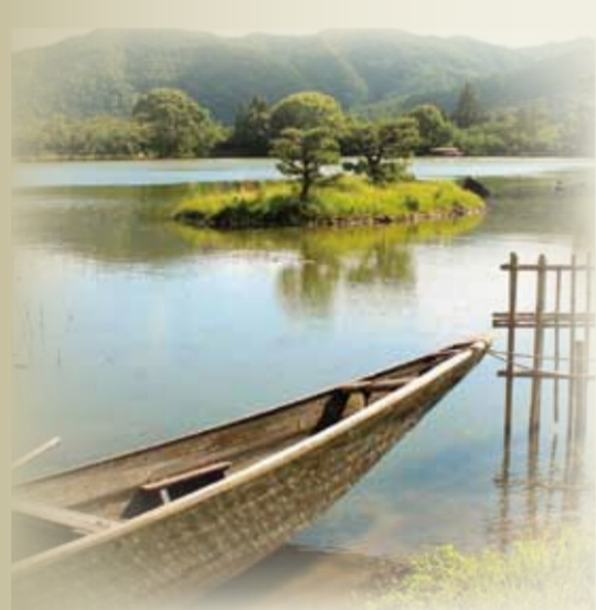
発行 京都市・(財)京都市埋蔵文化財研究所