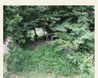
広沢古墳3号墳(広沢公園)