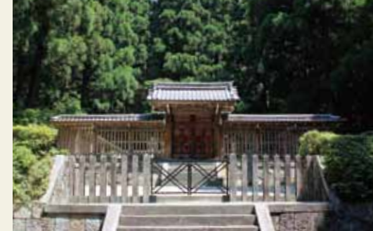
後宇多天皇蓮華寺陵(こうだてんのうれんげぶじのみささぎ)