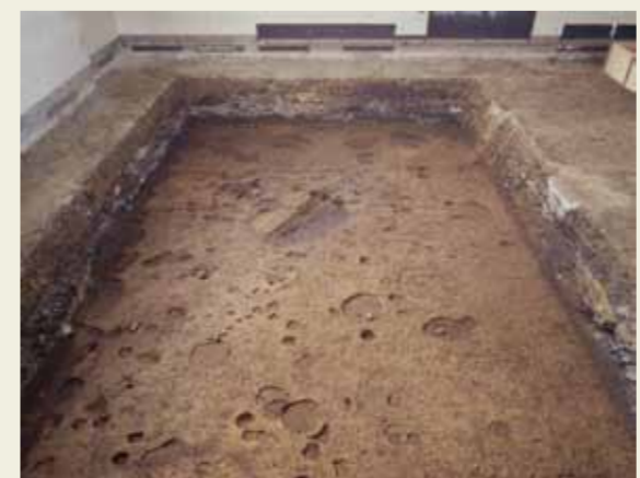
建物跡(鎌倉時代から室町時代)