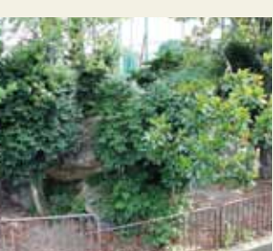
移築広沢古墳2号墳(堀川高校グラウンド)