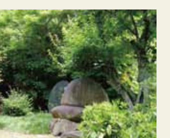
印空寺古墳(印空寺境内)