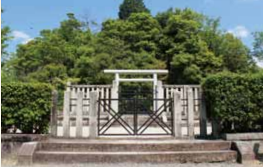
嵯峨天皇嵯峨山上陵(さがのうさぎやまのえのみささぎ)