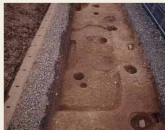
古墳時代の竪穴住居跡