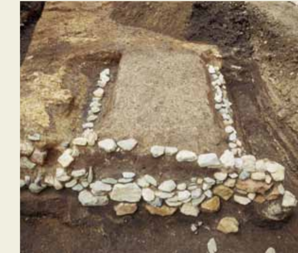
JR山陰線の南側で発見された東御門とみられる門跡