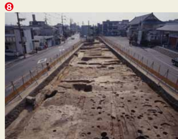
発掘調査の様子 右に東映太秦映画村の入口が見える