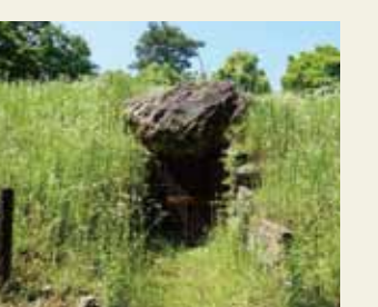
移築御堂ヶ池1号墳(菅戸山上市登録史跡)