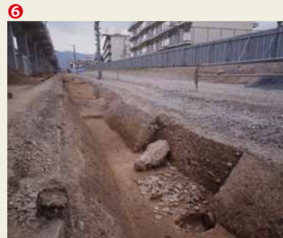
鎌倉時代の池跡(景石と小石を敷いた洲浜)