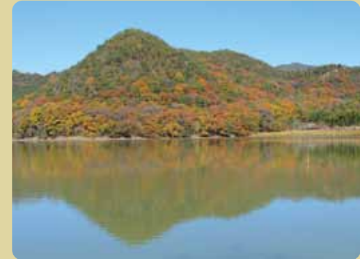
広沢池と遍照寺山(嵯峨富士)