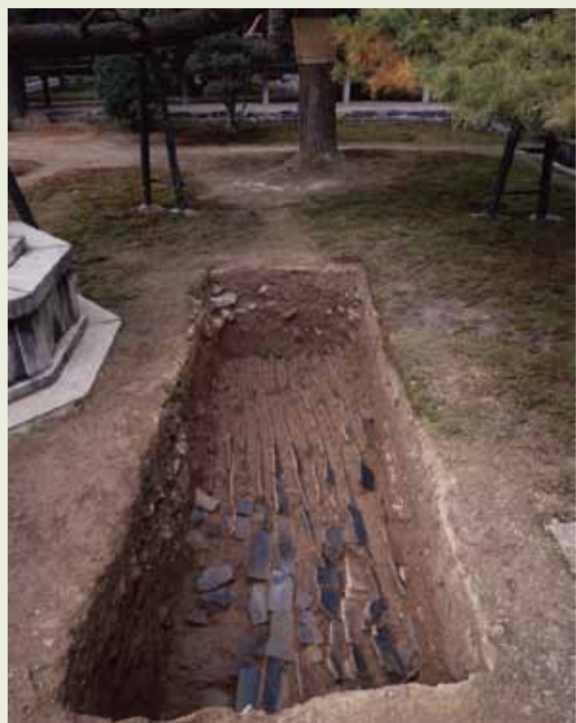
▲ 御所内発掘調査全景