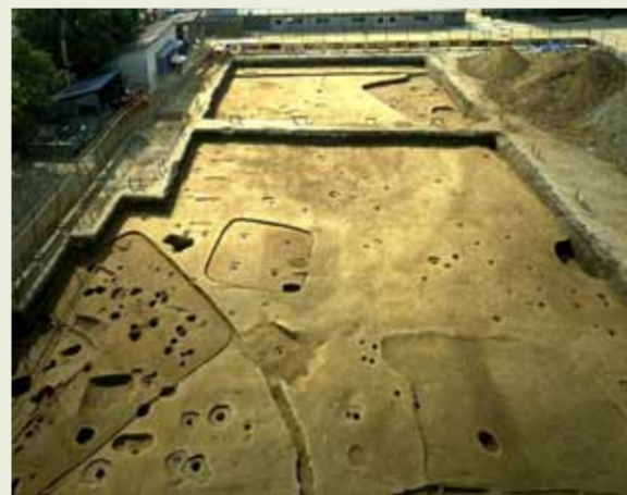
▲ 竪穴住居検出状況

古墳時代を中心とする集落遺跡。嵯峨野小学校内の調査では竪穴住居等が発見されました。その後、古墳時代前期、飛鳥時代～奈良時代、平安時代～中世等各時代の遺跡が重複する複合遺跡であることが判明しました。また、飛鳥時代～奈良時代の瓦も多数出土していることから、付近に寺院があった可能性もあります。