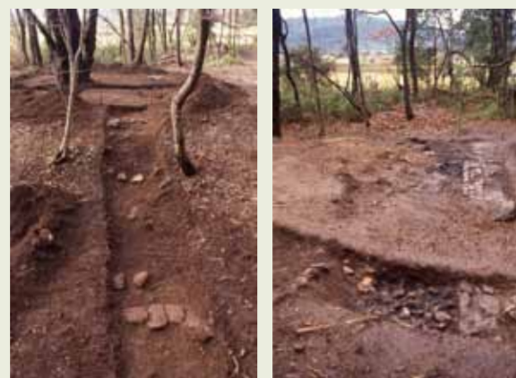
▲ 発掘調査全景 ▲