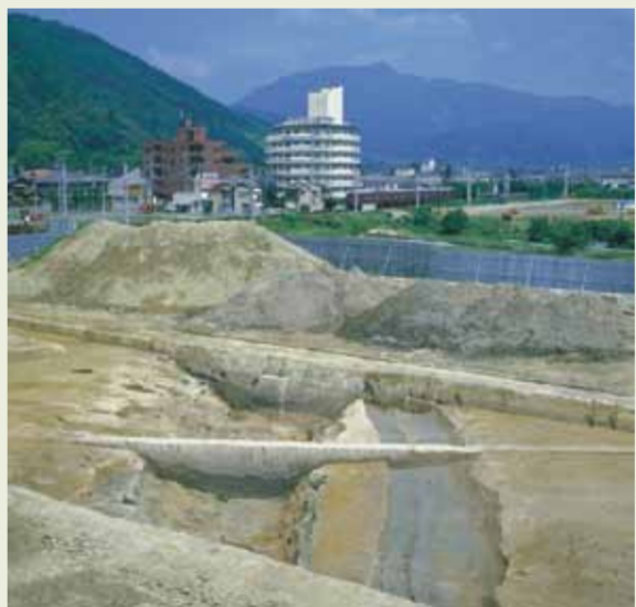
▲ 大溝・・・葛野大堰の分流か？

松尾大社の南東約500mの、松尾中学校建設時に発掘調査が行われ、弥生時代～飛鳥時代の竪穴住居が多数検出されました。また、「葛野大堰」の分流と考えられる大溝も発見されました。