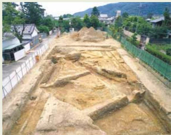
▲ 発掘調査全景(平安時代)