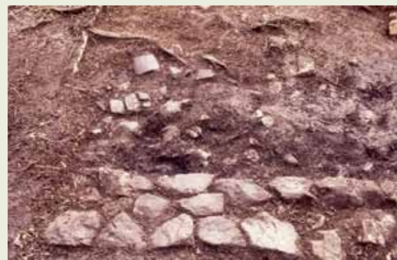
▲ 建物基壇検出状況