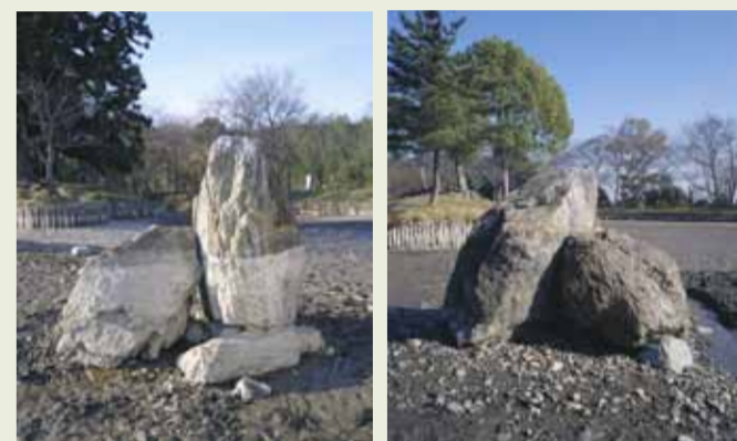
▲ 大沢池立石の状況