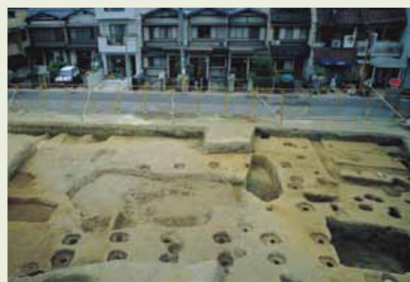
▲ 掘立柱建物検出状況