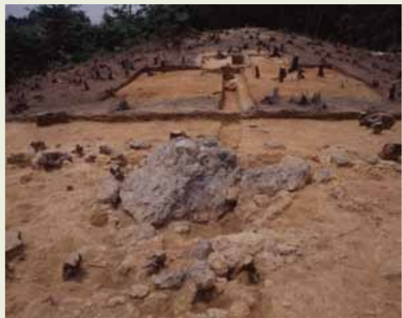
▲ 梅ヶ畑祭祀遺跡全景

平成9年、丘陵頂部から尾根筋にかけての平らな面で奈良時代から平安時代前期にかけての祭祀に関わると考えられる遺構、遺物が発見されました。大きな岩塊を中心対象とし、その周辺に二彩陶器、仏像の墨書土器、仏画線刻、石製品や須恵器の壺、灯明皿等が多数出土しています。