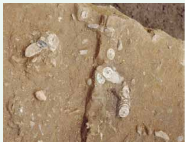
墓跡から出土した銅銭(平安時代中期)