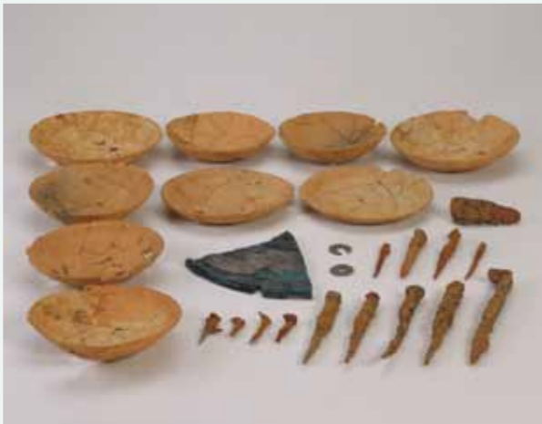
木炭木郭墓の副葬品(平安時代前期)