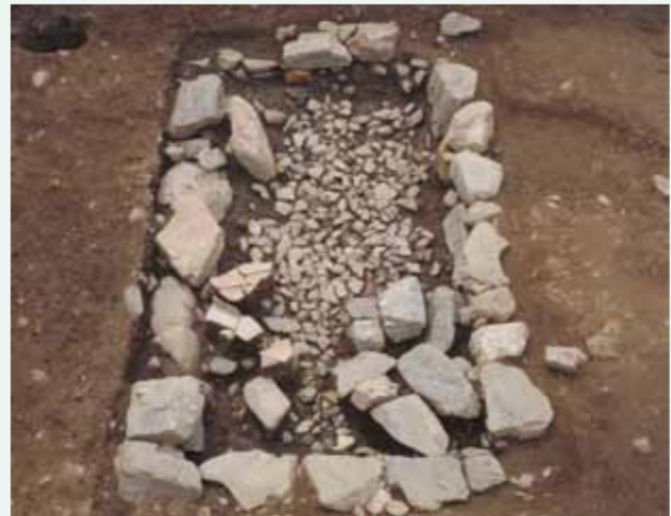
石で囲まれた墓跡(平安時代後期)