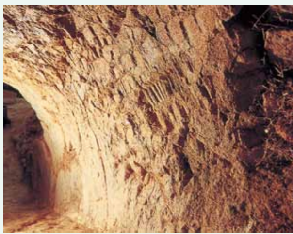
窯跡内部の側壁に残る工具の跡