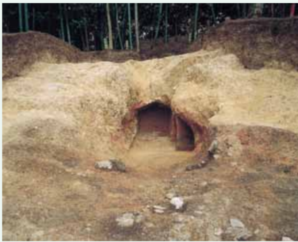
須恵器を焼いた穴窯跡(飛鳥時代)

1995年に発掘調査された須恵器の窯跡です。窯は丘陵斜面の岩盤をトンネル状に掘り抜いてつくられた穴窯とよばれるものです。全長は約7mあり、天井部もほぼ崩れておらず、トンネル状のまま地中に埋もれていました。窯の内部は掘り抜いた際に使用された工具の痕跡や補修した粘土もみられました。窯跡前面の灰原からは多量の炭や焼土に混じって、多くの焼き損じた須恵器片が出土しました。須恵器の型式や種類から窯の操業年代が7世紀の前半から中頃までであることが明らかになりました。また、出土した須恵器にはコンパス文を描いたものやヘラで文字を刻んだものも出土しています。