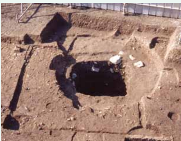
竪穴住居跡(飛鳥時代)