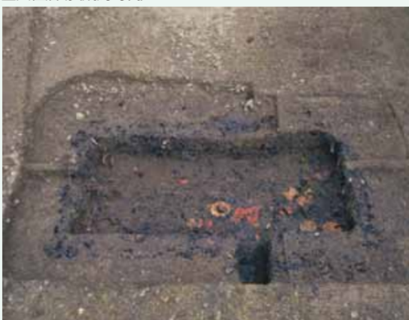
木棺の周囲に木炭をつめた木炭木郭墓(平安時代前期)