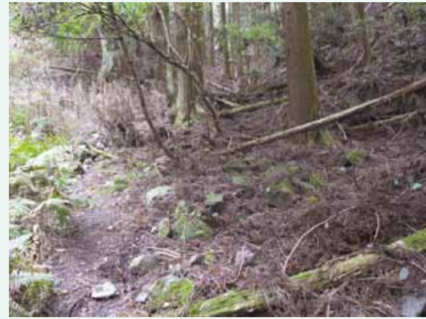
安祥寺山中腹の斜面に散在する石材