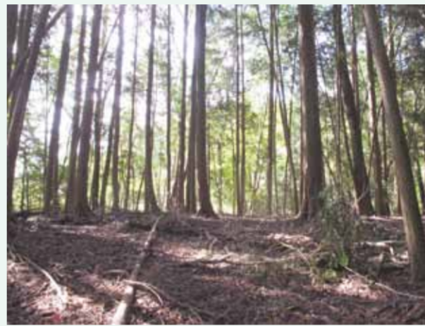
安祥寺上寺の建物があったとみられる平坦地