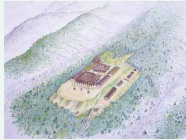
安祥寺上寺の想像復原図 礎石や基礎跡などから作図(梶川敏夫氏)