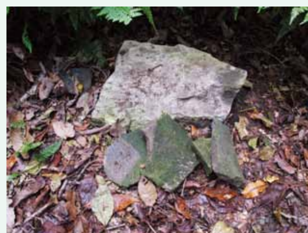
安祥寺上寺跡に残る礎石