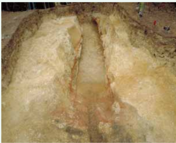
天井部を除いた窯跡内部の様子