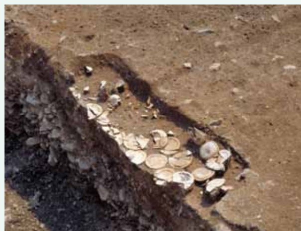
土師器皿や銅銭が副葬された墓跡(平安時代中期)