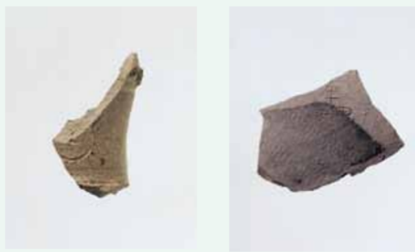
コンパス文がある須恵器