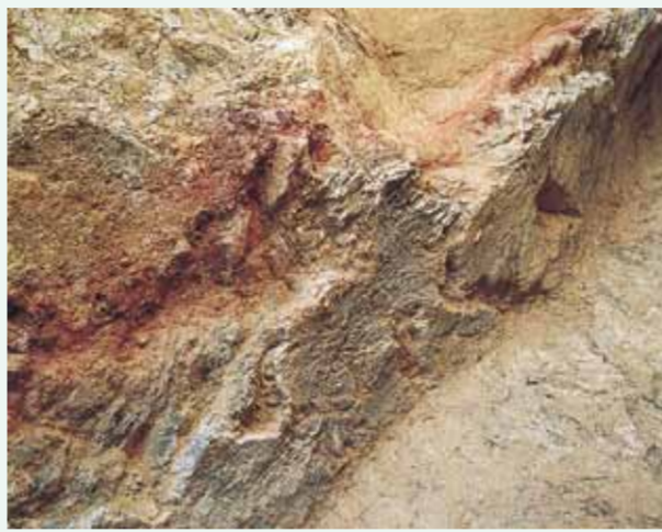
窯跡内部を粘土で補修した箇所