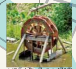
内堀の南側にある水車模型

淀川水車旧趾(よどのかわせのみずぐるまきゅうし) 江戸時代の淀城には宇治川や淀川に面して二ヶ所の揚水用の大水車(直径約8m)があり、城内の庭園に川水を汲み上げる役割を担っていました。