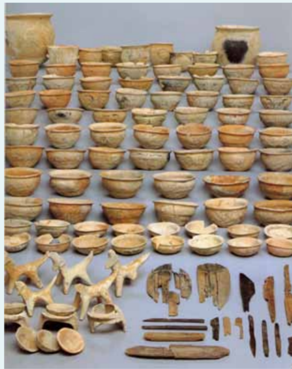
祭祀に使用された墨書人面土器と土馬や木製品（市指定文化財）