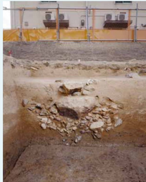
米蔵の礎石根固め断面 礫敷きの上に大石を重ねています