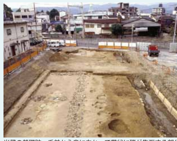
米蔵の基礎跡 手前から奥に向かって帯状に礫が集石する部分

2003年の発掘調査では米蔵の基礎跡と礎石跡を発見しました。基礎跡は「布基礎」とよばれる帯状に礫を詰めた基礎工法で、幅2～3m、深さは約1.5mありました。米蔵跡は東西約39m、南北約8mの長大な規模でした。