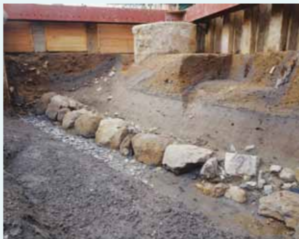
淀城中堀跡の石垣

2006年の発掘調査で旧淀駅下から中堀跡の西側石垣を発見しました。石垣は下に続いており、堀はさらに深くなっていました。さらに2010年の発掘調査でも中堀跡の西側石垣が見つかっていました。