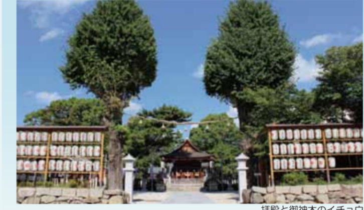
拝殿と御神木のイチヨウ

豊田秀吉の側室・淀殿の産所となった淀古城跡推定地の一角に、1626年に建立された法華宗の寺院です。寺の南側にある水路は淀古城の堀跡とされ、周辺には「北城堀」など城に関する地名が残ります。1868年の鳥羽・伏見の戦いで激戦地となり、本堂には砲弾の貫通跡が残されています。