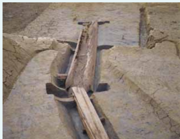
丸木船を転用した木樋