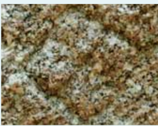
前田利常・利長の刻印