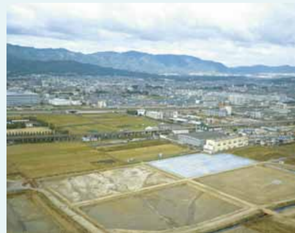
上空から見た水田跡