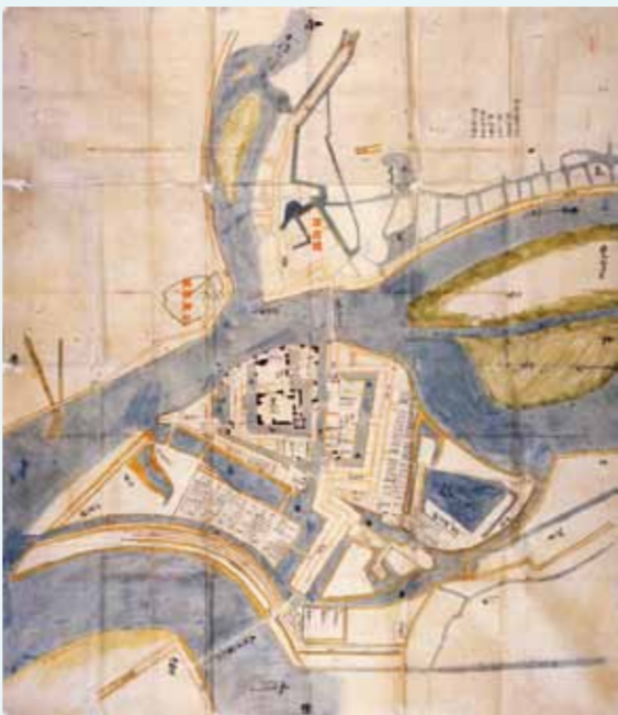
『淀城大絵図』 京都大学工学研究科建築学専攻蔵

永正元年（1504）納所に淀城（古淀城）が置かれましたが、文禄三年（1594）破却されました。元和九年（1623）に伏見城の廃城が決定され、京都守護の城として新たに淀城が築かれます。1987年に天守台の調査が行われ、淀城跡公園として整備されました。1999年から2010年にかけて京阪電気鉄道淀駅高架に伴う発掘調査が実施され、本丸の曲輪、内堀や外堀の濠、石垣、三の丸内の米蔵、淀城築城以前の道路と町屋などが発見され、古絵図などに示された、淀城の全体像が明らかになりつつあります。