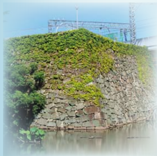
発行 京都市・(財)京都市埋蔵文化財研究所