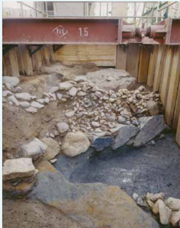
淀城中堀跡の石垣