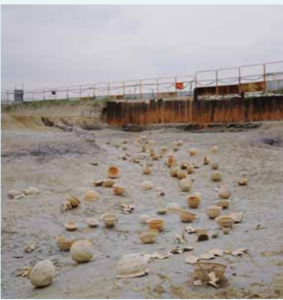
河川跡から出土した多数の墨書人面土器や土馬