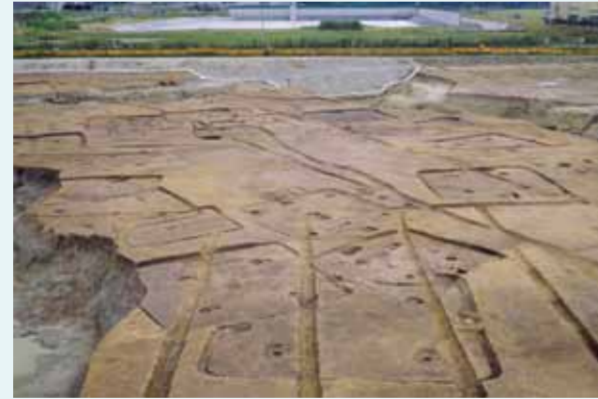
河川に囲まれた集落跡