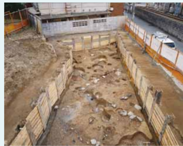
道路跡に隣接した町屋跡