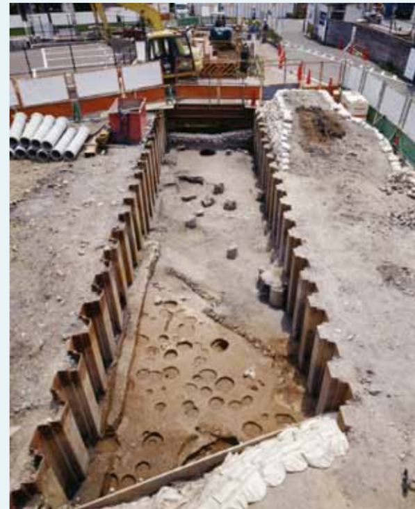
淀城下層で見つかった道路跡

2004年の調査では淀城築城以前の大坂街道跡を発見しました。道路の幅は約7.5mありました。また道路跡に隣接する調査区では、町屋の跡も見つかり、古淀城の城下町の様子が明らかになってきています。