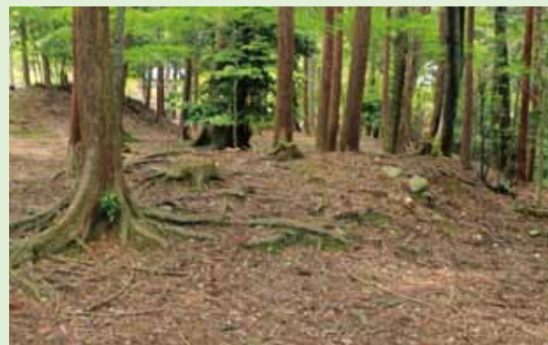
神護寺境内に残る土塁