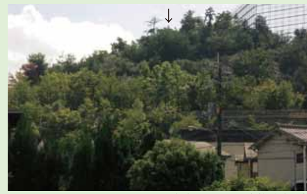
遺跡のあった丘陵(矢印部分)

1997年4月、右京区梅ヶ畑向ノ地(むこうのち)町にある丘陵で発掘調査が行われました。ここは嵯峨野の背後にある丘陵端で、北側には京と丹波や日本海沿岸を繋ぐ周山街道(国道162)が東西に通っています。発掘調査では丘陵頂部の尾根筋に造られたテラス状の平坦地から焼土層や柱穴が見つかり、丘陵斜面にかけては奈良時代中期から平安時代前期の土師器、須恵器、二彩陶器、瓦、銭貨、仏を描いた線刻石製品など多量の遺物が発見されています。なかでも二彩陶器が多いこと、墨書で「秦」「□寺」の字が書かれた土器や細い線で仏が刻まれた石片が見つかったことが注目されました。これらの出土品や遺跡の立地などから、平安京遷都前後にこの丘陵で何らかの祭祀が行われたとみられ、「梅ヶ畑祭祀遺跡」と名付けられました。なおこの丘陵の東斜面からは京都市内唯一の梅ヶ畑銅鐸が見つかっています。