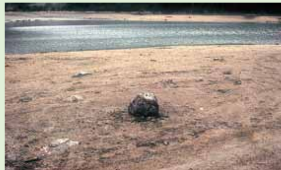
池畔に残る建物の礎石