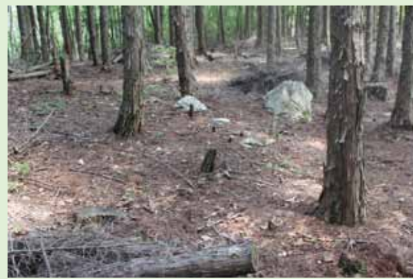
平坦地に残る礎石と石材

標高約370mの沢山山頂付近にある沢ノ池の南斜面地に平坦面が点在しています。礎石が残る平坦面、大・小の石材や平安時代前期から中期にかけての土器や瓦類も見つかっています。また信仰の対象である磐座(いわくら)とみられる大岩も確認されており、平安時代以前から信仰の山であったことをうかがわせます。