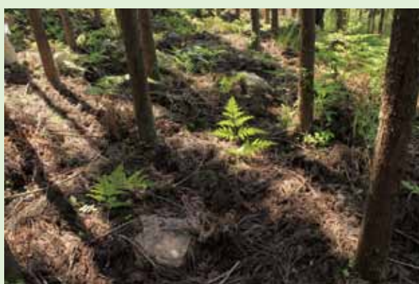
平坦地に残る礎石群

清滝川の支流・高鼻川東岸の斜面、標高約330mの平坦地に位置しています。平坦地には建物跡を示す礎石が残り、石材や土器も散在しており御堂跡の存在をうかがわせます。