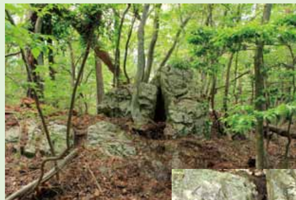
磐座とみられる大岩