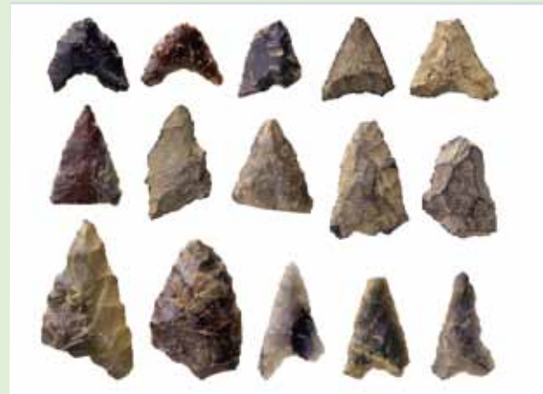
採集された縄文時代の石鏃