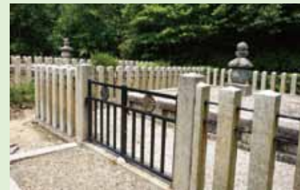
山頂にある文覚上人と性仁法親王の墓