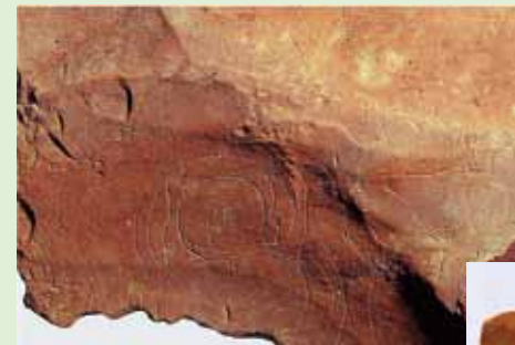
如来座像が刻まれた石片