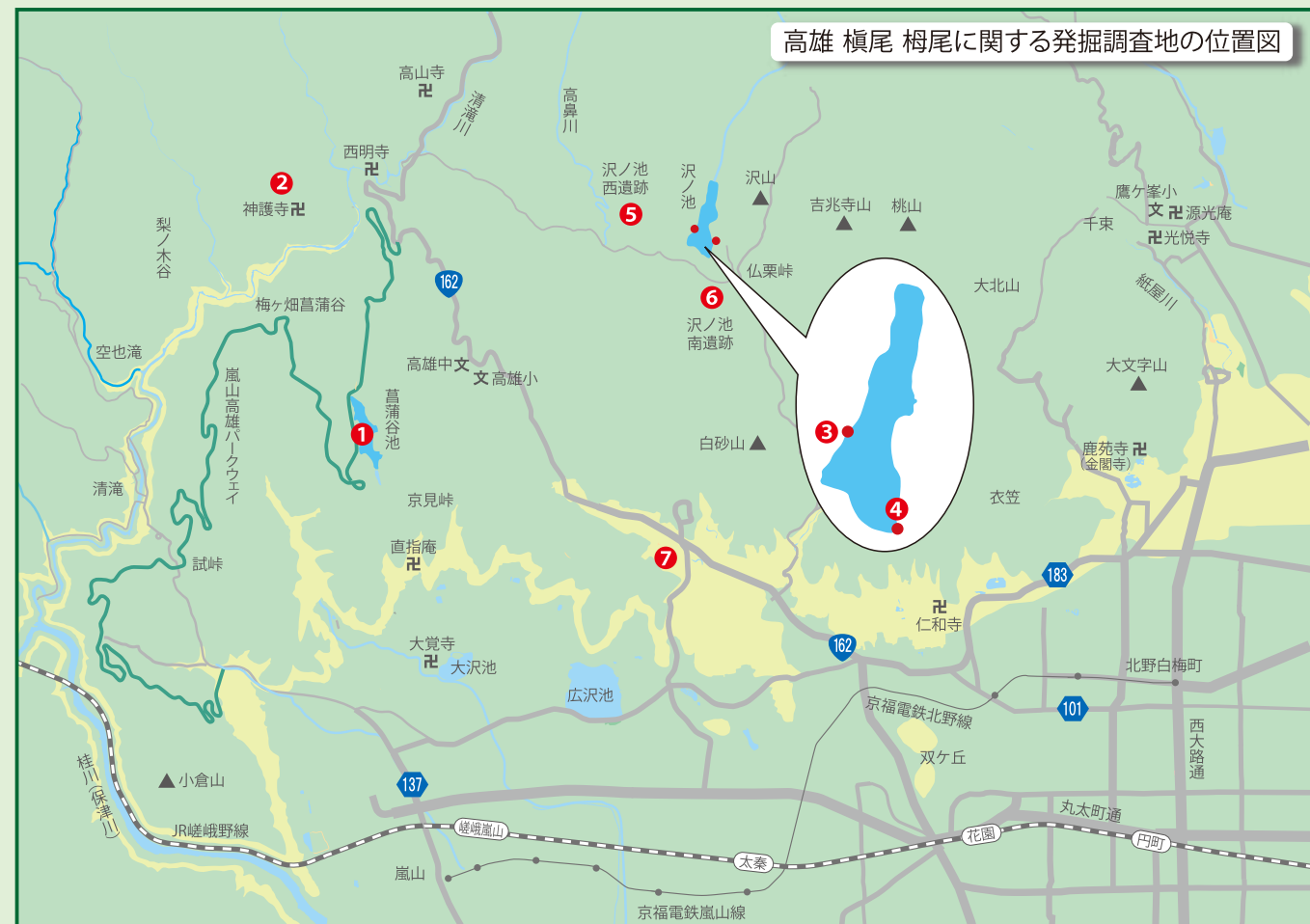
高雄 榎尾 柵尾に関する発掘調査地の位置図