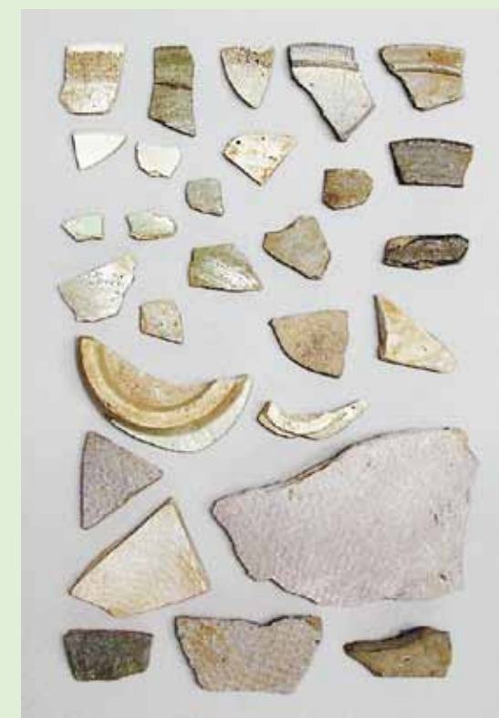
採集された土器片