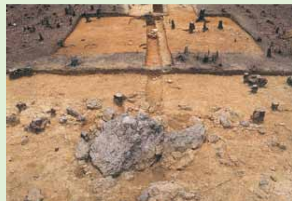
丘陵頂上 手前に磐座とみられる巨岩