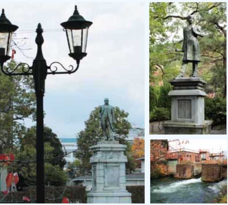
左：北垣国造像 右上：田辺朝郎博士像 右下：東山三條の琵琶湖疏水

ひびこすい 琵琶湖疏水 明治の京都近代化政策における最大の基幹事業として実施された、琵琶湖から京都市内までの全長11.1kmの運河。第3代京都府知事北垣国造が計画し、田辺朝郎が総責任者となって建設されました。現在平安神宮、美術館、岡崎公園などの文化ゾーンを囲むように流れる琵琶湖疏水周辺は、四季の変化に富んだ疎水の景色と赤煉瓦建物の近代産業遺産が共存し、付近に六勝寺跡や院御所跡の石碑が散在しています。