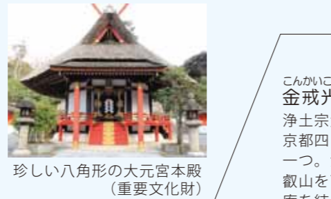
珍しい八角形の大元宮本殿(重要文化財)

よしだじんじや 吉田神社 奈良春日大社の四神を勧請し、平安京の鎮守神として吉田山に創建された神社。境内には天神地祇八百万神(あまつかみにつかみやおよろずのかみ)を祀る齋場所の大元宮をはじめ、料理の神を祀る山蔭神社、お菓子の神を祀る菓祖神社等多彩な末社があります。