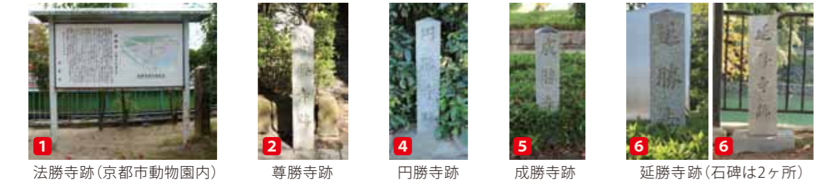
1 法勝寺跡(京都市動物園内) 2 尊勝寺跡 4 円勝寺跡 5 成勝寺跡 6 延勝寺跡(石碑は2ヶ所)