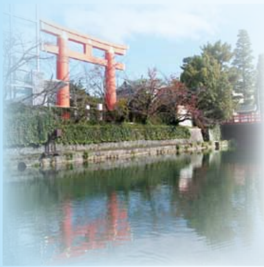
発行 京都市・勅京都市埋蔵文化財研究所