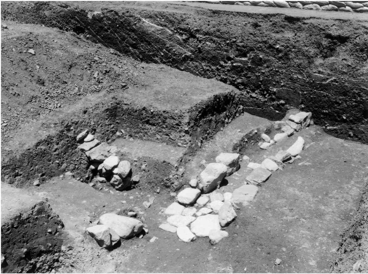
1 石組み溝4・暗渠5と土塁断面(南東から)