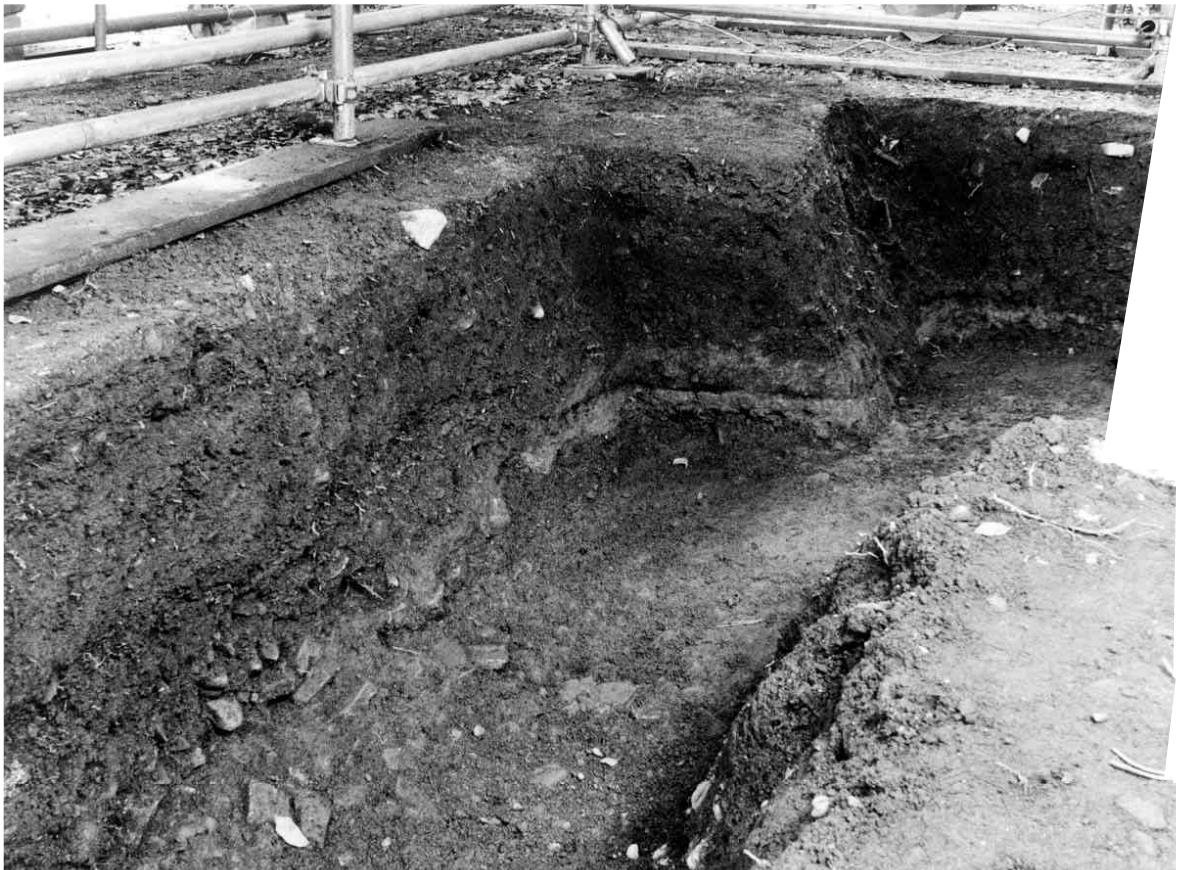
2 1区北壁断面（南西から）