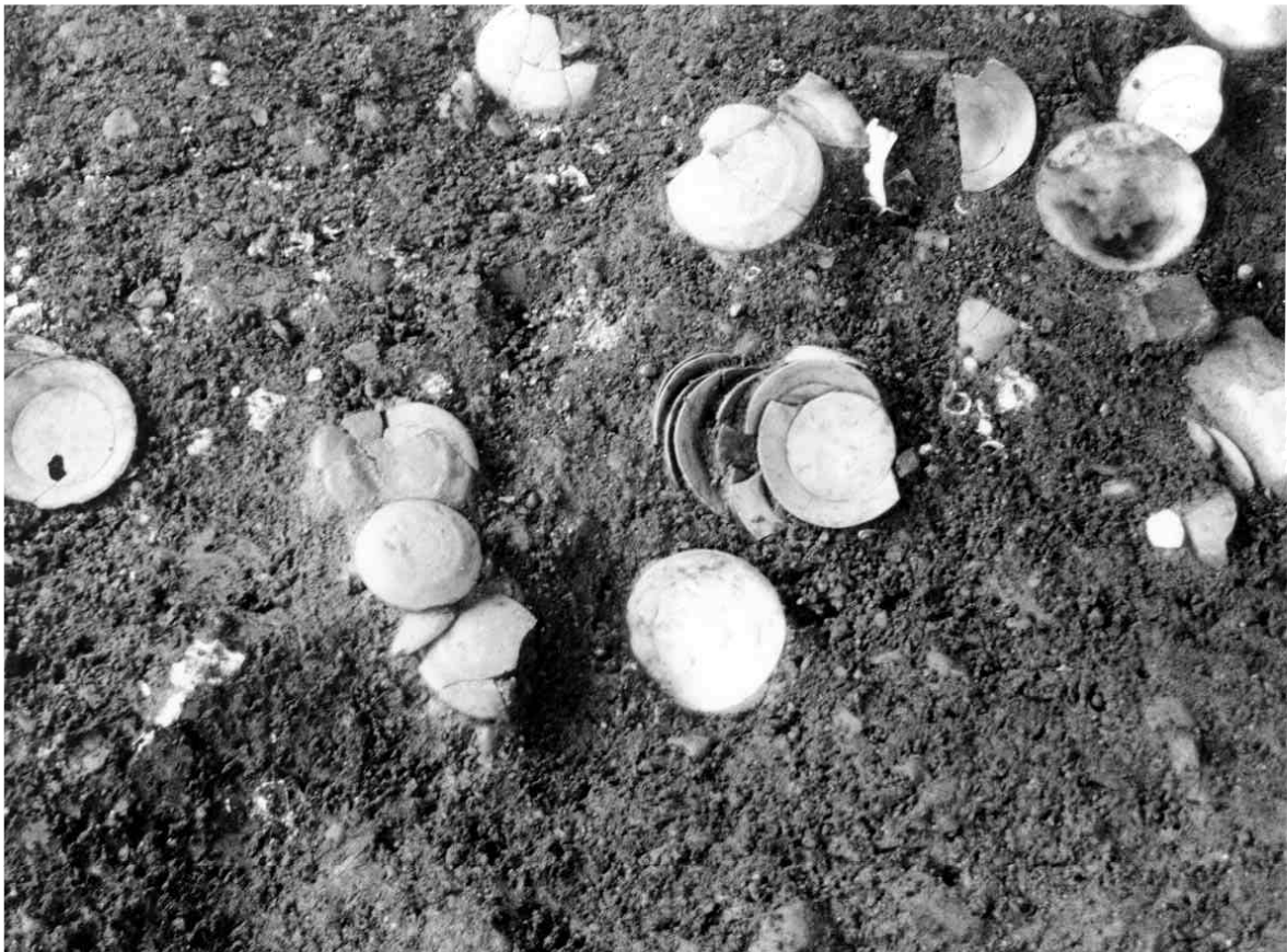
2 2区土壇2遺物出土状況（西から）