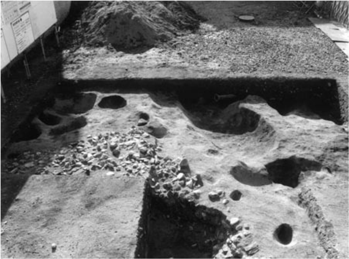
1 3次調査1区全景（北東から）