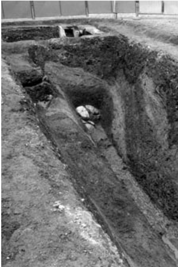
1 4次調査2区全景（南西から）