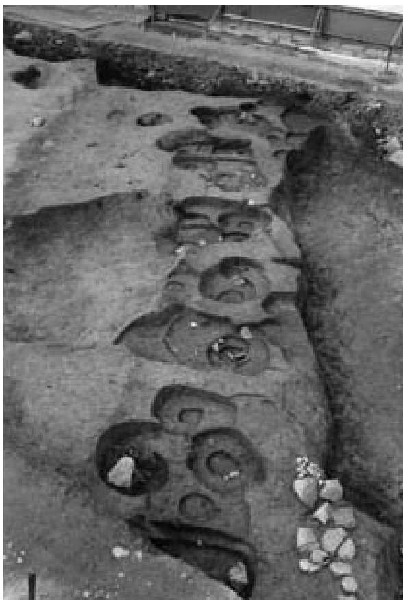
2 2次調査堀跡南肩柱穴群（東から）