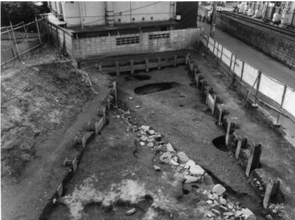
1 3次調査2区第3面全景（北東から）