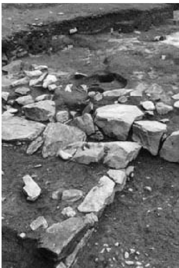
2 3次調査2区特殊遺構 14（南西から）