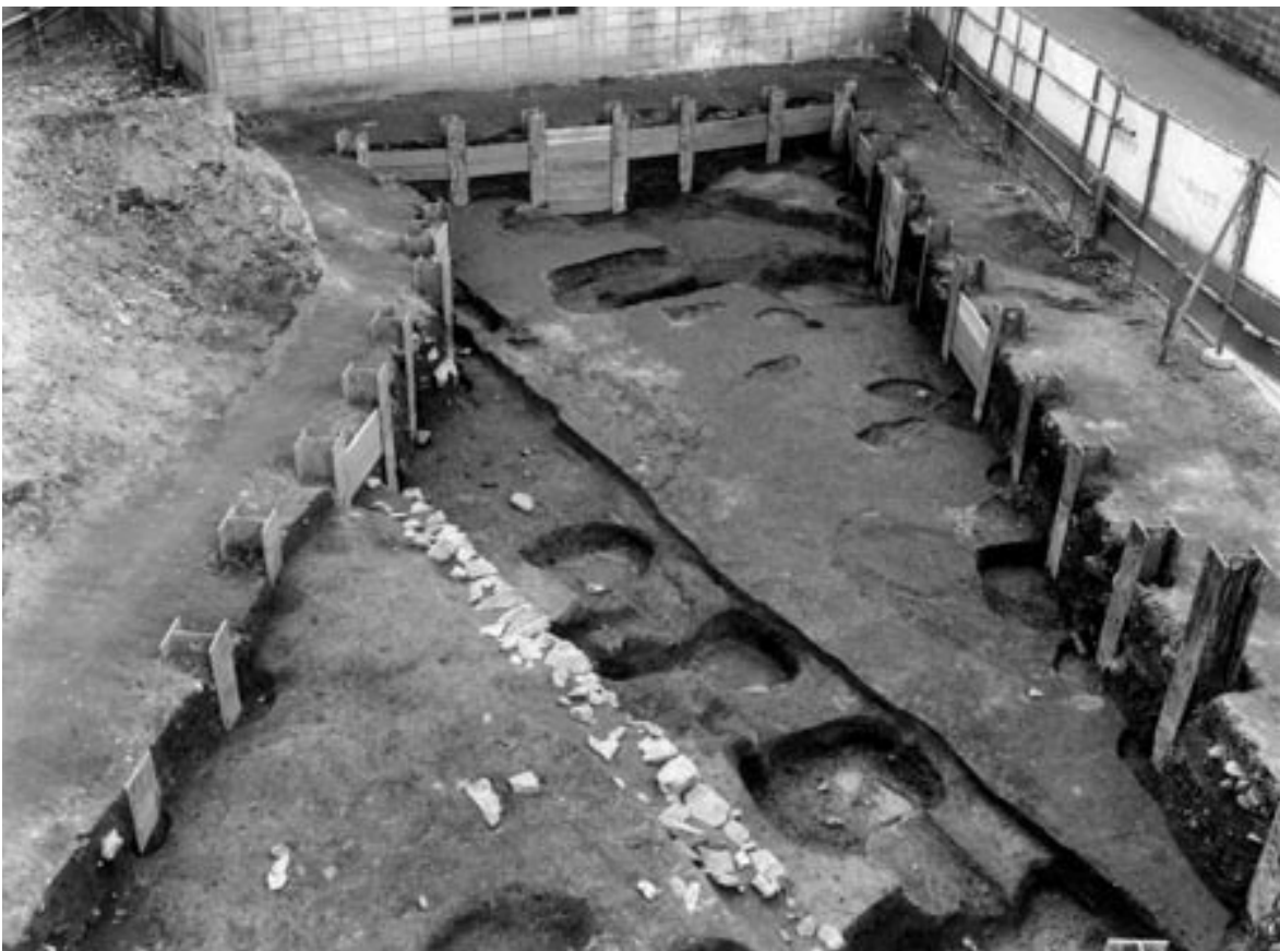
2 3次調査2区第4面全景（北東から）