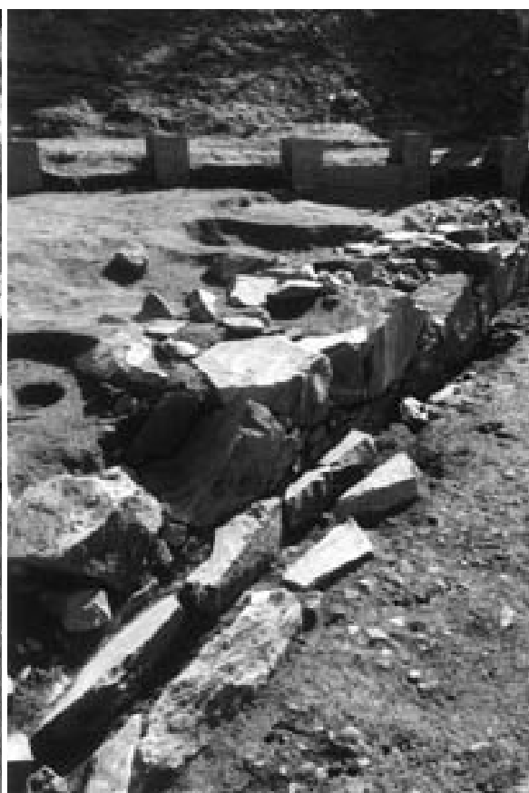
3 3次調査2区特殊遺構 14 下の石組溝 24（北西から）