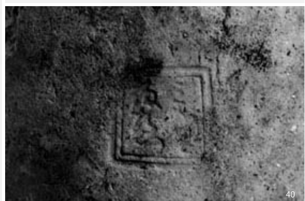
3次調査2区土壙46出土土器陶磁器類