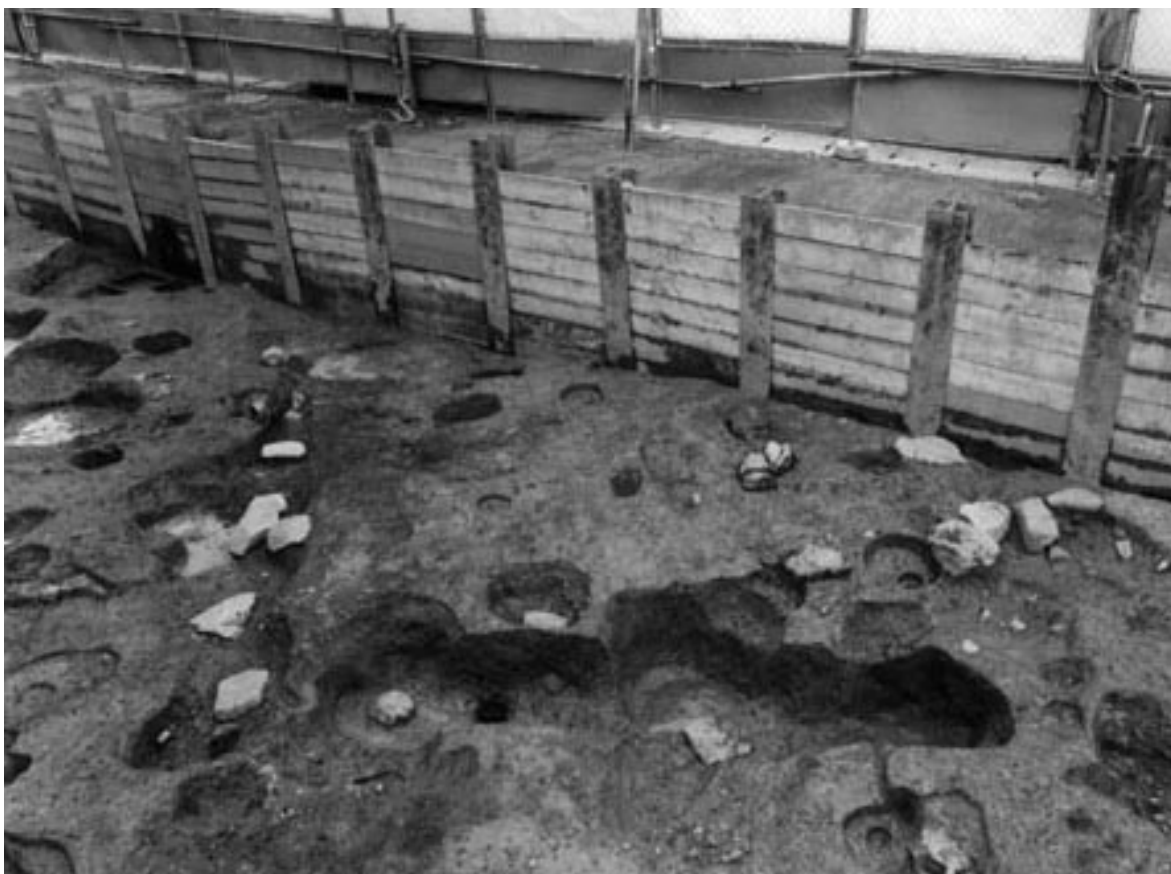
2 3次調査2区町家2全景（東から）