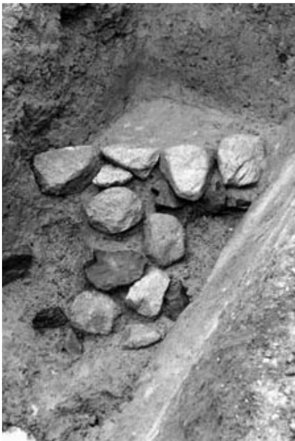
3 4次調査2区石垣12（南から）