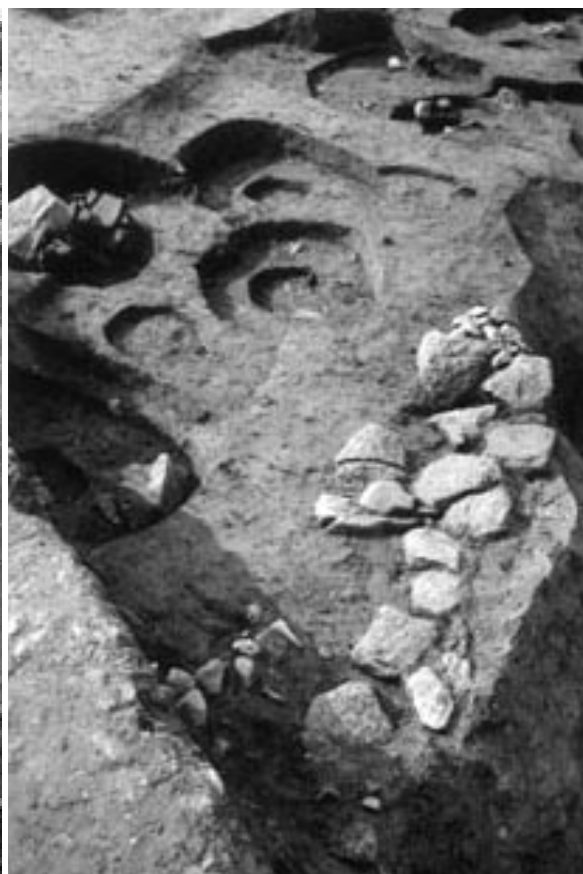
3 2次調査石敷61（北東から）