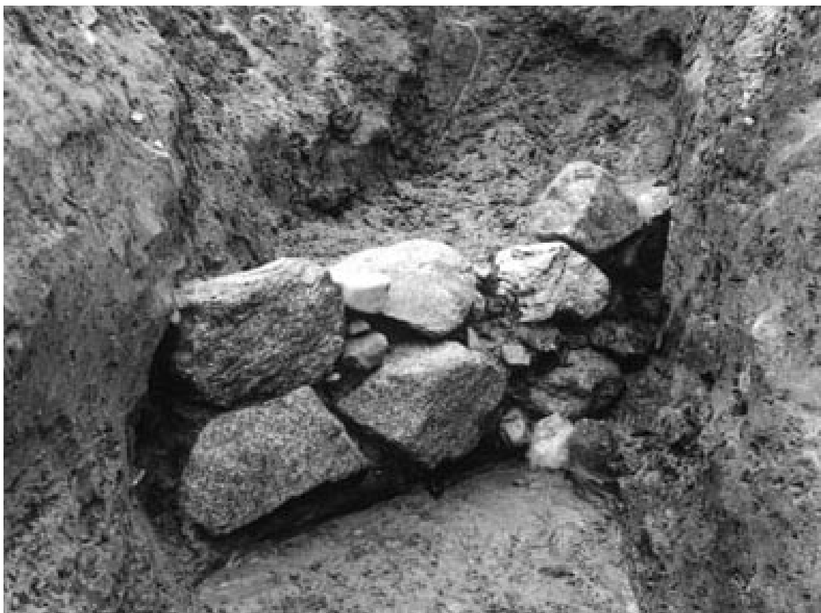
3 4次調査1A区石垣 30 (北から)