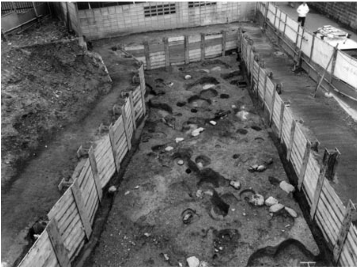
1 3次調査2区第8面全景（北東から）