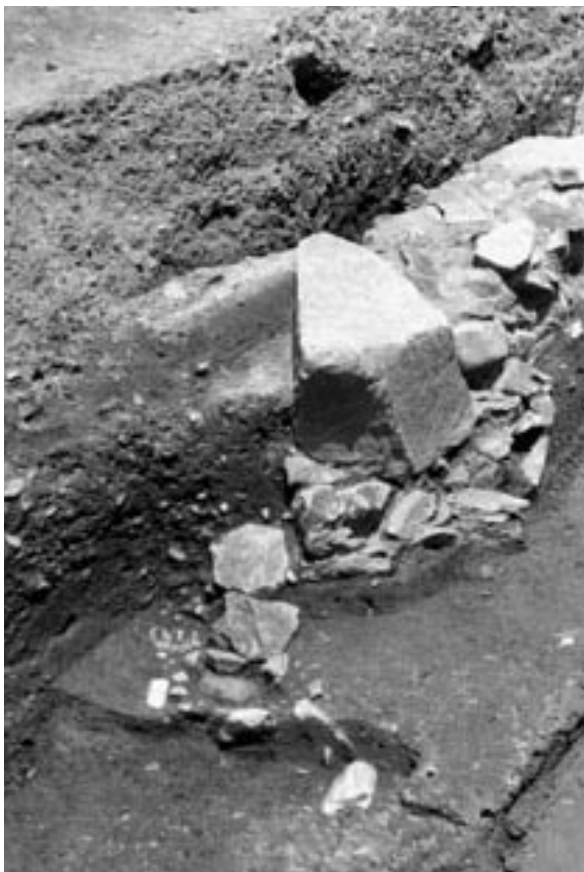
3 4次調査1A区石列7（南から）