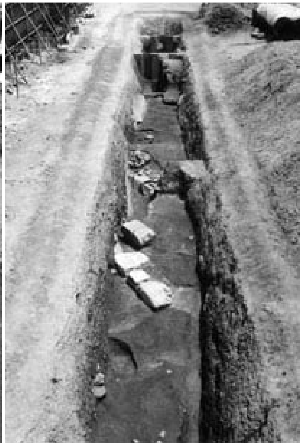
2 4次調査1区2面全景（南西から）