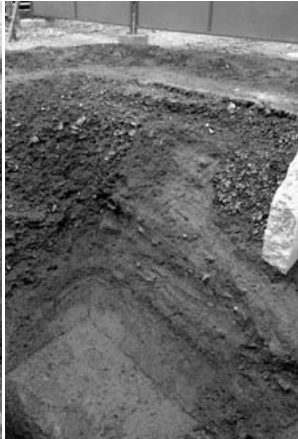
2 4次調査2区北東壁断面（南から）