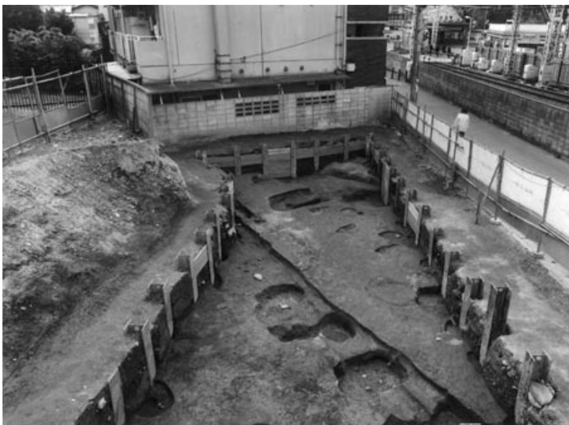
2 3次調査2区第6面全景（北東から）