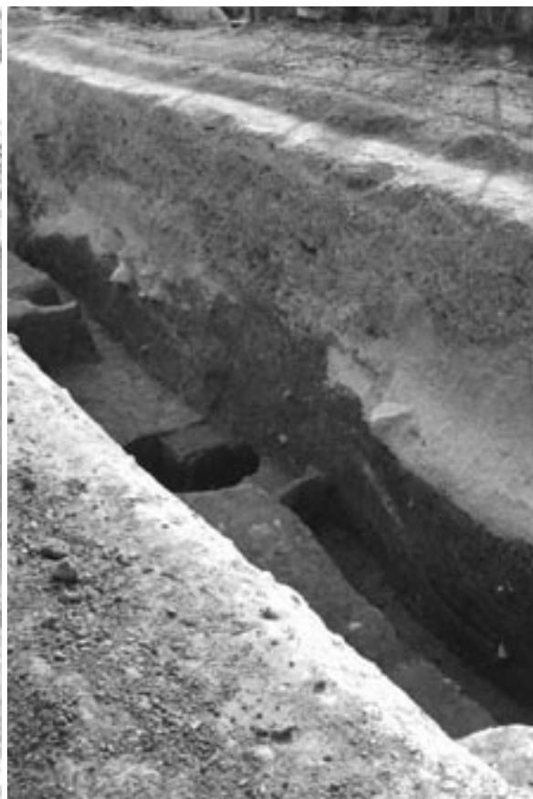
2 4次調査1A区堤状盛土断面 (東から)