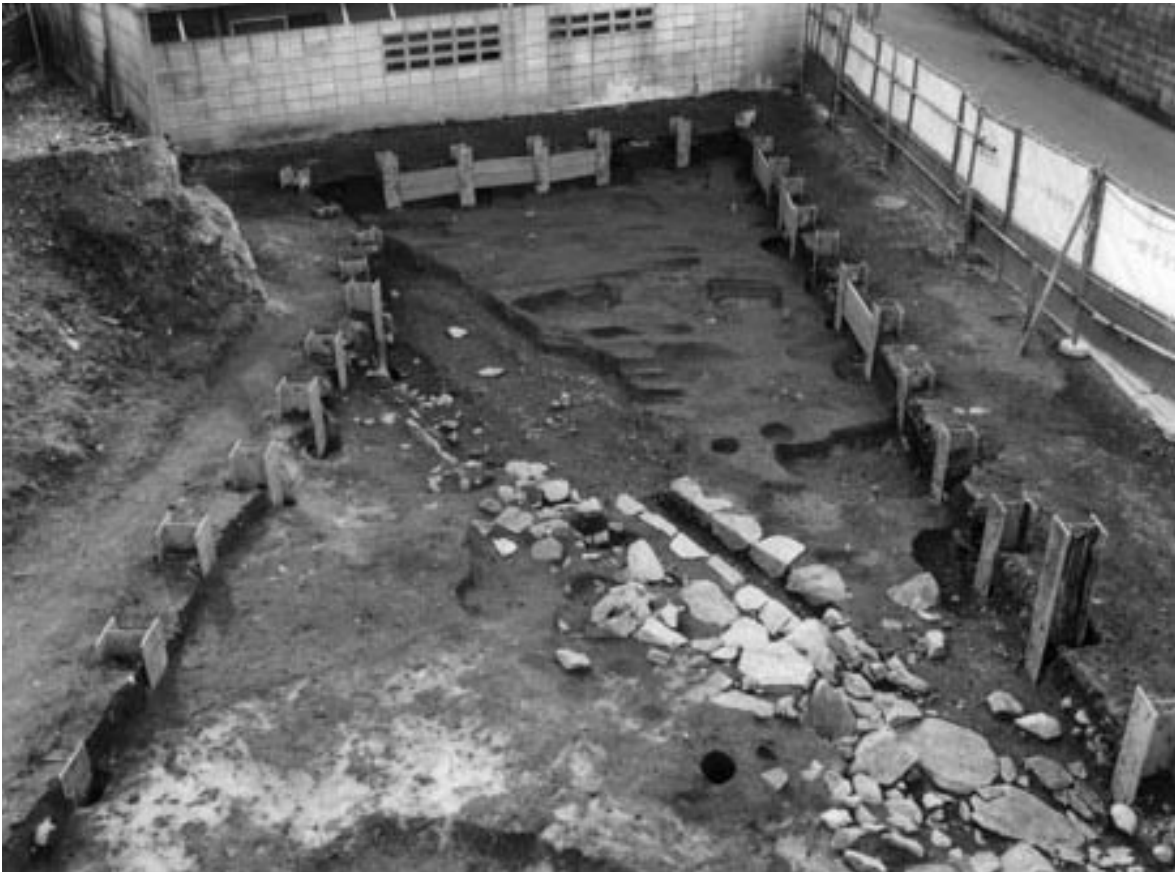
2 3次調査2区第1面全景（北東から）