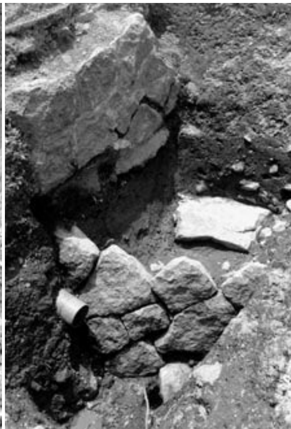
4 4次調査1B区石垣14（北から）