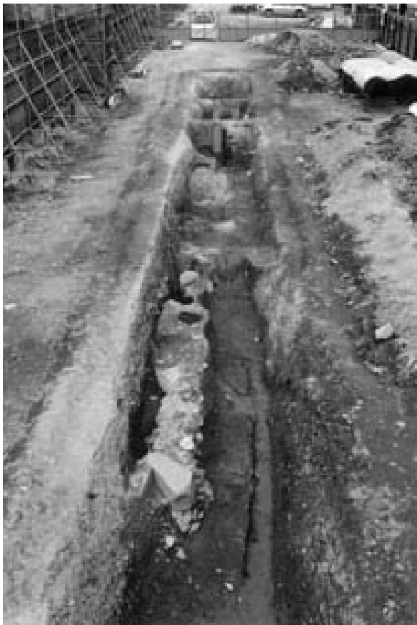
1 4次調査1区1面全景（北東から）