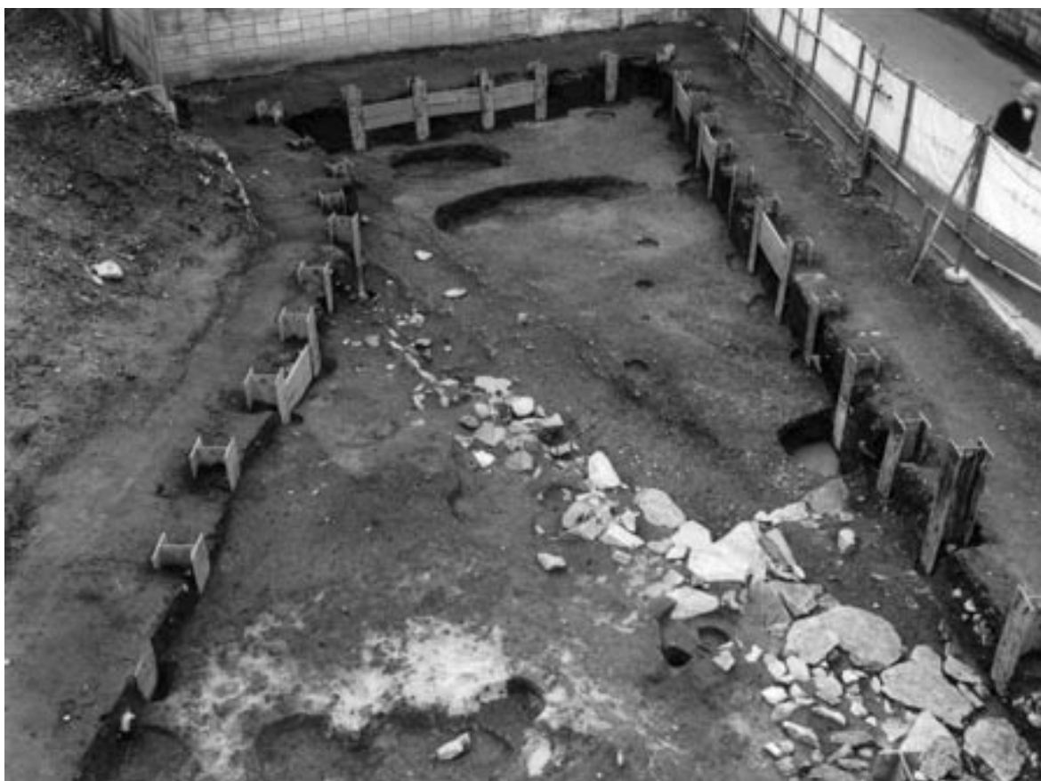
1 3次調査2区第2面全景（北東から）