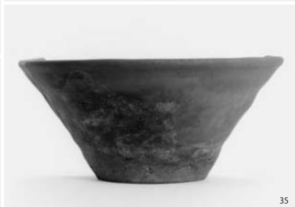
2次・3次調査出土土器陶磁器類