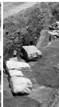
4 4次調査1A区石列19・17・20（南西から）