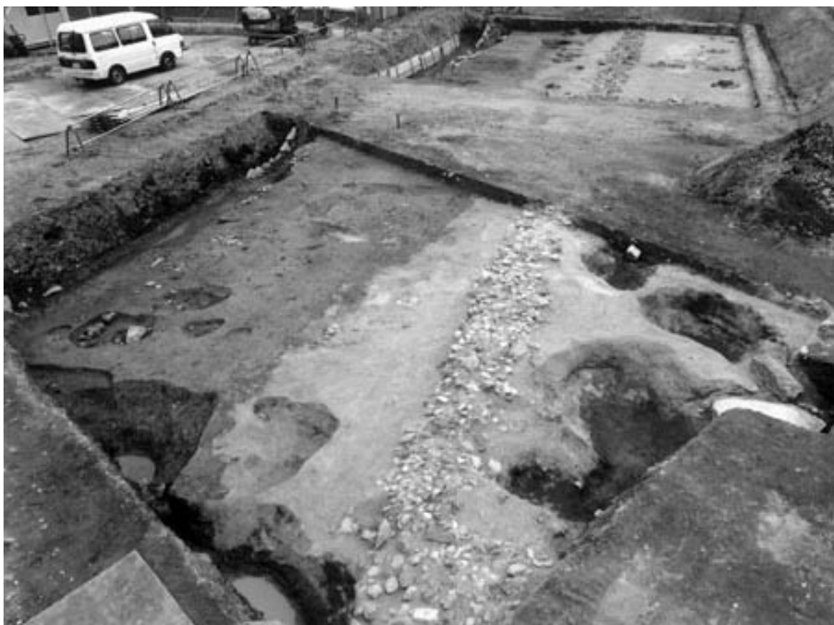
1 2次調査全景（西から）