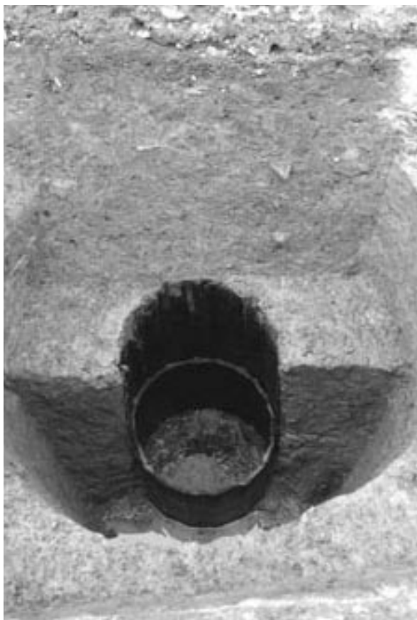
1 4次調査1A区井戸 11 (北東から)