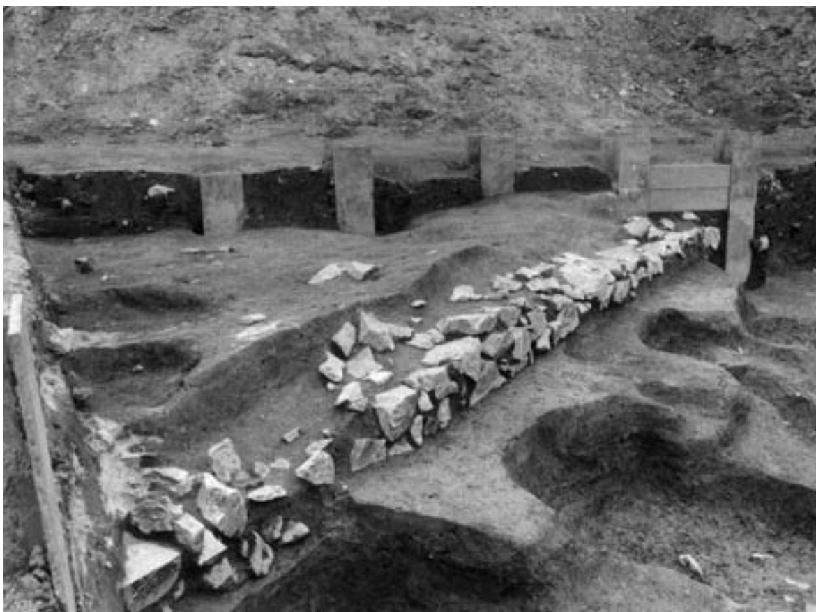
1 3次調査2区石組44（北西から）