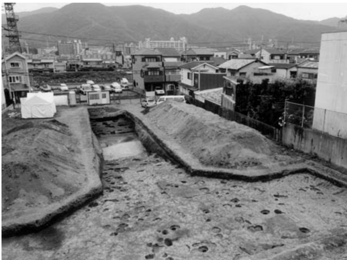
1 調査区全景（西から）