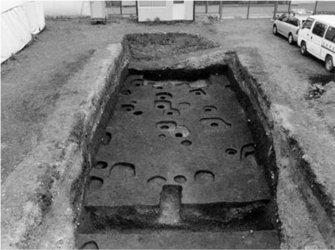
1 調査区東端全景（西から）