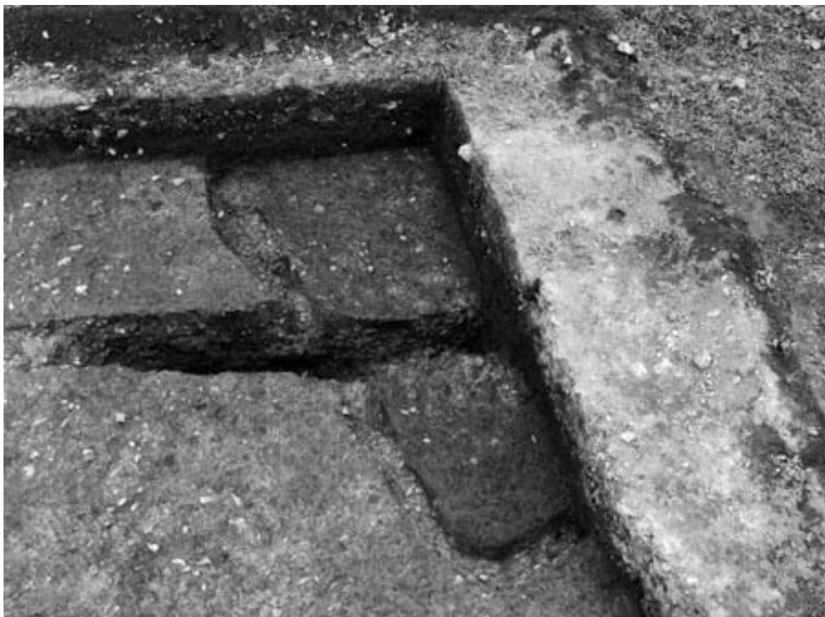
1 竪穴住居 99 (南から)