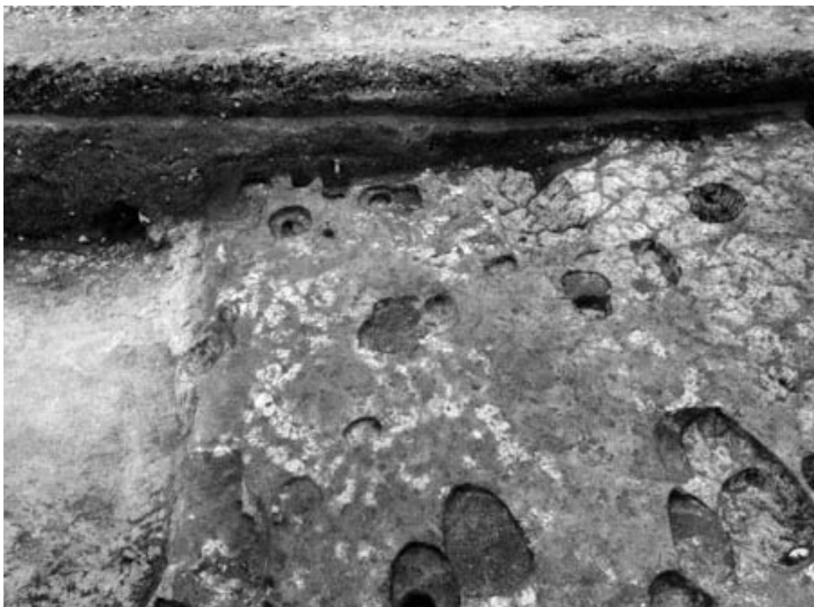
2 掘立柱建物 269 と火山灰検出状況 (北から)