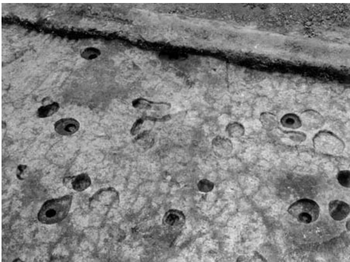
2 掘立柱建物 77（東から）