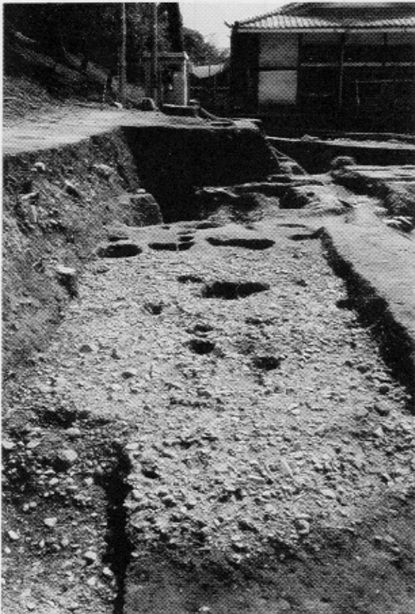
写真2 1区-池南岸の洲浜（北から）