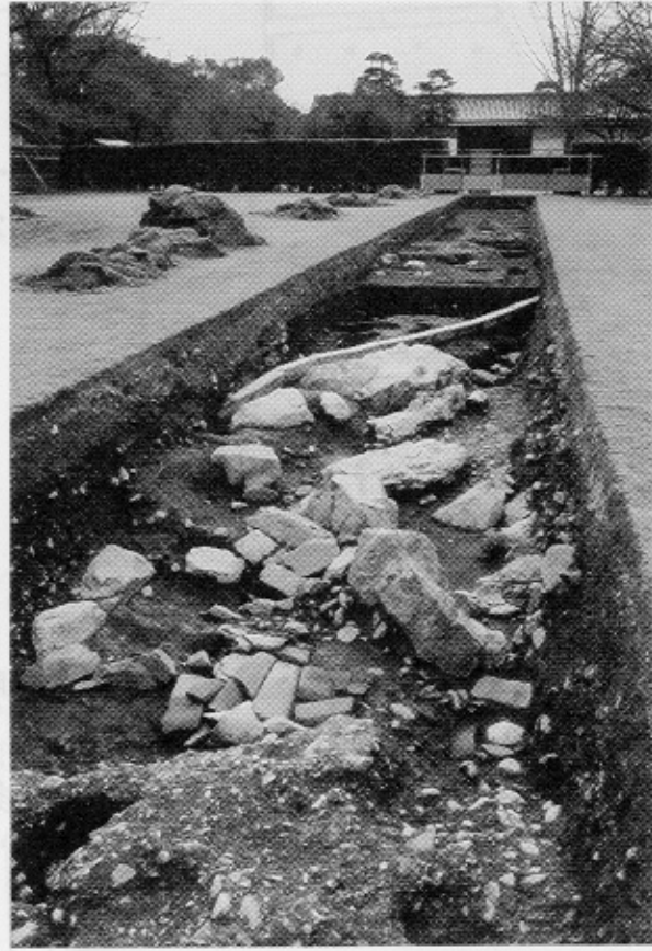
写真3 昨年度調査した池北岸の景石（北から）