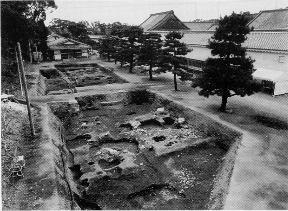
写真1 1区-平安時代後期の庭園（北から）