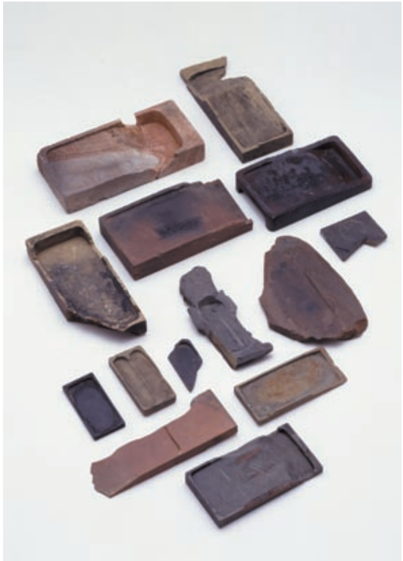
出土した硯の一部

桃山時代に入ると、石製の硯がたくさん出土するようになります。今回の場合も16世紀末の遺構からでした。この期の石硯は、私たちが普段目にする硯とまったく同じです。以後、17～19世紀の遺構か