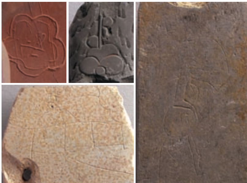
硯と砥石の転用品に書かれていた戯画

石材名では「高嶋青石」「本高嶋上石」「高嶋虎斑石」「虎斑石」「あか志ま本石」などがありました。高嶋石は、湖西の高島の阿弥陀山で採れる石が硯として最適だったことに由来します。虎斑石はその中での特選品を指すわけですが、斑の字は斑の誤りでした。生産地で誤った字を刻むわけがありません。持ち主が自分で刻んだと考えるのが良いでしょう。その際、高名な高嶋虎斑石と刻むことで高級感を演出したようです。