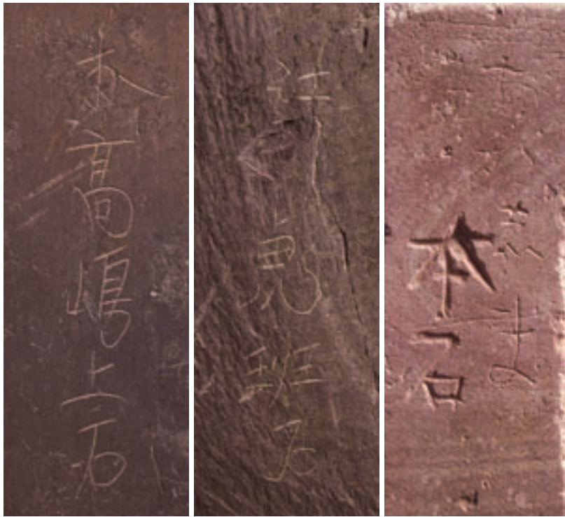
硯に書かれていた石材名 左から「本高嶋上石」「江 虎斑石」「あか志ま本石」