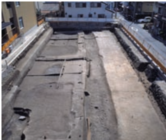
西市外町 検出遺構(上)と推定イラスト(右)