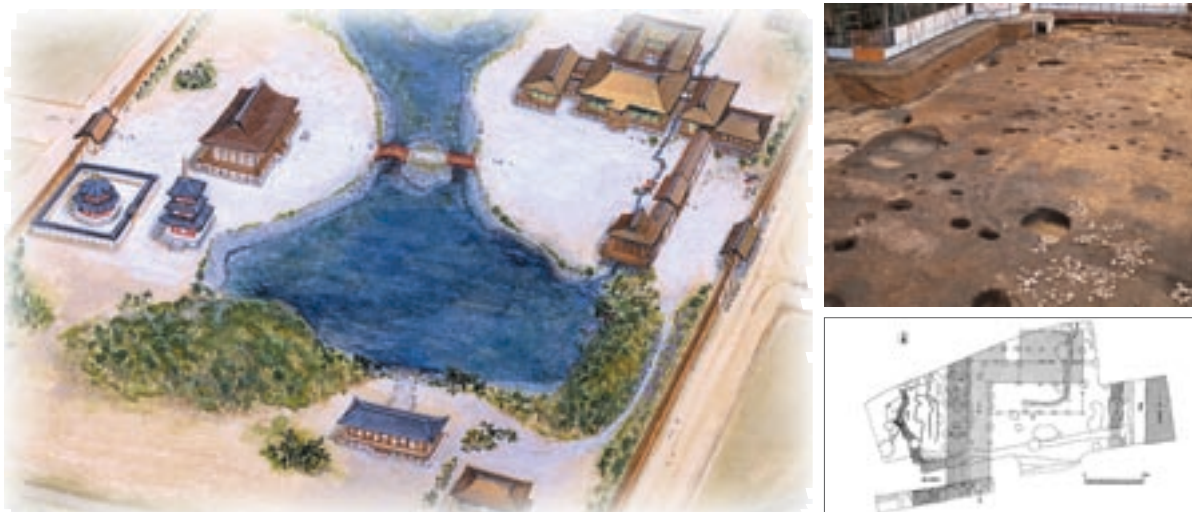
法金剛院の推定イラスト(左)と東御所跡の遺構(右上)・平面図(右下)

んのこと、昔の絵図などの文献史料も建物配置を知る上で貴重な資料となります。また、描こうとする現地の自然地形も重要な要素です。当時の植物の種類も調べなければなりません。人物を登場させるには身につけている装束や使っ