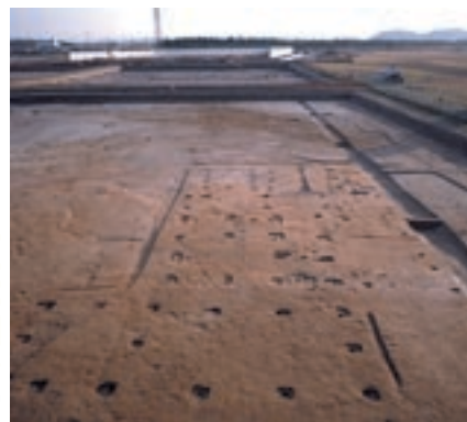
長岡京南東部の宅地 建物跡の遺構(上)と推定イラスト(左)