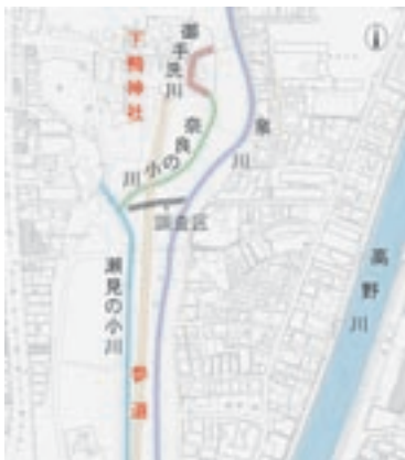
図1 境内と川の位置