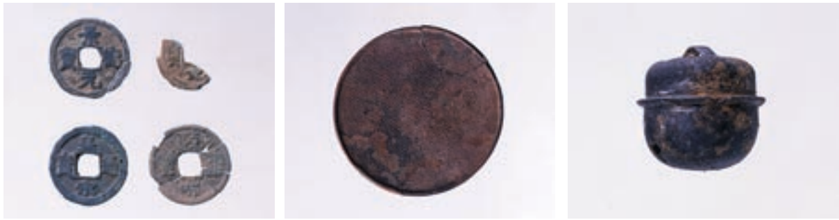
写真2 出土遺物（左から平安時代後期の銭貨、江戸時代の鏡と鈴）