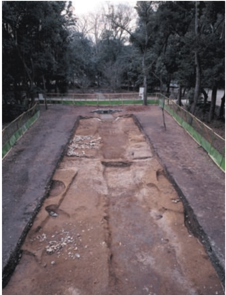
写真1 平成13年度調査で見つかった旧奈良の小川(東から)

の奈良の小川は江戸時代に付け替えられたもので、それ以前の旧奈良の小川は異なる場所にあったことがわかっています。また、史跡整備のための試掘調査でも、現在の川から南へ約12mの位置で旧奈良の小川が確認されていました。この結果を踏まえて平成12・13年度に発掘調査を行なうこととなりました。