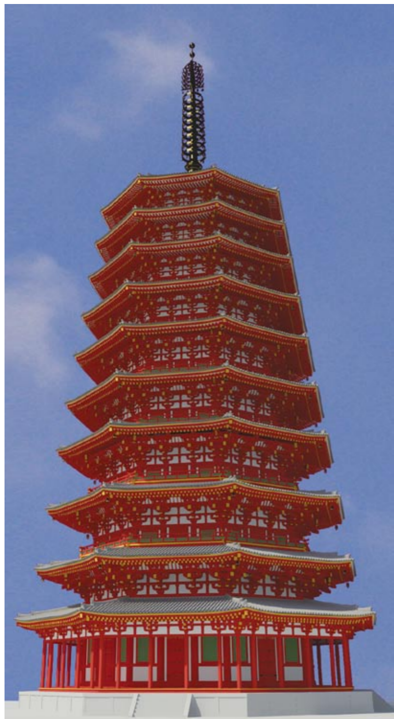
今回CG復元した法勝寺八角九重塔

〔付記〕醍醐寺五重塔立面図は『日本建築史基礎資料集11』(中央公論美術出版、1984)より転載し、2011年復元の図面・CGは竹川浩平が作成した。