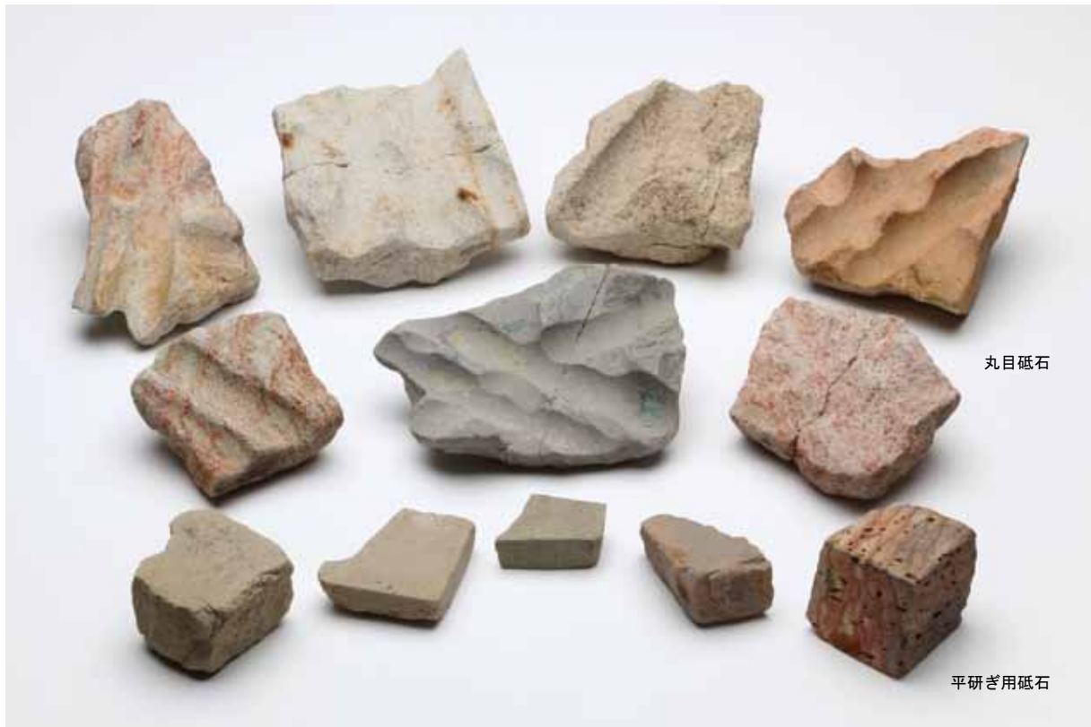
写真1 出土した丸目砥石（上7点）と平研ぎ用砥石（下5点）

はじめに 江戸時代の中頃に、京都で「寛永通寶」を鑄造していたことをご存知ですか？