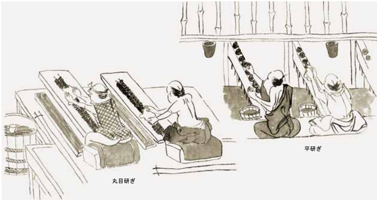
図1 錢座の作業 「石巻鑄錢場作業工程絵図」を参考にした

9.0cmから13.5cmの方形で、断面半円形（幅2.5cmから3.0cm・深さ1.0cmから1.5cm）の溝状の使用痕が認められます。ほとんどの使用痕は砥石の対角線を結ぶ方向に認められ、またそれに直交する方向にもみられます。破損するまで使用されたようで、原形をとどめるものはありません。