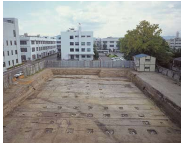
平安京右京三条三坊五町の邸宅

冷然院は左京二条二坊三町から六町の4町を占める広大な邸宅であった。現在はその南半分を二条城が占めている。城内の調査では、1mを越える大きさの石材を組み合わせた遣水（やりみず）が見つかった。底面の一部には瓦を平坦に敷いている。