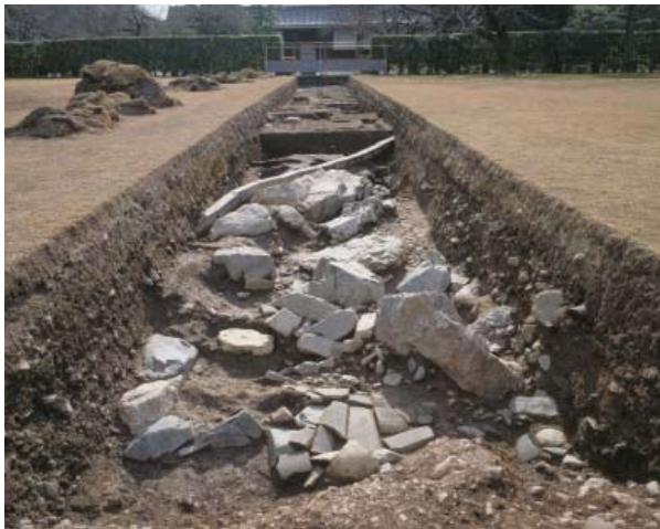
冷然院の庭園（北から）

9世紀後半に位置付けられる日本最古級の平仮名である。土器の外表面全体に文字を記している。平安京内の有力貴族の邸宅から出土したことは、仮名文字の成立と展開に関する非常に重要な資料である。