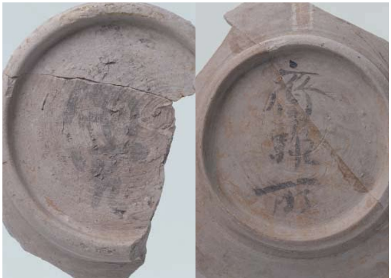
「齋宮」・「齋雑所」の文字を記した墨書土器

写真左手前の泉から湧き出した水が池を灌（かん）いでいた。池の汀には丸い河原石で洲浜がつくられている。右手前には泉に面した建物の柱穴が並ぶ。