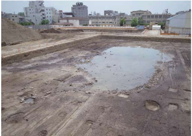
平安京右京三条二坊十六町「齋宮」邸の庭園（北西から）

また、平安京内では、嵯峨上皇にはじまり皇族が代々にわたって居住した「冷然院」、邸宅内の工房跡が見つかった淳和上皇の「淳和院」、日本最古級の平仮名で話題となった藤原良相の「西三条第」、菅原道真を左遷した藤原時平の「本院」、平等院鳳凰堂を建立した藤原頼通の「高陽院」など、平安時代を彩った著名な人々の邸宅の発掘