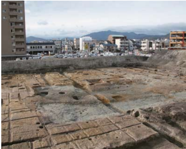
藤原良相邸の池と建物（南東から）

平安時代前期に右大臣をつとめた藤原良相の邸宅は、平安京右京三条一坊六町の1町を占め、「西三条第」別名「百花亭」と呼ばれた。邸宅北西部の池からは墨書土器のほか多量の遺物が出土した。その中には最高級の工芸品が含まれている。