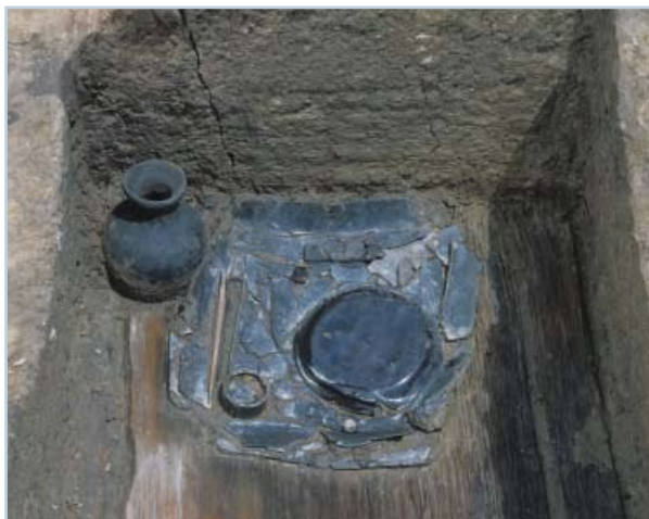
平安京右京三条三坊十町出土の化粧道具

大きな柱穴が整然と並ぶ大規模な建物がL字形に配置されている。邸宅の主の名前は記録にないが、この地が後に棲霞寺（現在の清凉寺）の領地となったことから、嵯峨天皇の皇子で光源氏のモデルともされる源融との関わりがうかがえる。