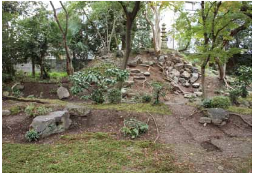
写真1 調査中の庭園 (A区 東から)

庭の来歴 寺が所蔵している『龍華西院歴代録』によると、「四十九世妙義院日至上人、庭築山数々造営」という記述があります。正し