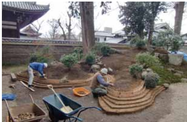
写真4 築山の修理（B区 北東から）