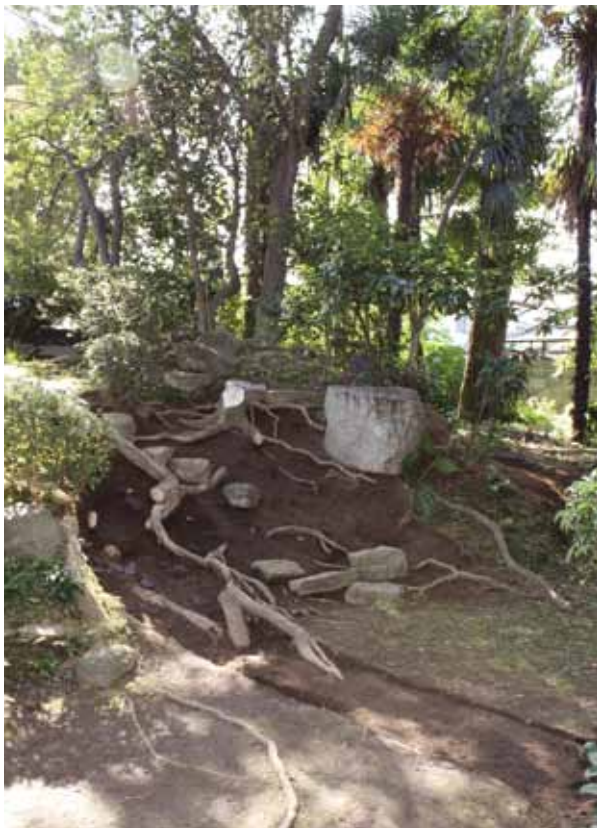
写真3 調査中の石階段（B区 北東から）