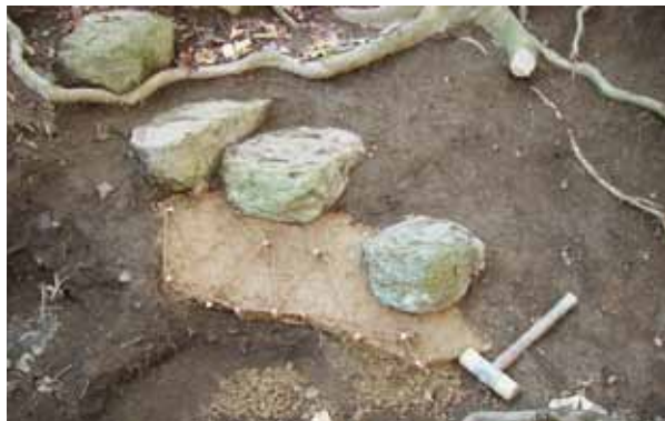
写真5 階段石の設置（B区）

C区の3箇所です（図1）。腐葉土や苔などを取り除き、旧来の地表面を探し出すことから始めました。A区の築山の高低差は約2.5mで、頂上には層塔が置かれています（写真1）。南側には自然石を並べた階段がありますが、サルスベリなどの樹木が茂り、根の成長によって石が持ち上げられ、位置ずれや落石していることがわかりました。