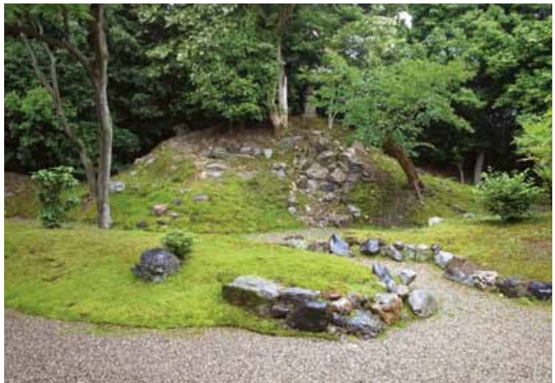
写真2 修理整備後の庭園 (A区 東から)

くは五十世ですが、日至上人が立本寺の住職をしていたのは天保14年(1843)から嘉永3年(1850)なので、庭が造られたのは江戸時代末期ということがわかります。このように作者と作庭年代が明確であること、池を造らずに大小の築山を配した起伏の多い景観で