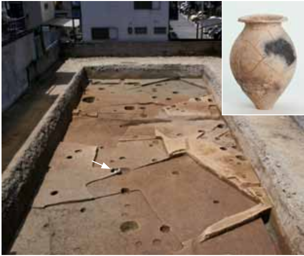
3 平安京右京六条四坊一町跡・西京極遺跡 右京区西院清水町

古墳時代の竪穴建物跡が重複して複数棟あり、土師器・須恵器などの遺物が出土した。また、弥生時代中期後半の土坑には壺が納められており、完形に近い形で出土した（東から）。