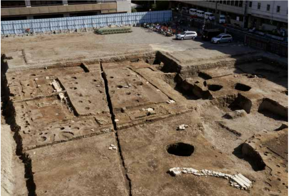
1 寺町旧域（妙満寺跡） 中京区押小路通河原町西入榎木町

京都市役所の新庁舎整備に伴い、豊臣秀吉によって開かれた寺町の妙満寺跡の調査を行なっている。写真の祖師堂跡は天明8年(1788)の火災後に再建されたもので、桁行7間、梁行4間半、西面中央には前拝を設けている。北の調査区では本堂跡も見つかっており、確認された遺構は妙満寺所蔵の『妙満寺志稿』の絵図と合致する。右下の石組遺構は中川の井と呼ばれた井戸跡である（西北西から）。