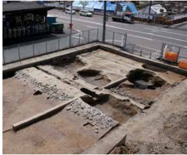
4 平安京右京七条一坊七町跡 下京区朱雀分木町

古墳時代の竪穴建物跡が重複して複数棟あり、土師器・須恵器などの遺物が出土した。また、弥生時代中期後半の土坑には壺が納められており、完形に近い形で出土した（東から）。