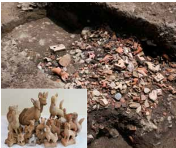
6 平安京左京五条二坊十一町跡・烏丸綾小路遺跡 下京区高辻通堀川東入西高辻町

元格致小学校内の発掘調査で、江戸時代後期の土坑からキツネの土人形が大量に出土した。学校に残る資料にも、大正時代の校内図の調査地点に「いなり社」と描かれていた（南西から）。