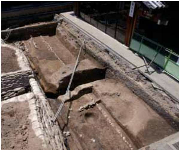
5 法住寺殿跡 東山区三十三間堂廻り

平安宮皇嘉門に通じる皇嘉門大路の東築地跡両側で、瓦片が落下した状態を検出した。東側溝の断面に地震痕跡が認められ、平安時代前期の地震で築地塀が倒壊した可能性がある（北東から）。