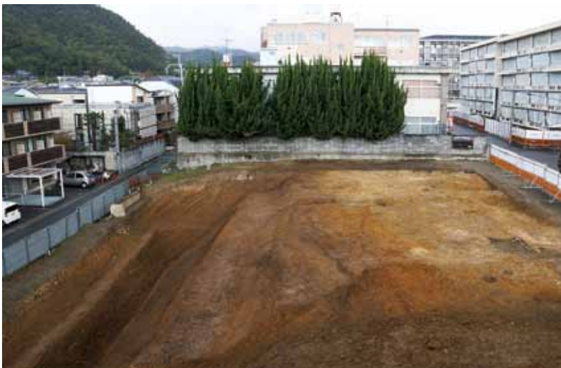
2 御土居跡 北区紫野花ノ坊町ほか

京都市役所の新庁舎整備に伴い、豊臣秀吉によって開かれた寺町の妙満寺跡の調査を行なっている。写真の祖師堂跡は天明8年(1788)の火災後に再建されたもので、桁行7間、梁行4間半、西面中央には前拝を設けている。北の調査区では本堂跡も見つかっており、確認された遺構は妙満寺所蔵の『妙満寺志稿』の絵図と合致する。右下の石組遺構は中川の井と呼ばれた井戸跡である（西北西から）。