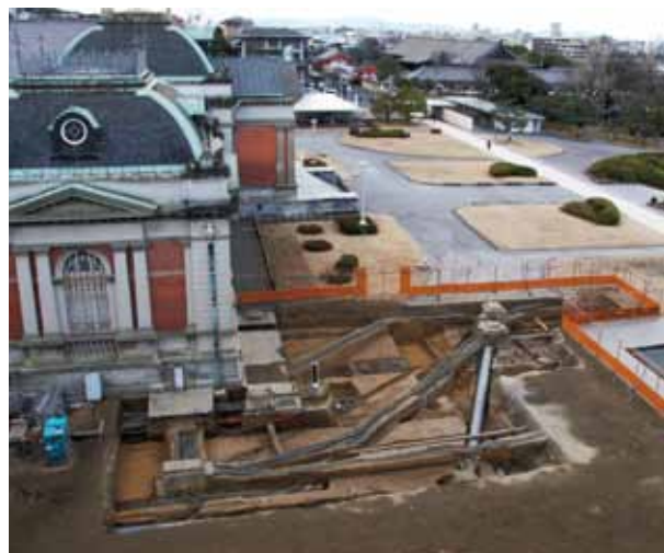
7 方広寺跡 東山区茶屋町・京都国立博物館敷地内

元格致小学校内の発掘調査で、江戸時代後期の土坑からキツネの土人形が大量に出土した。学校に残る資料にも、大正時代の校内図の調査地点に「いなり社」と描かれていた（南西から）。