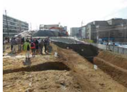
現地説明会 御土居跡