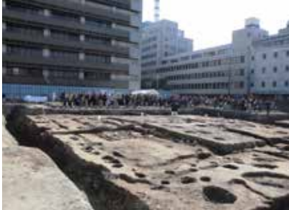
現地説明会 寺町旧域 (妙満寺跡)