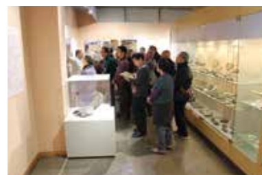
解説ボランティア研修