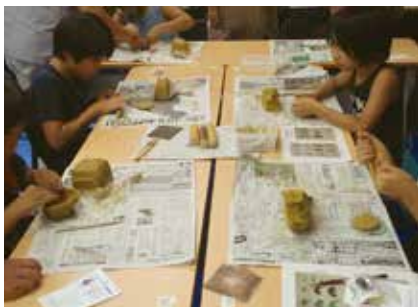
やましな古代体験教室