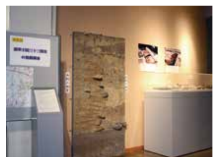
速報展「蓮華王院三十三間堂の発掘調査」