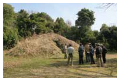
史跡ウォーク「大枝・桂坂の遺跡」