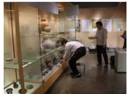
合同企画展「HEIAN 掘る！」準備状況