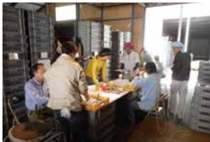
百井収蔵庫におけるランク分け作業