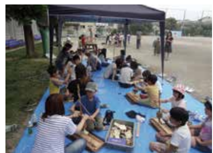
出前授業 火起こし