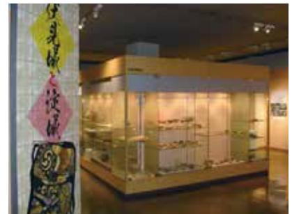
特別展示「伏見城と淀城」

古代京都の風景―遺跡復元鳥瞰図の世界―」（2016. 5. 23 ～ 2017. 6. 3）