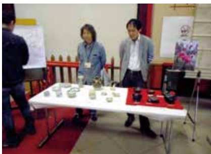
伏見・お城まつり