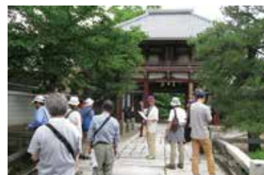
史跡ウォーク「小川を遡る」