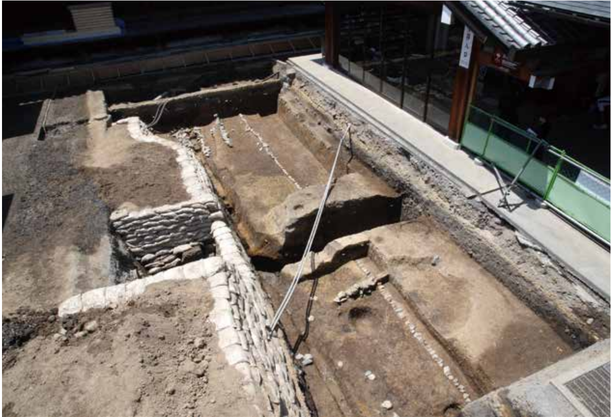
法住寺跡，蓮華王院（三十三間堂）：三十三間堂の北側に延びる地業（北東から）