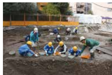
生き方探究・チャレンジ体験