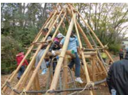
出前授業 竪穴住居葺き替え

○市内小・中学校他において、遺物説明、遺跡・史跡説明、歴史授業、勾玉づくり、土器づくり、火起こし体験、土器炊飯、竪穴式住居葺き替え等を実施