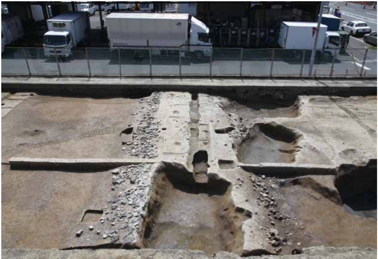
平安京右京七条一坊七町跡：皇嘉門大路東築地。地震によって倒壊した瓦が散乱している。(北から)