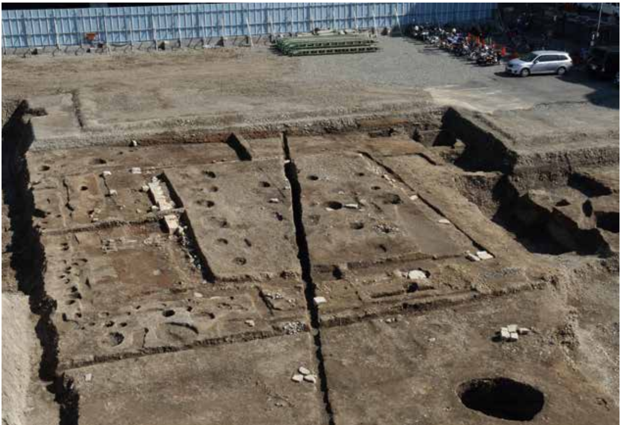
寺町旧域(京都市庁舎): 妙満寺祖師堂の基壇。漆喰で塗りこめた耐火構造となっている。(南西から)

その他、京都市文化財保護課が実施した平安宮跡、方広寺跡、伏見城跡・指月城跡、山科本願寺南殿、大藪遺跡、羽東師城跡、芝古墳など7件の発掘調査、5件の整理業務を支援した。