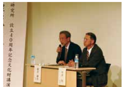
研究所設立 40 周年記念講演会