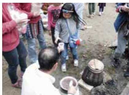
出前授業 土器炊飯