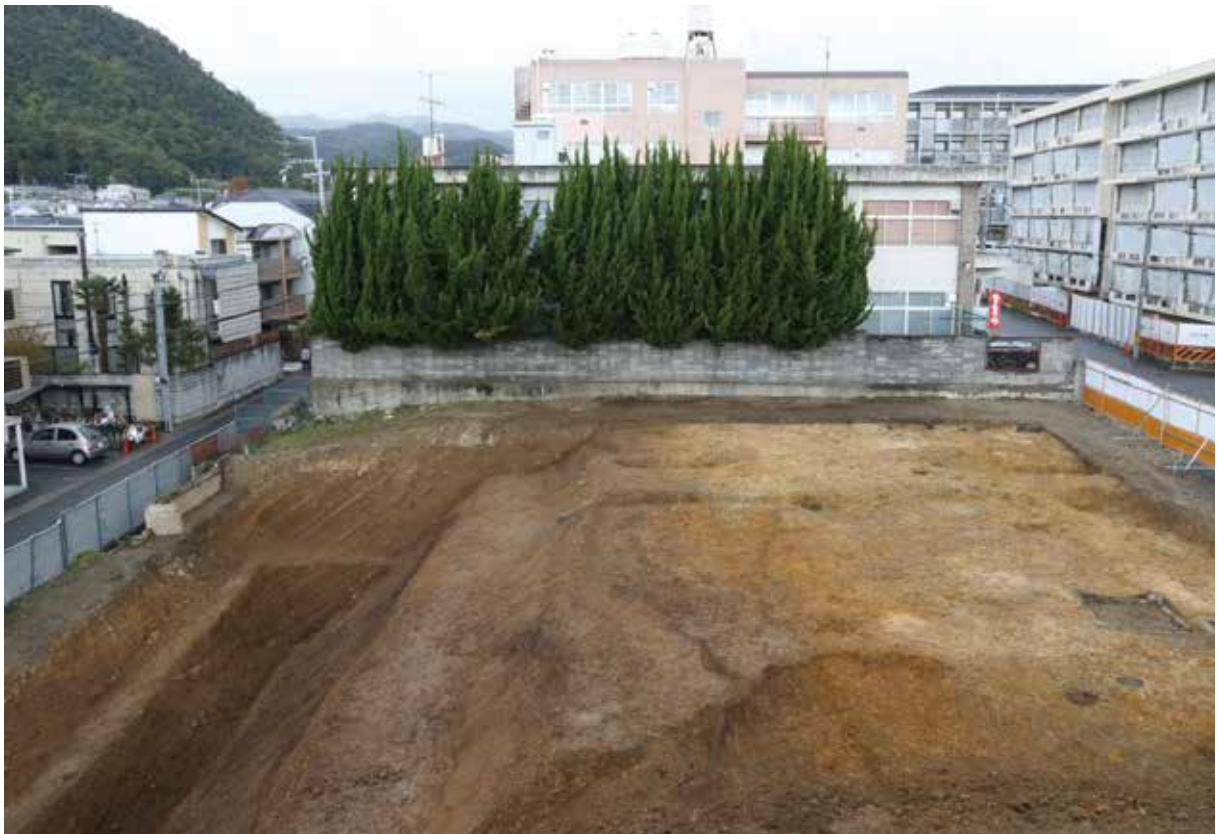
御土居跡：土塁の盛土は失われているが、左手にテラス状の犬走と堀の一部が見える。（南から）