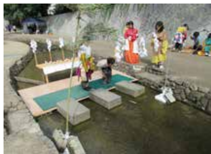
一条戻橋と古代の祭祀