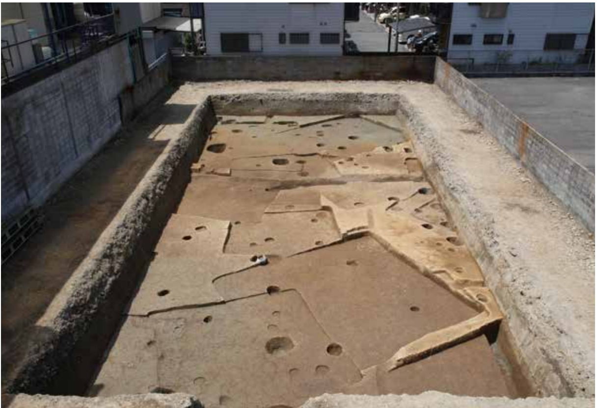
平安京右京六条四坊一町跡（西京極遺跡）：竪穴建物からなる古墳時代の集落跡（東から）