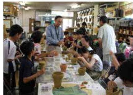
小・中学生夏期教室

(2016. 8. 2～3, 8. 4～5 2日間の日程を2回開催) 参加者 19組27名