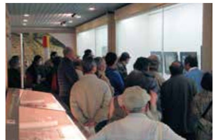
発掘調査成果写真展 2016

蓮華王院三十三間堂発掘調査他の写真パネル5点に加えて、出土遺物18点を展示した。