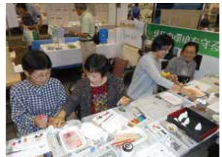
伏見人形色付け体験