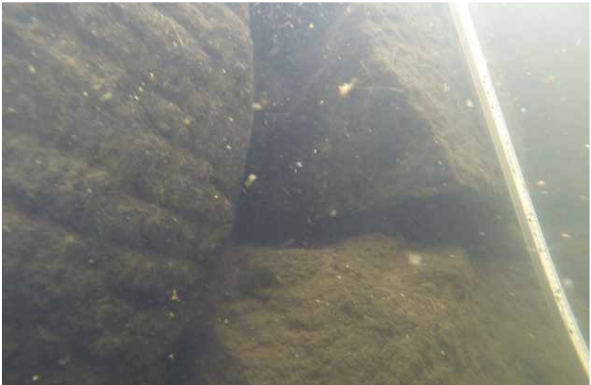
旧二条離宮（二条城）：北堀の北面石垣水中部分の状況（南から）

平安京右京城では、右京七条一坊七町跡（2）で、皇嘉門大路の東築地跡を検出した。この築地は、地震によって倒壊したことが明らかになった。西寺跡（7, 18）では 2 件の調査を実施し、井戸や整地層を検出した。その結果、寺域北部の土地利用の一端が解明できた。さらに、下層では唐橋遺跡に関する弥生時代の方形周溝墓を検出した。また、右京六条四坊一町跡（3）では、平安時代の遺構の下層で西京極遺跡に関する竪穴建物からなる集落跡を検出した。