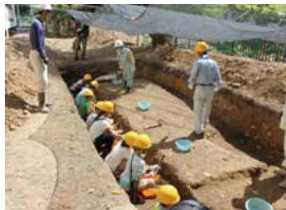
伏見城跡発掘調査体験