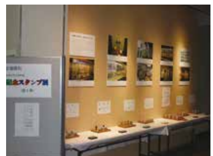
企画陳列「記念スタンプ展 第1弾」