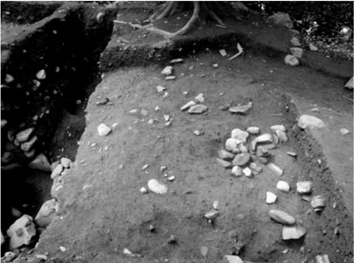
2 1区掘下げ部 (北から)