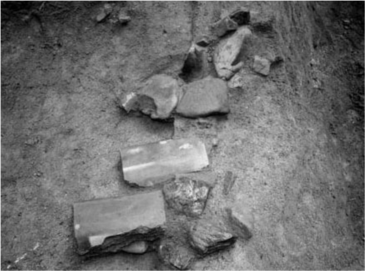
1 1区SX 2 (東から)