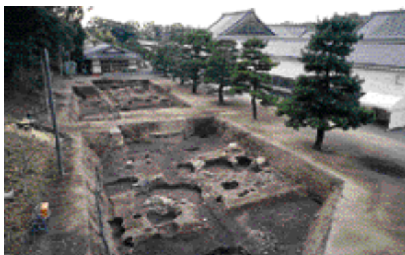
3 平安京冷泉院跡 中京区二条通堀川西入る二条城町

上賀茂小学校の調査で古墳時代の流路と建物跡を発見。川の両岸に古墳時代の集落があり、壺や器台も見つかっている。