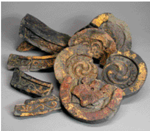
10 上京中学校構内出土の金箔瓦 上京区一条通室町西入る東日野殿町 大名屋敷に使われていたとみられる桃山時代の金箔瓦が出土した。軒丸・軒平瓦や鯨など数百点を確認した。