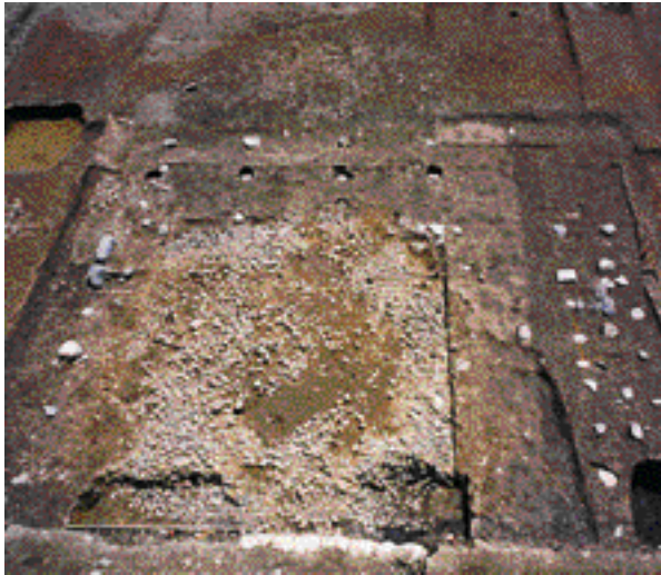
6 平安京右京六条一坊六町 下京区中堂寺南町 鎌倉時代の御堂跡を発見。貴族の邸宅内での持仏堂跡の確認は平安京内では初めてで、川原石を多量に用いた地業が施されていた。