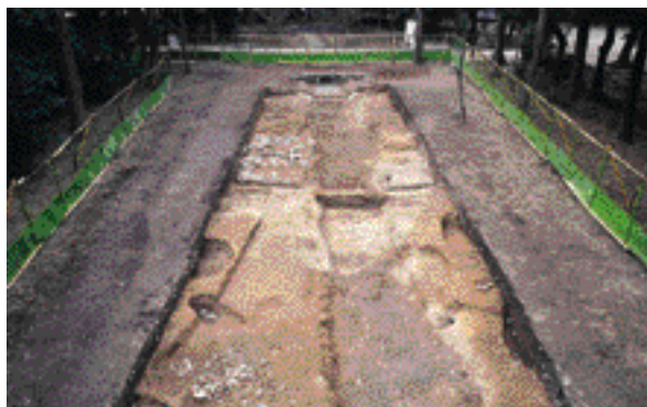
5 史跡賀茂御祖神社境内(国指定) 左京区下鴨泉川町

「蚕ノ社」でなじみの古社で、神池には石製の三柱鳥居がある。境内の北東隅で、平安時代後期以降とみられる泉の跡が見つかった。