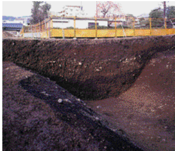
9 山科本願寺跡 山科区音羽伊勢宿町 浄土真宗中興の祖、蓮如が隠棲した山科本願寺南殿のやぐら跡と土塁・濠を検出し、現存する濠や土塁とのつながりが確認できた。