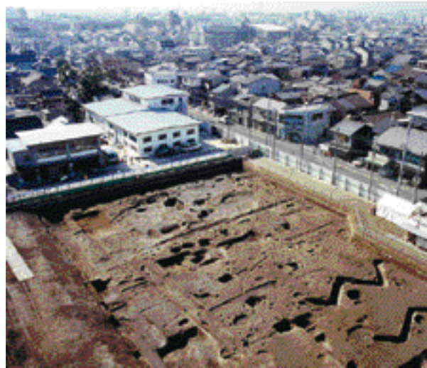
7 東寺(教王護国寺)旧境内 南区壬生通八条下の東寺町 洛南高等学校構内で、室町時代後期の仏間を備えた客殿風建物を検出。この時期には東寺の子院が形成されていた事がわかる。