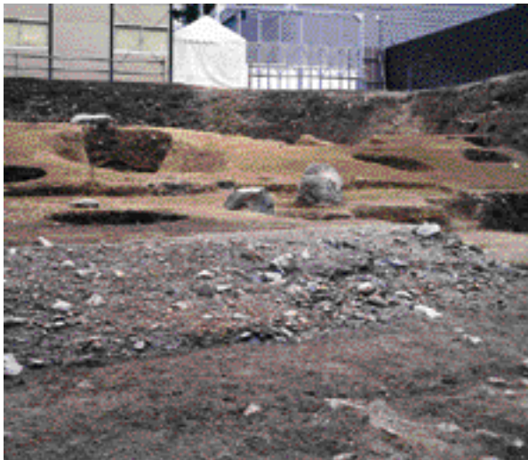
8 二条殿跡 中京区両替町通御池上の金吹町 二条殿として洛中洛外図屏風に描かれている室町時代の二条家の庭園跡。文献に伝わる「龍躍池」の庭石と洲浜が見つかった。