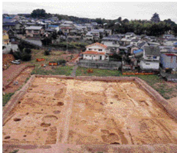
11 伏見城跡 伏見区深草大亀谷六躰町、万帖敷町 桃山時代から江戸時代前半の建物跡と道路を検出。城下町の惣構のすぐ北にあたり、外側にも町屋が広がっていたことがわかった。