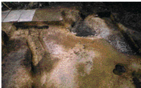
4 史跡木嶋坐天照御魂神社境内(市指定) 右京区太秦森ヶ東町

二条城内で冷泉院の園池跡を確認した。池の南東部分は、平安時代から室町時代まで造り替えられながら続いていた。