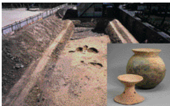
2 植物園北遺跡 北区上賀茂烏帽子ヶ垣内町

平安時代前期の邸宅にともなう池跡を検出した。池からは土器類のほか、池や周辺に生えていた植物の遺体や「齋衡四年」(857年)の紀年が記された題箋が出土した。