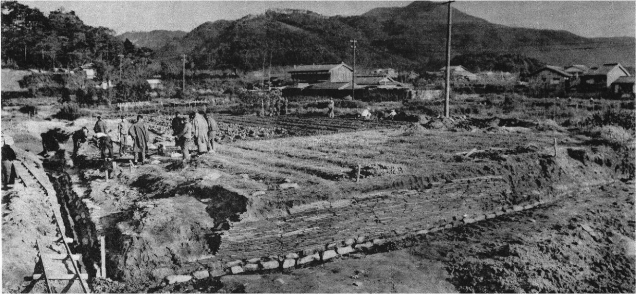
図5 北白川廃寺金堂跡の調査（『京都府史蹟名勝天然記念物調査報告』第19冊 1939年）