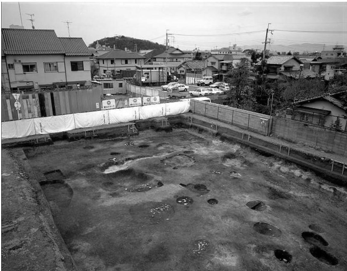
図2 縄文時代早期の集落（上終町遺跡） （「北白川廃寺2」『平成2年度京都市埋蔵文化財調査概要』1994年）