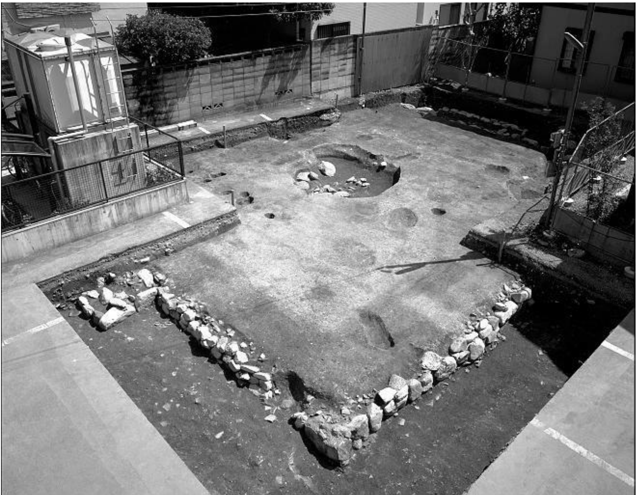
図6 北白川廃寺塔跡の調査（「北白川廃寺」『京都市内遺跡発掘調査概報 平成7年度』京都市文化観光局 1996年）