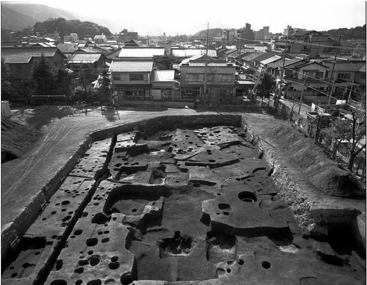
図7 飛鳥時代の集落 (「小倉町別当町遺跡」 『平成6年度京都市埋蔵文化財調査概要』 1996年)