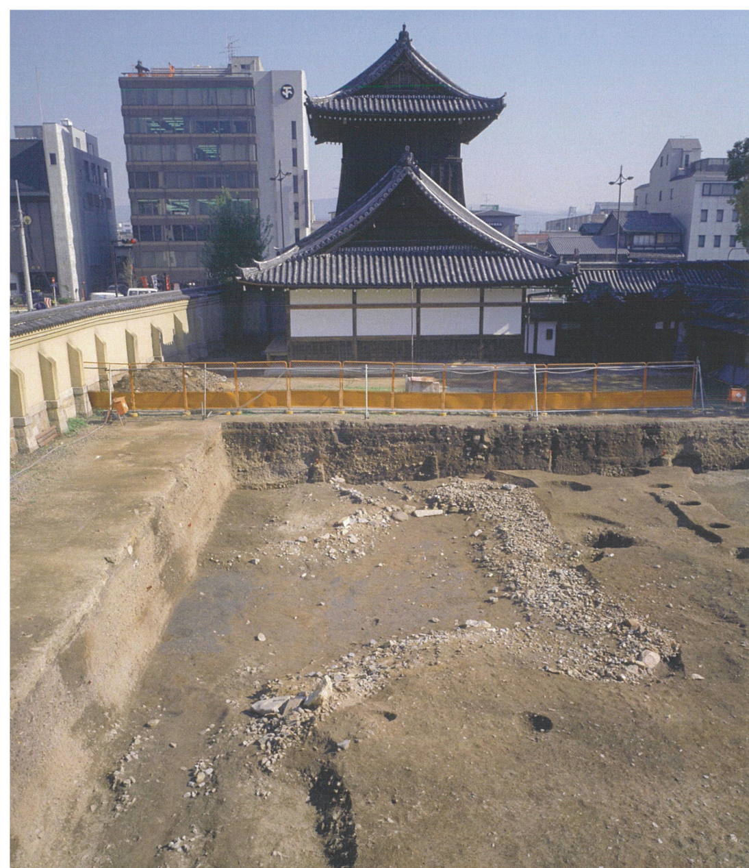
西本願寺境内 庭園遺構 (17世紀初め)