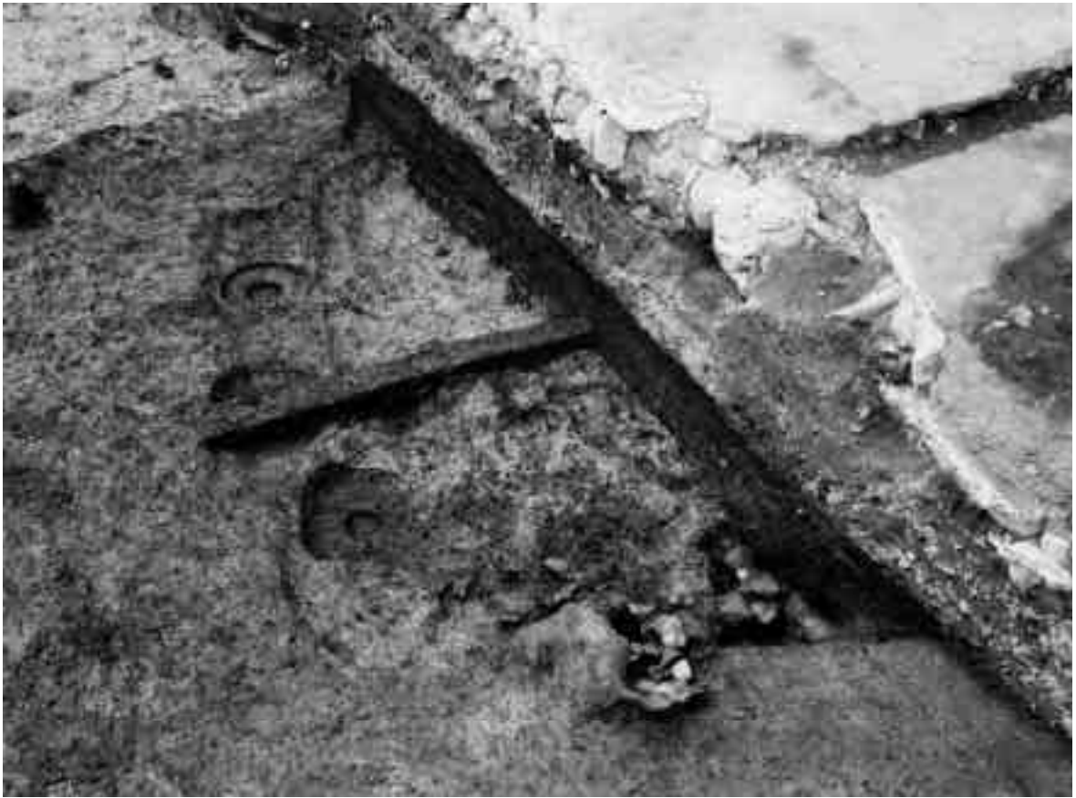
2 10区竪穴住居SH54（北東から）