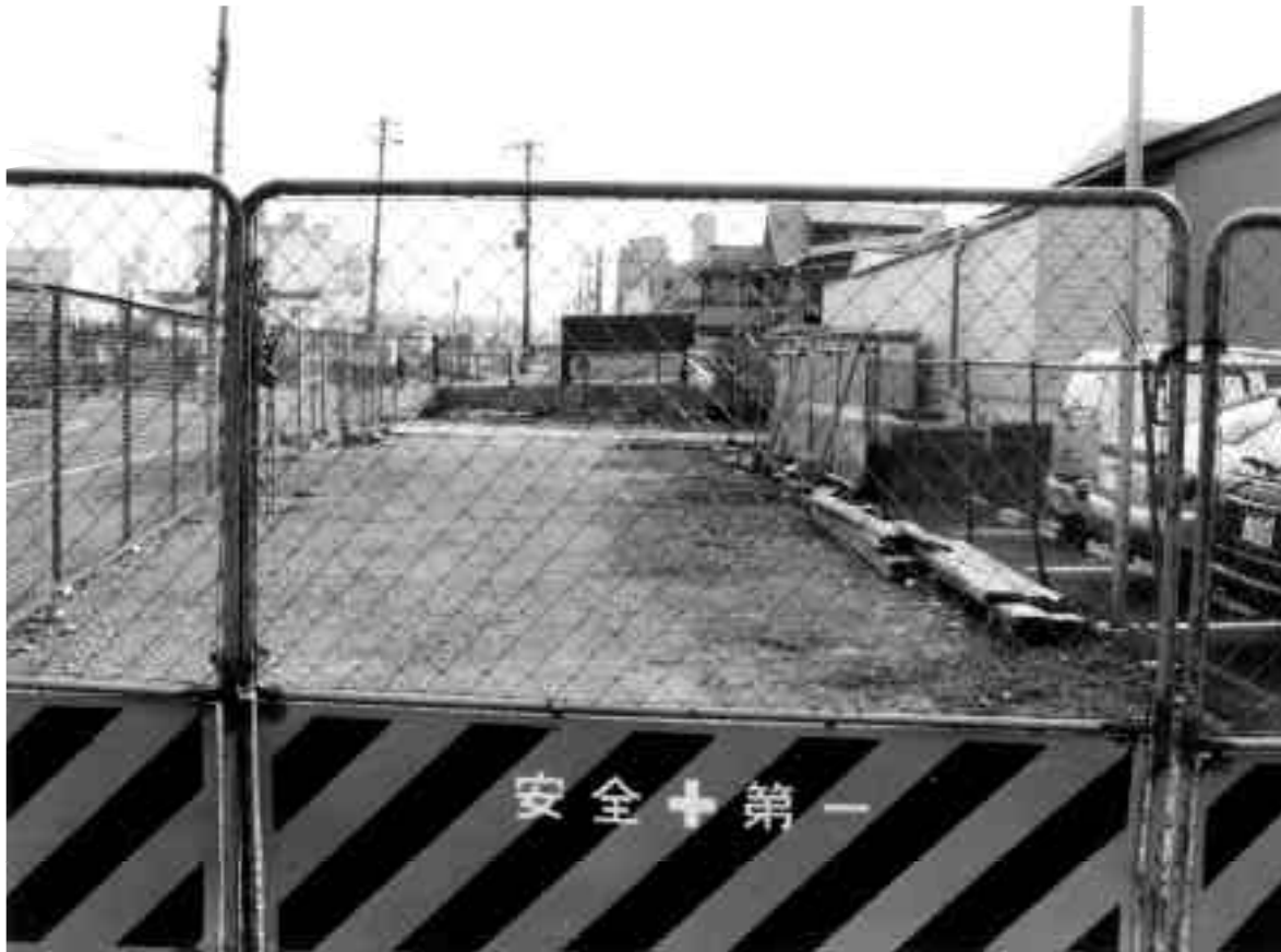
1 10区調査前全景（北から）