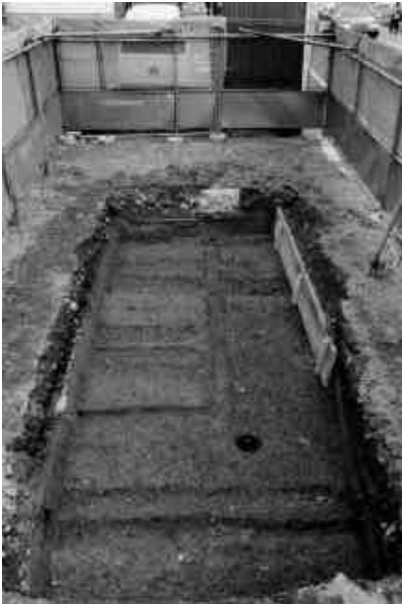
3 11区第2面全景（南から）