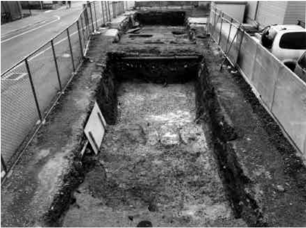
1 10区第1面全景（北から）