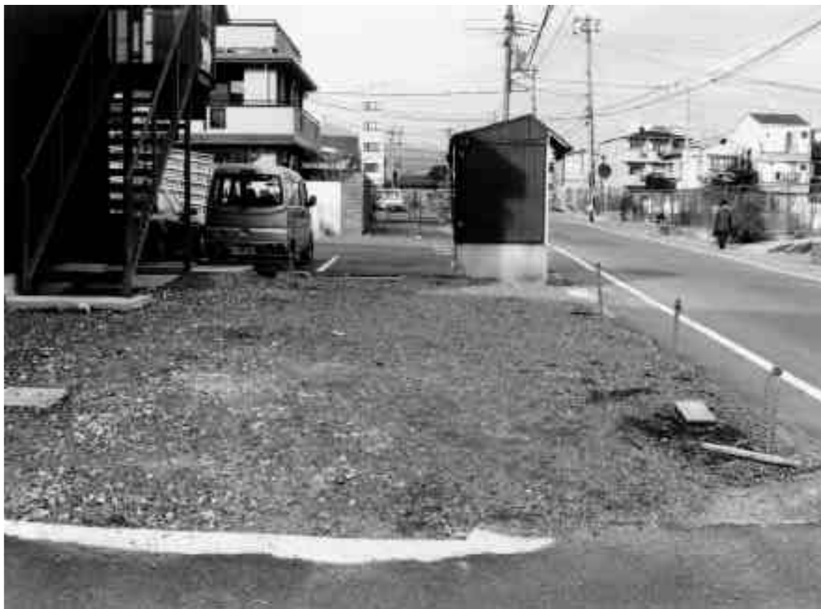
2 11区調査前全景（南から）