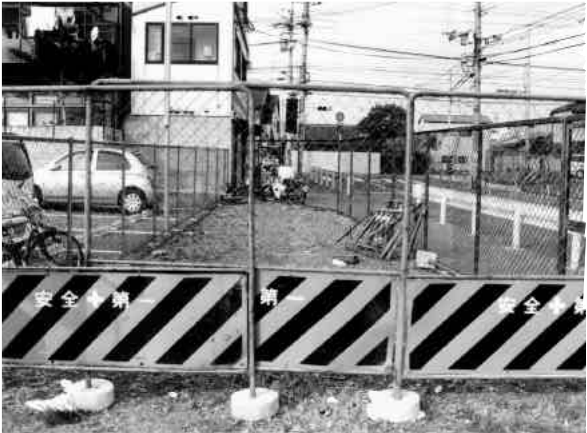
1 9区調査前全景（南から）