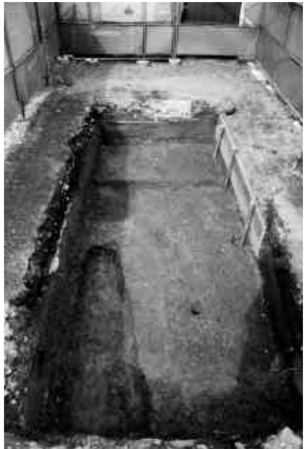
4 11区第3面全景（南から）