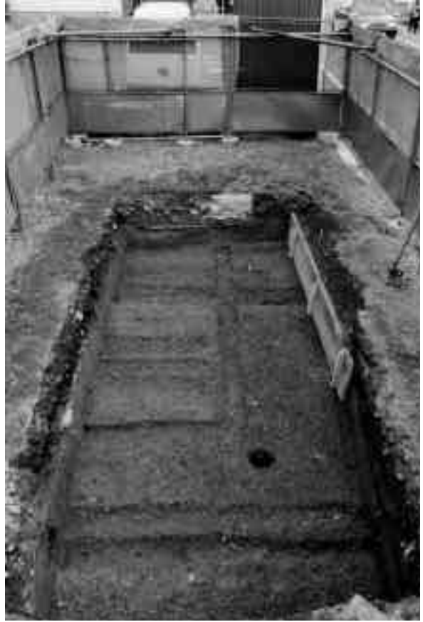
2 11区第1面全景（南から）