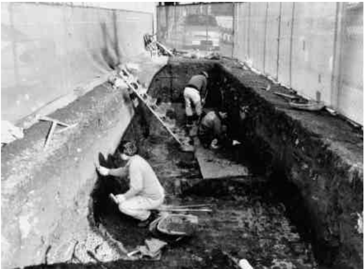
2 9区調査風景（南から）