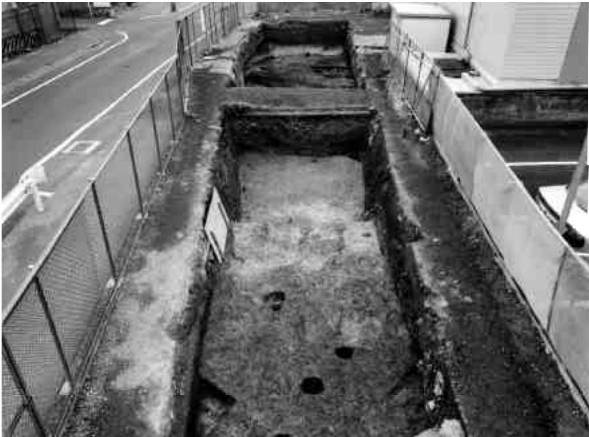
2 10区第3面全景（北から）