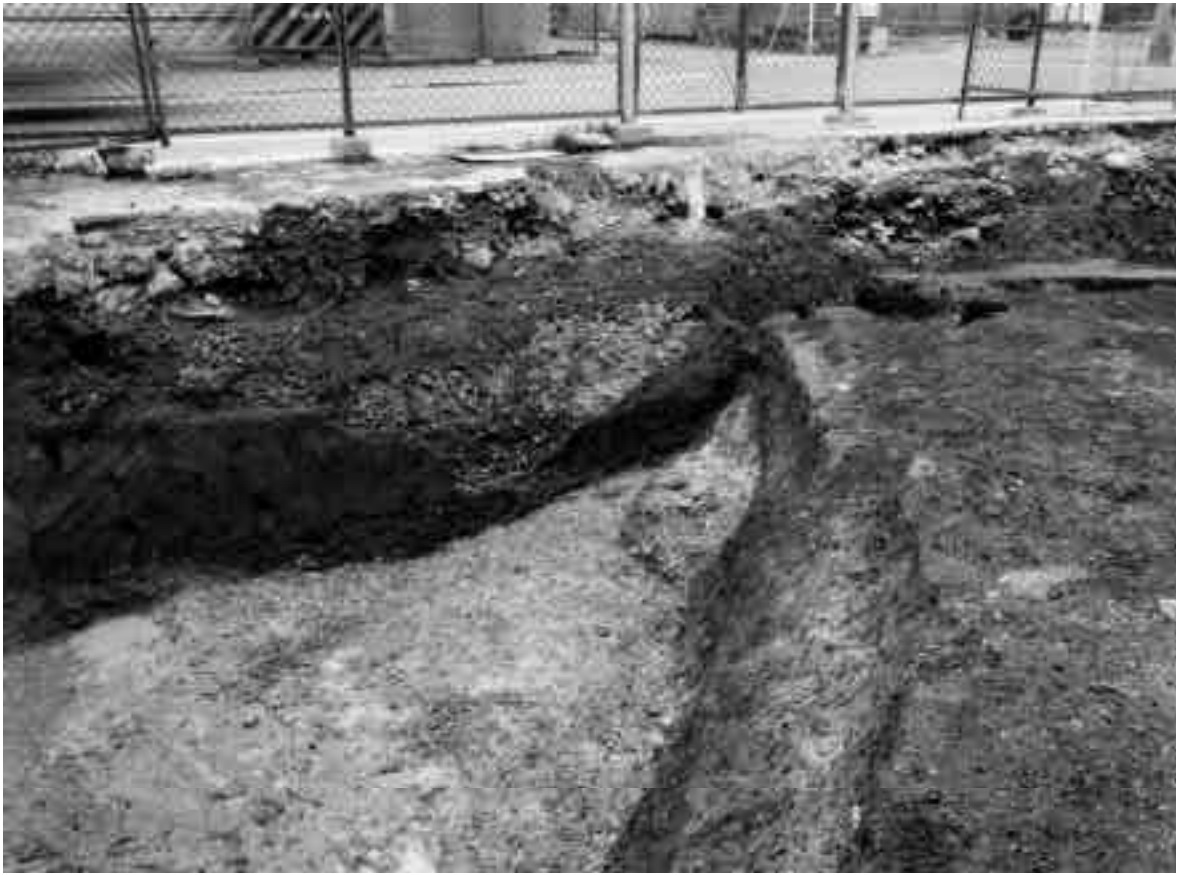
1 10区流路SX33東壁（西から）