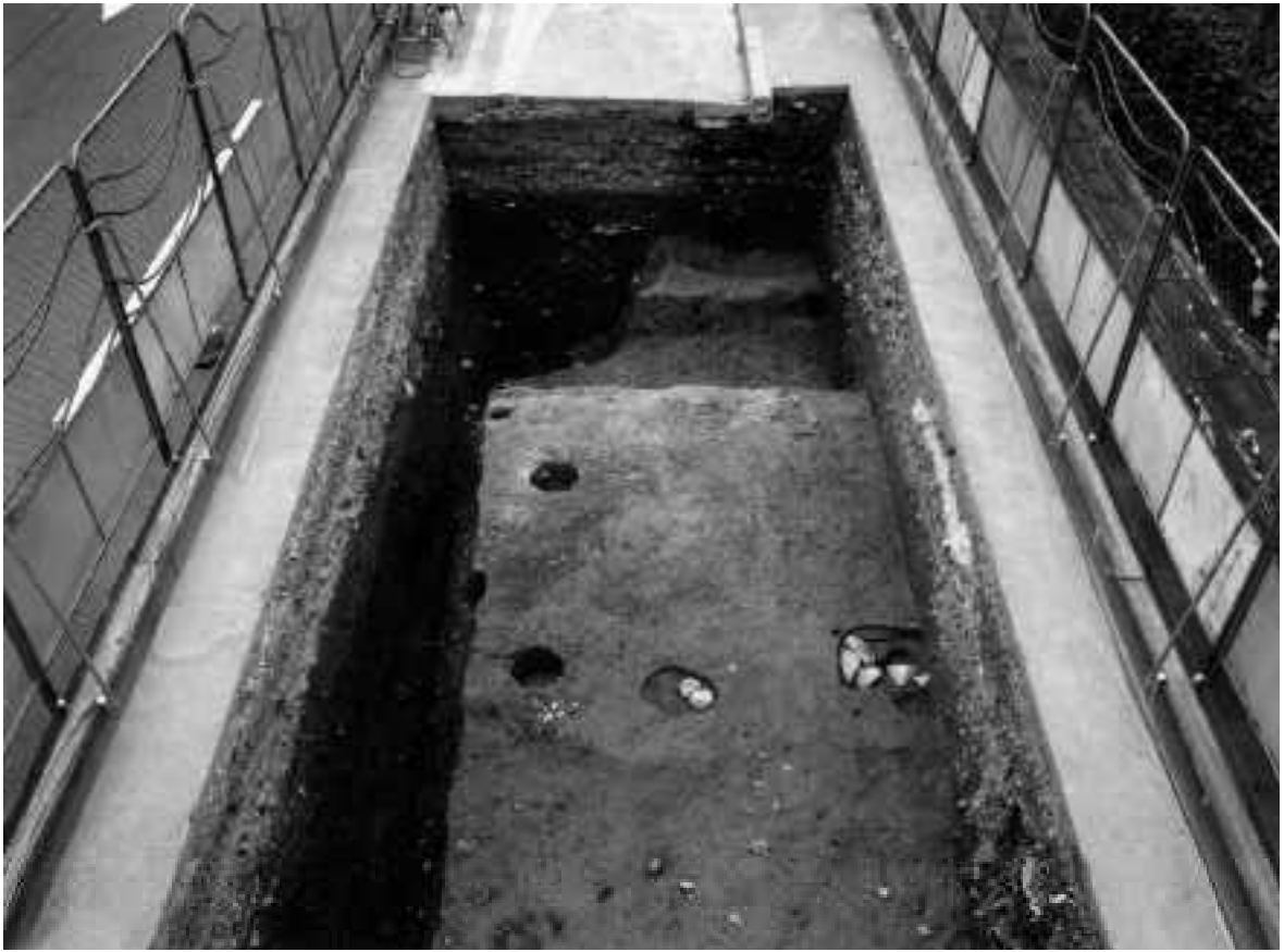
1 B区第2面全景(西から)