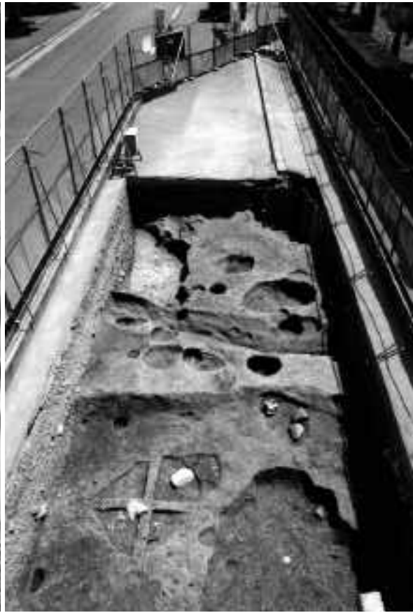
2 A区第6面全景（西から）