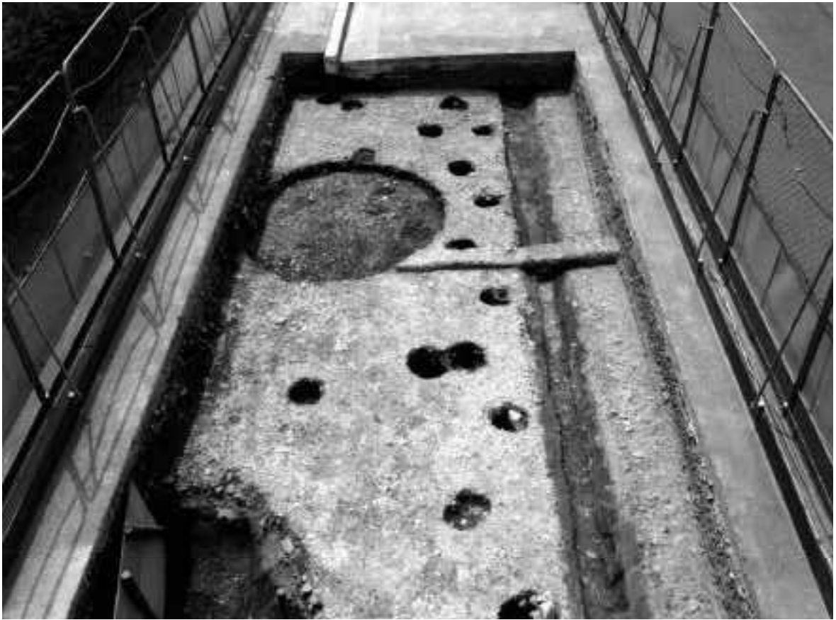
2 A区第3面全景（東から）