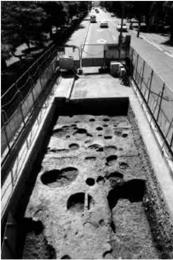
1 A区第4・5面全景（東から）