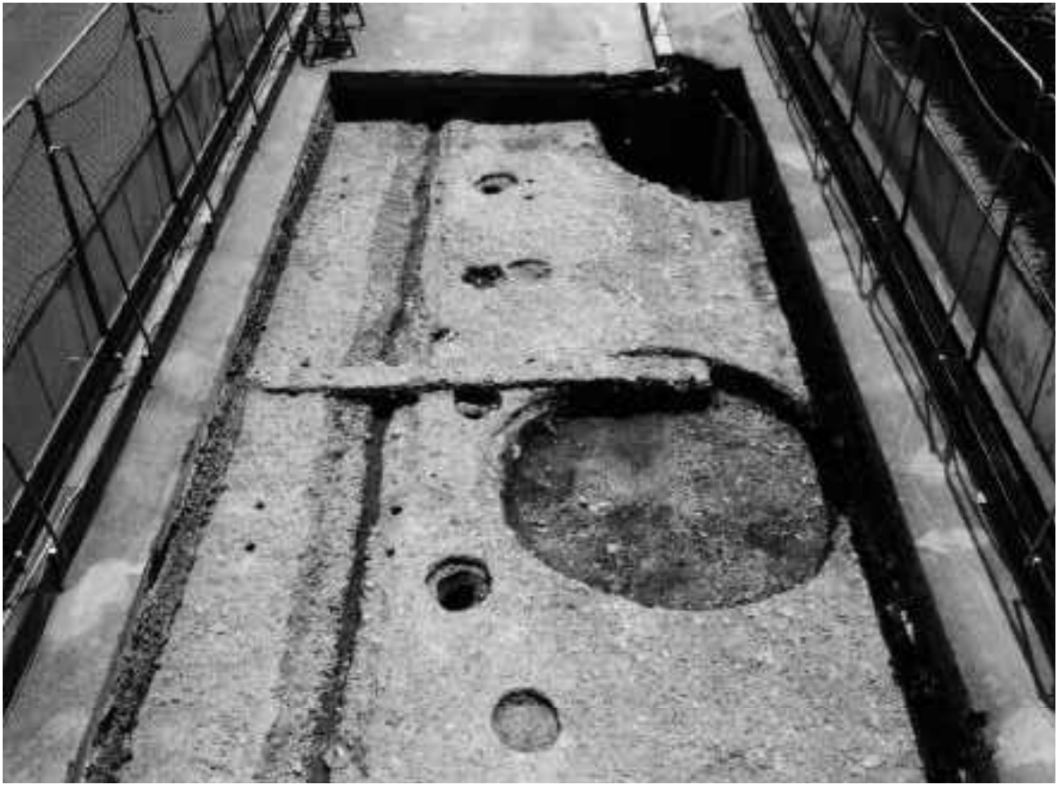
1 A区第2面全景（西から）