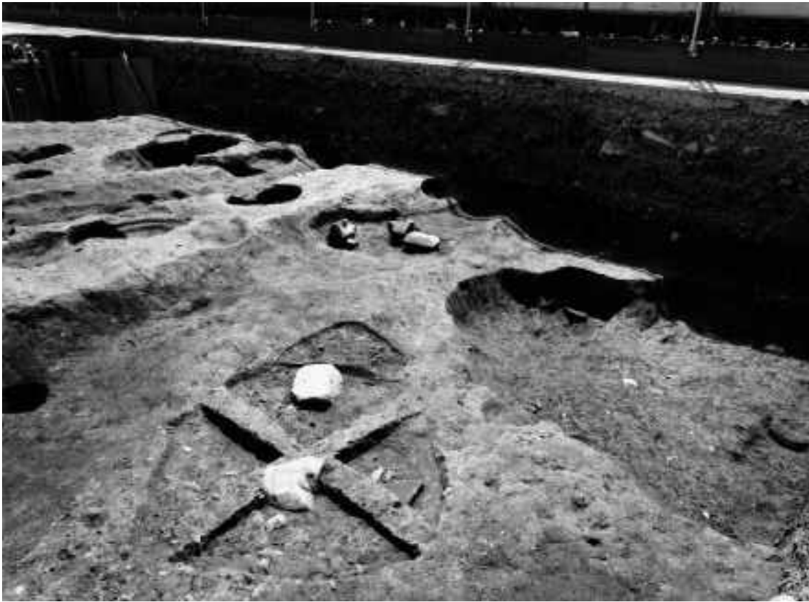
3 A区第6面P93・P90・SX89（北西から）