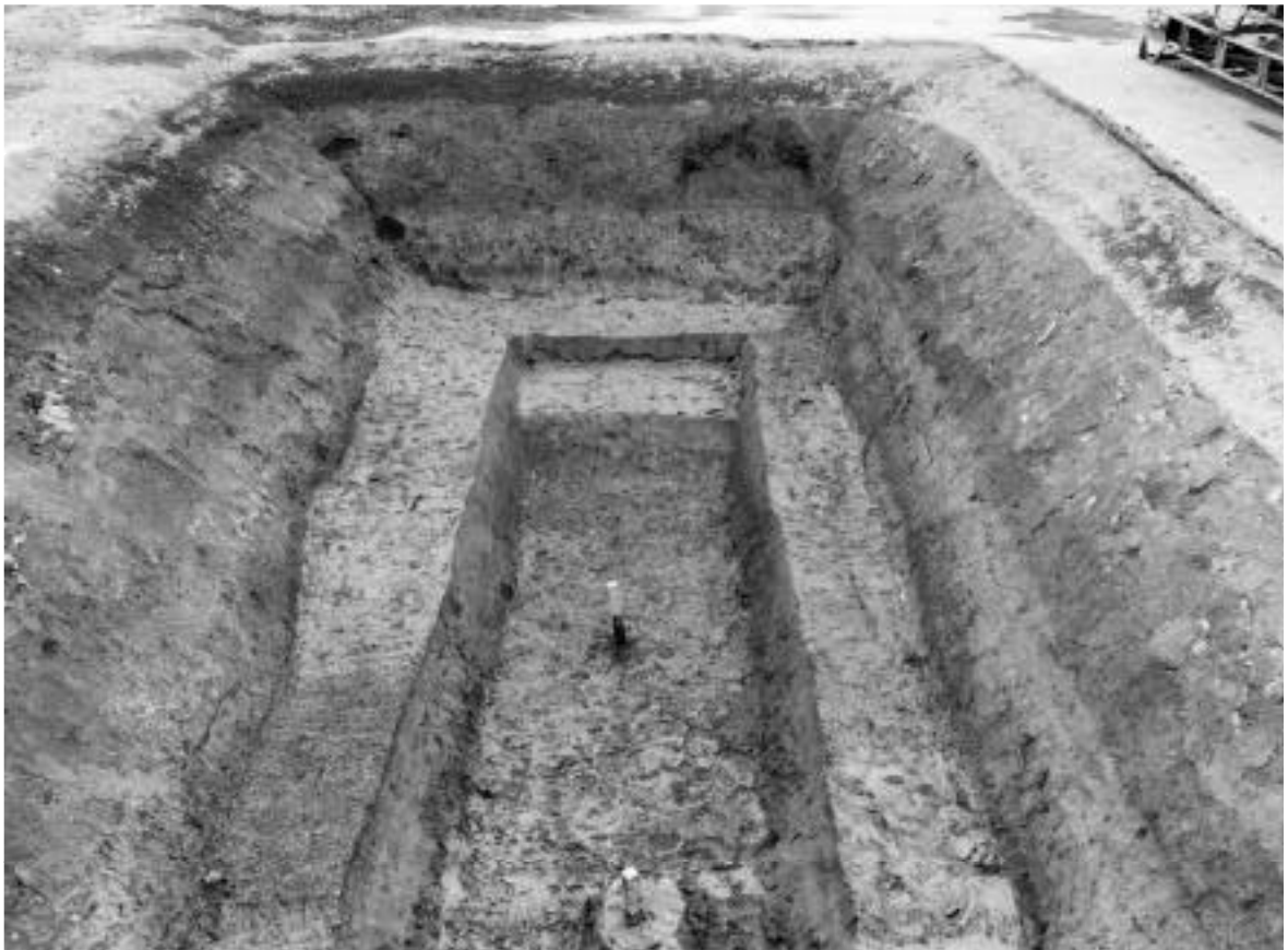
2 2区第2面全景(東から)