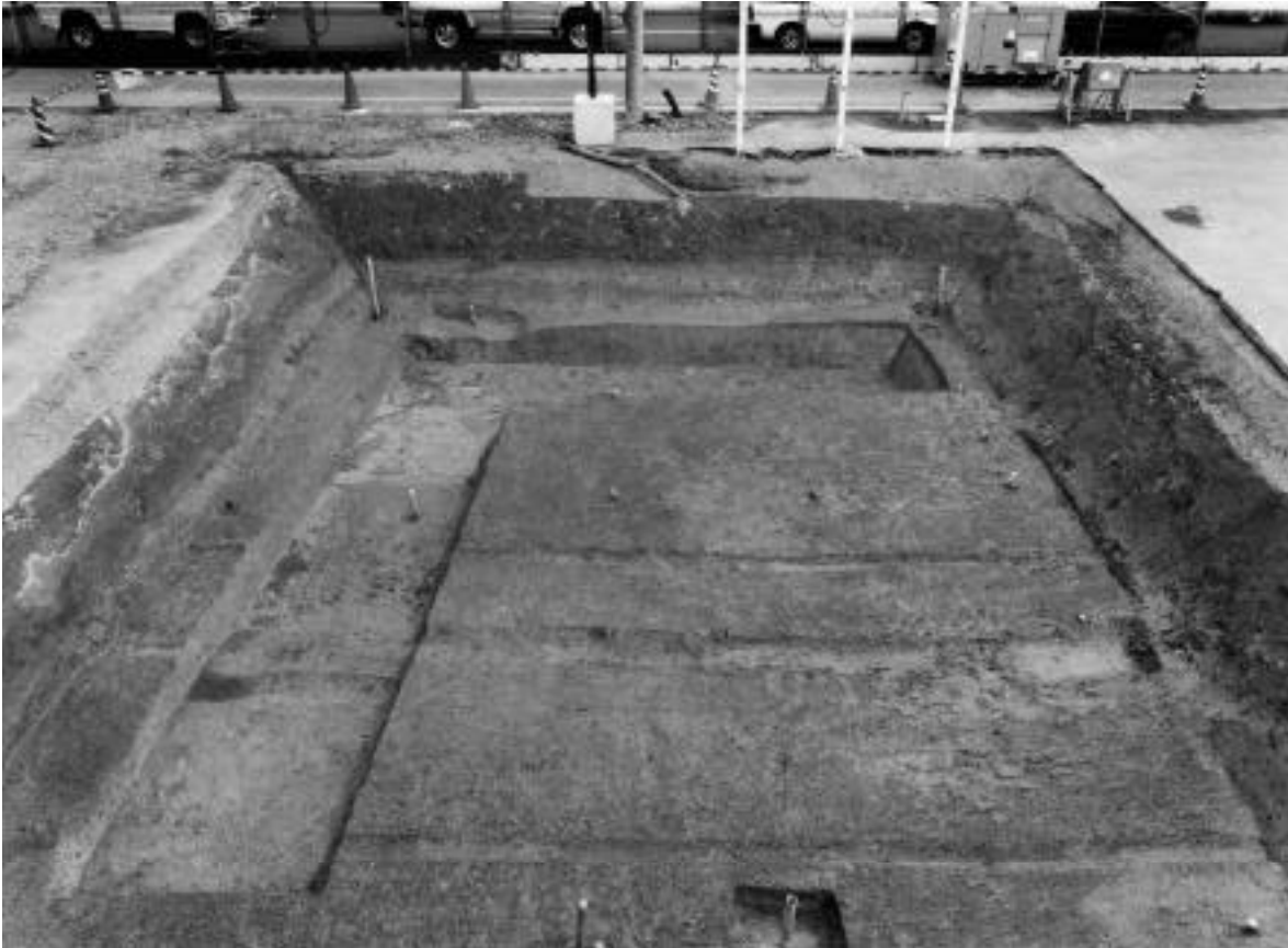
2 1区第2面全景(西から)