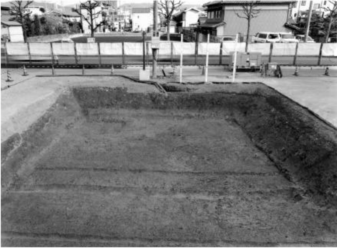
1 1区第1面全景(西から)