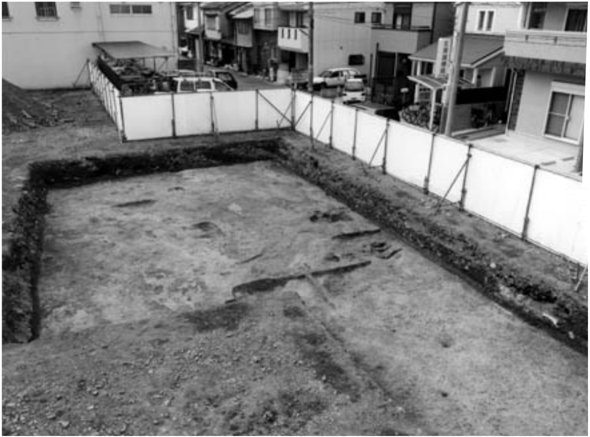
1 調査区全景（北東から）