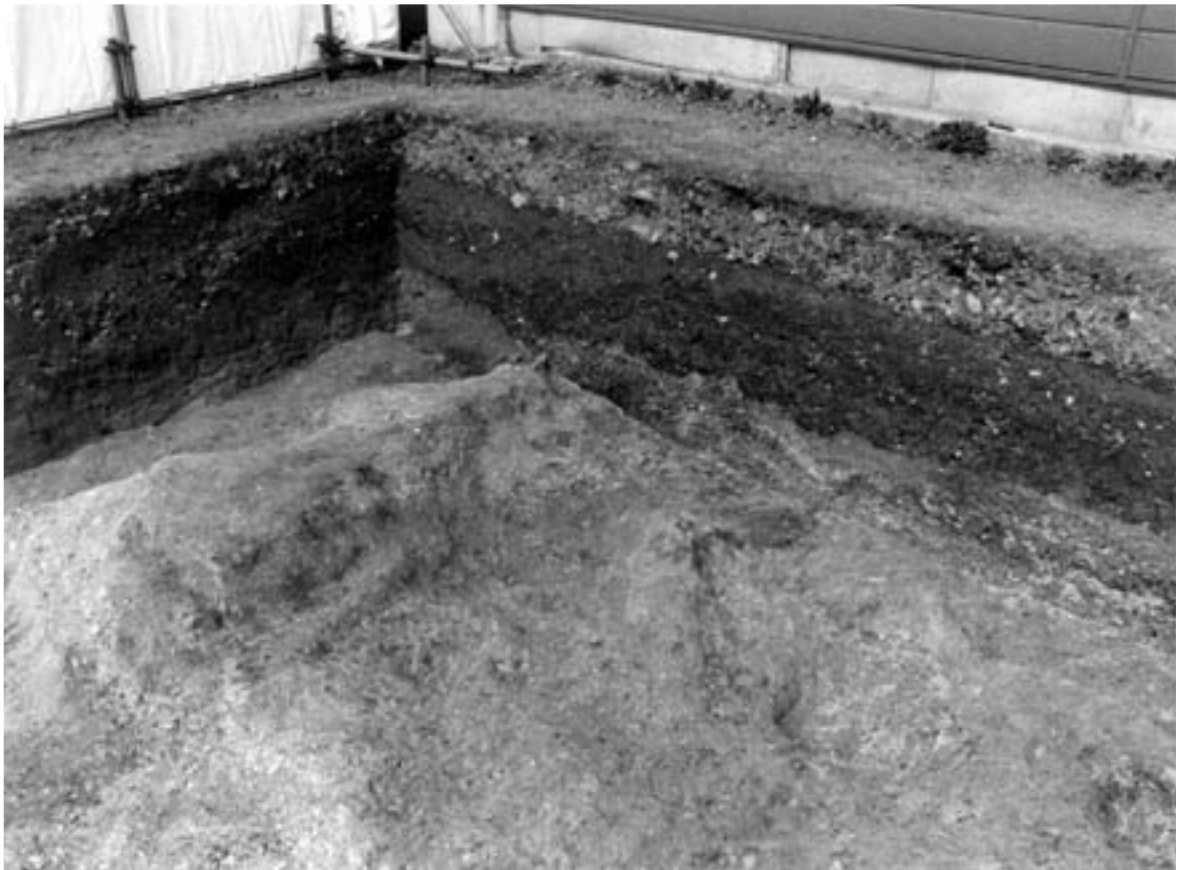
2 北壁・西壁断面（南東から）