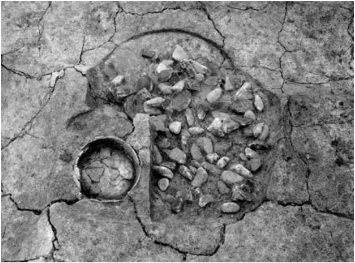
1 埋納遺構 2 (東から)