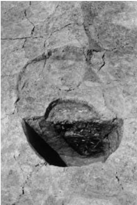
3 建物4 柱穴192 (東から)