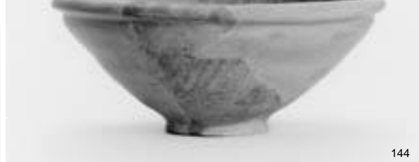
溝 1 ~ 3 出土土器