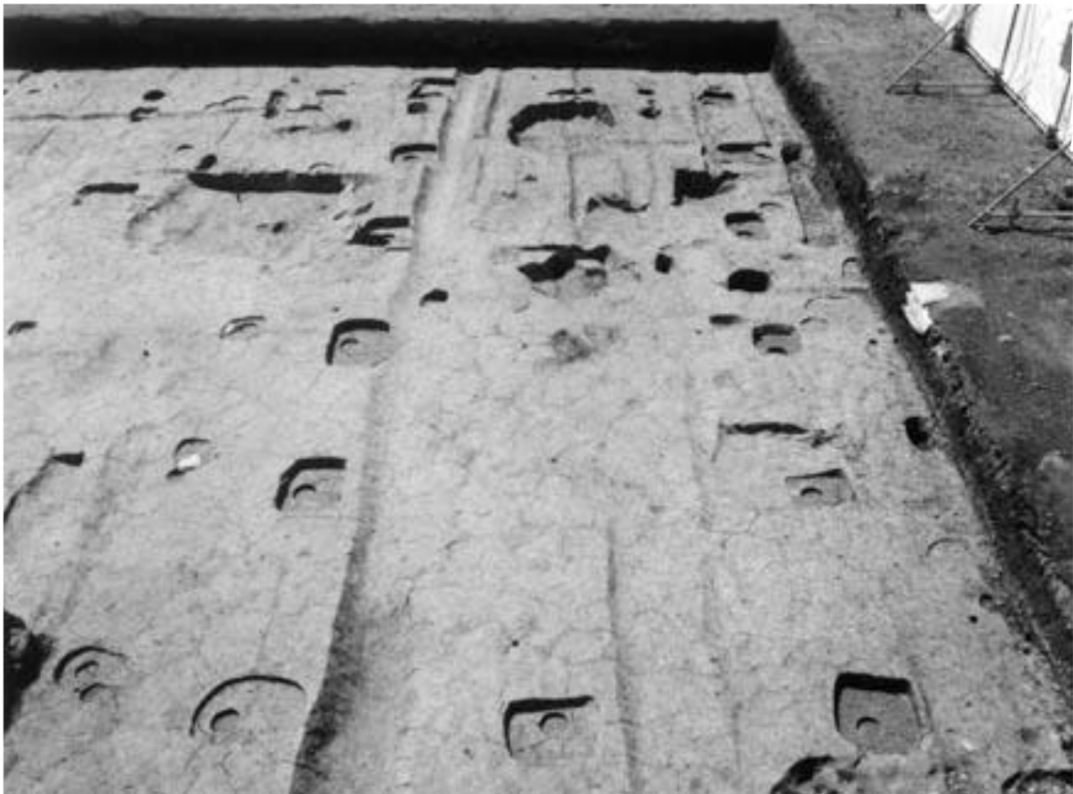
2 建物1 (北から)