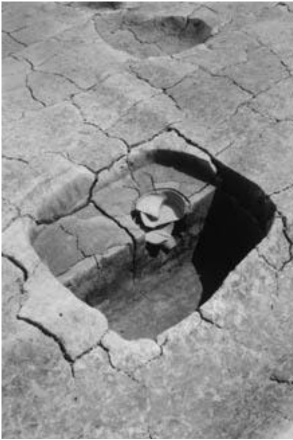
1 建物1 柱穴174 (北西から)