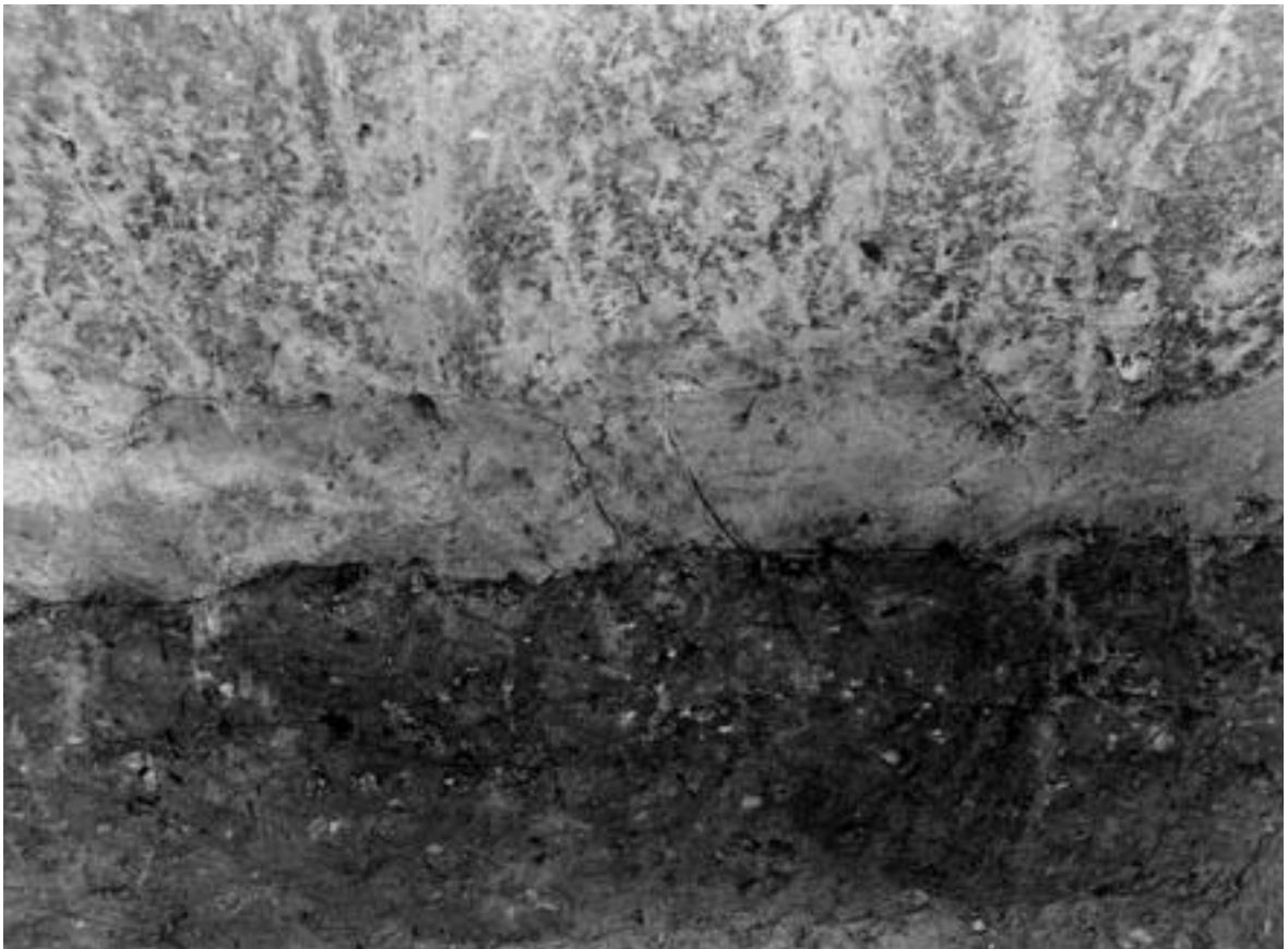
2 南壁断面 火山灰層 (北から)