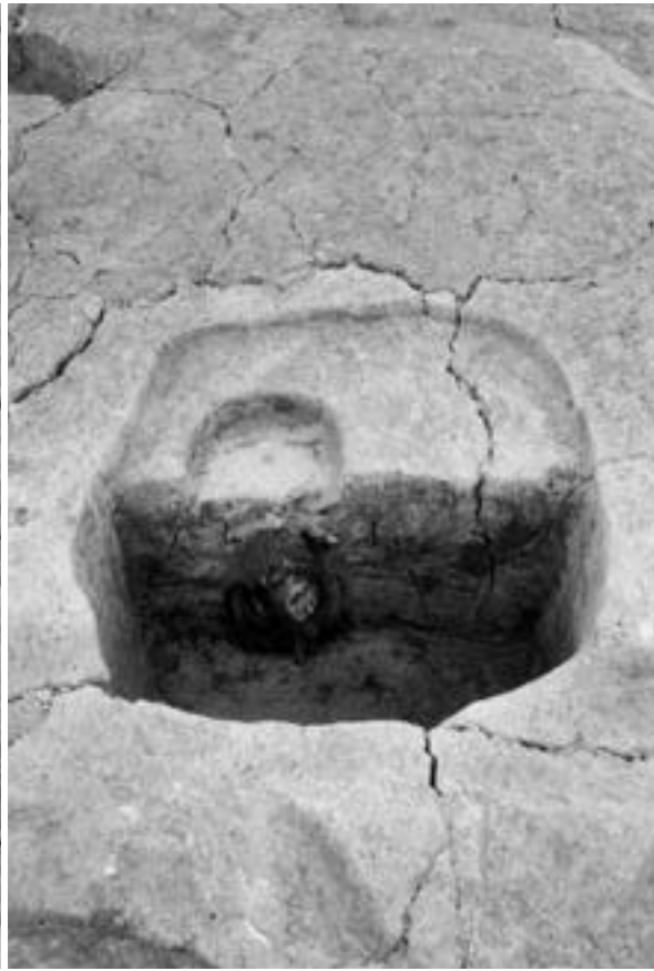
2 建物5 柱穴162 (北から)