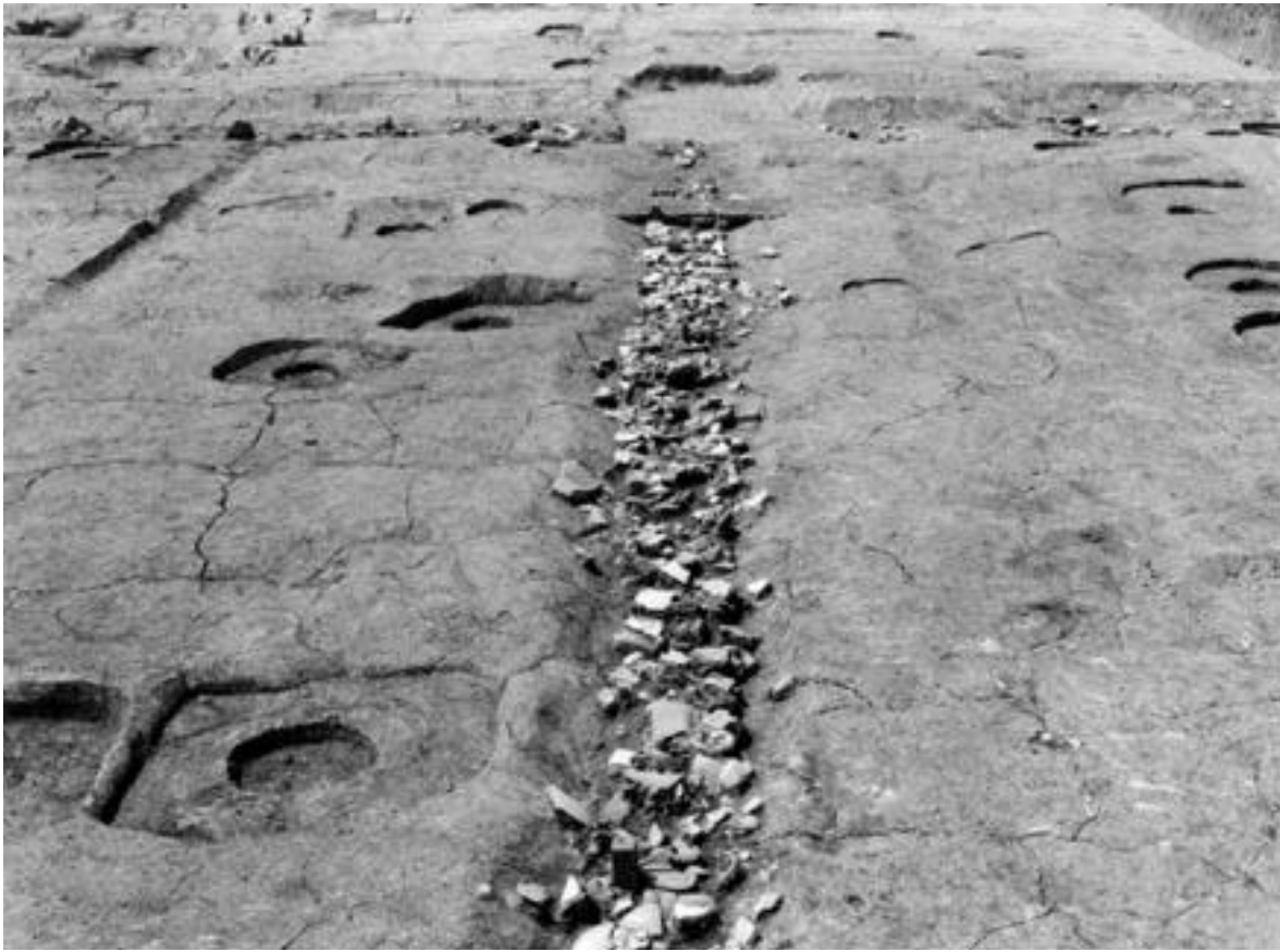
1 溝2 (東から)