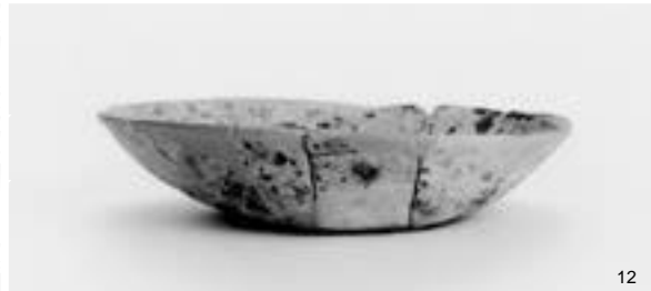
建物1 柱穴174・埋納遺構1～3出土土器