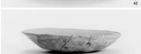
溝 2 出土土器